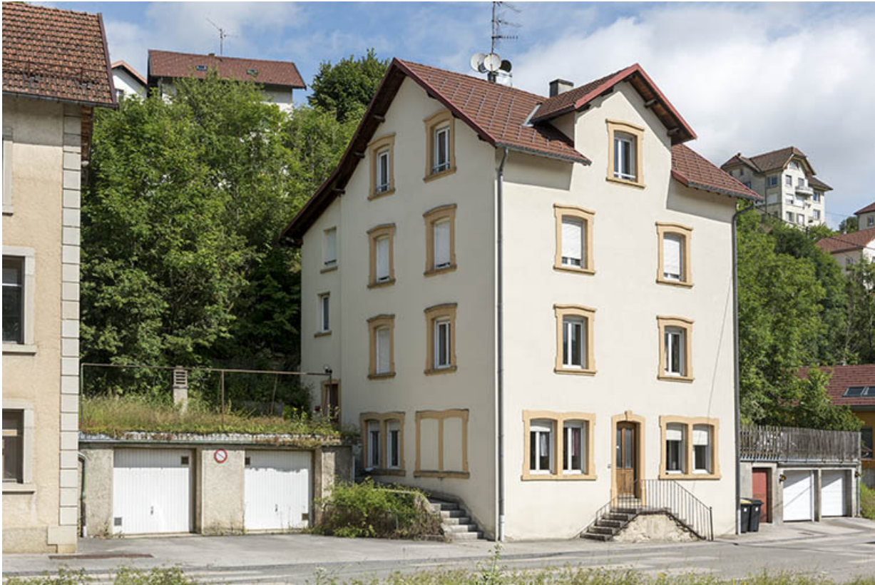
Façades antérieure et latérale gauche.