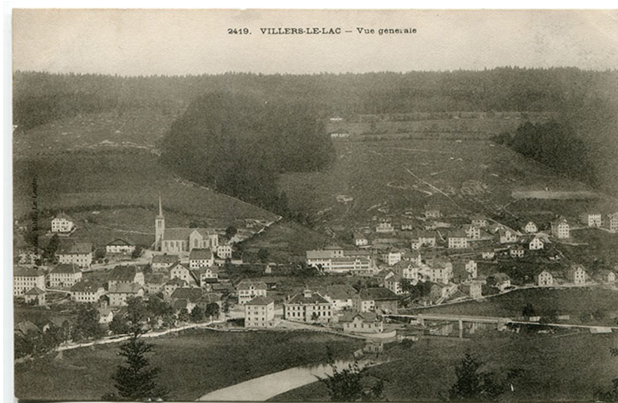
2419. Villers-le-Lac - Vue générale [vue d'ensemble du village depuis le sud-ouest], entre 1898 et 1903. Le bâtiment, à droite, est coiffé d'une terrasse.