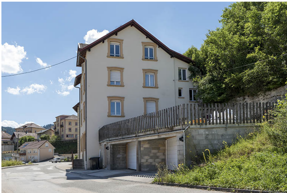
Façade latérale droite.