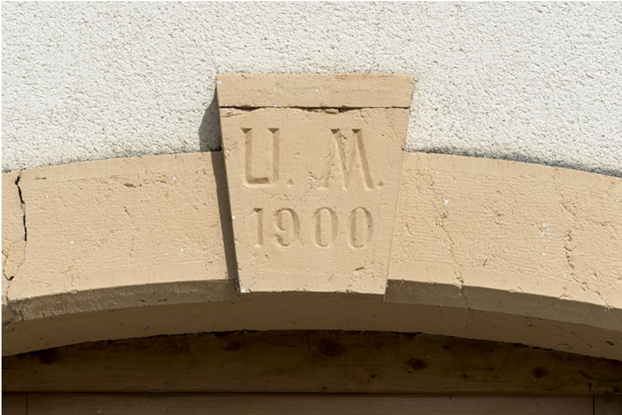
Façade antérieure : date et initiales sur le linteau de la porte.