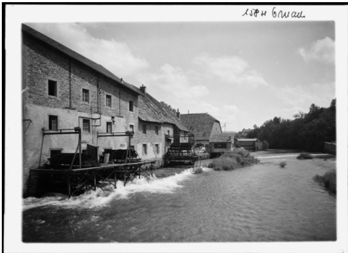
[Vue depuis l'aval], s.d. [vers 1930].