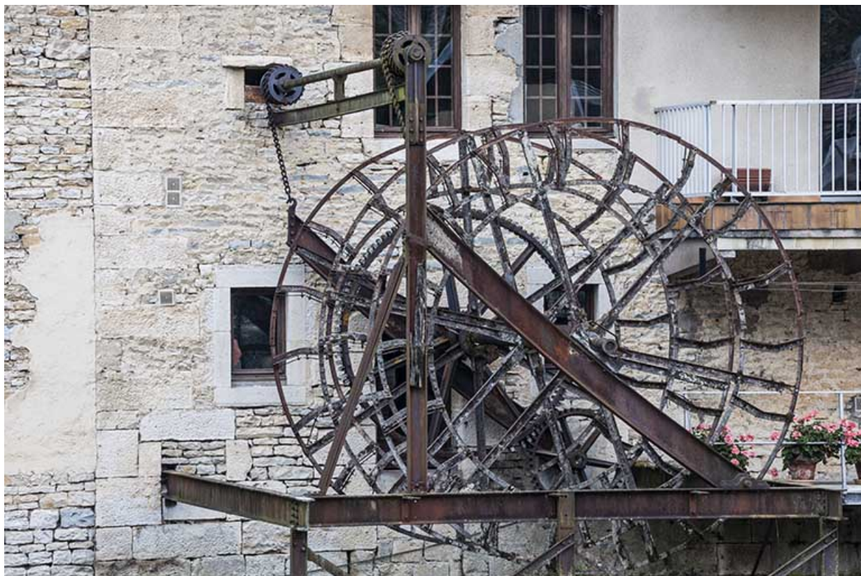
Détail de la roue pendante.