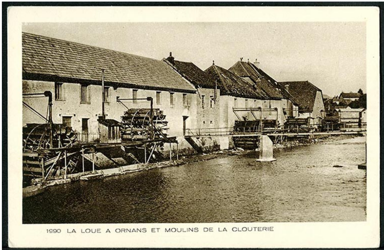
La Loue à Ornans et moulins de la clouterie, carte postale, s.d. [début 20e siècle].