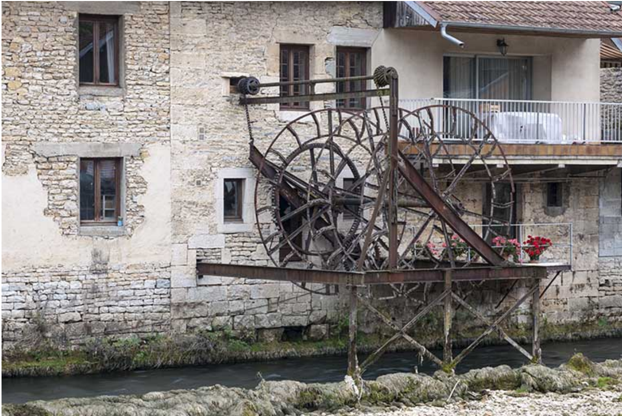
Façade sur la Loue. Roue pendante vue de trois quarts.