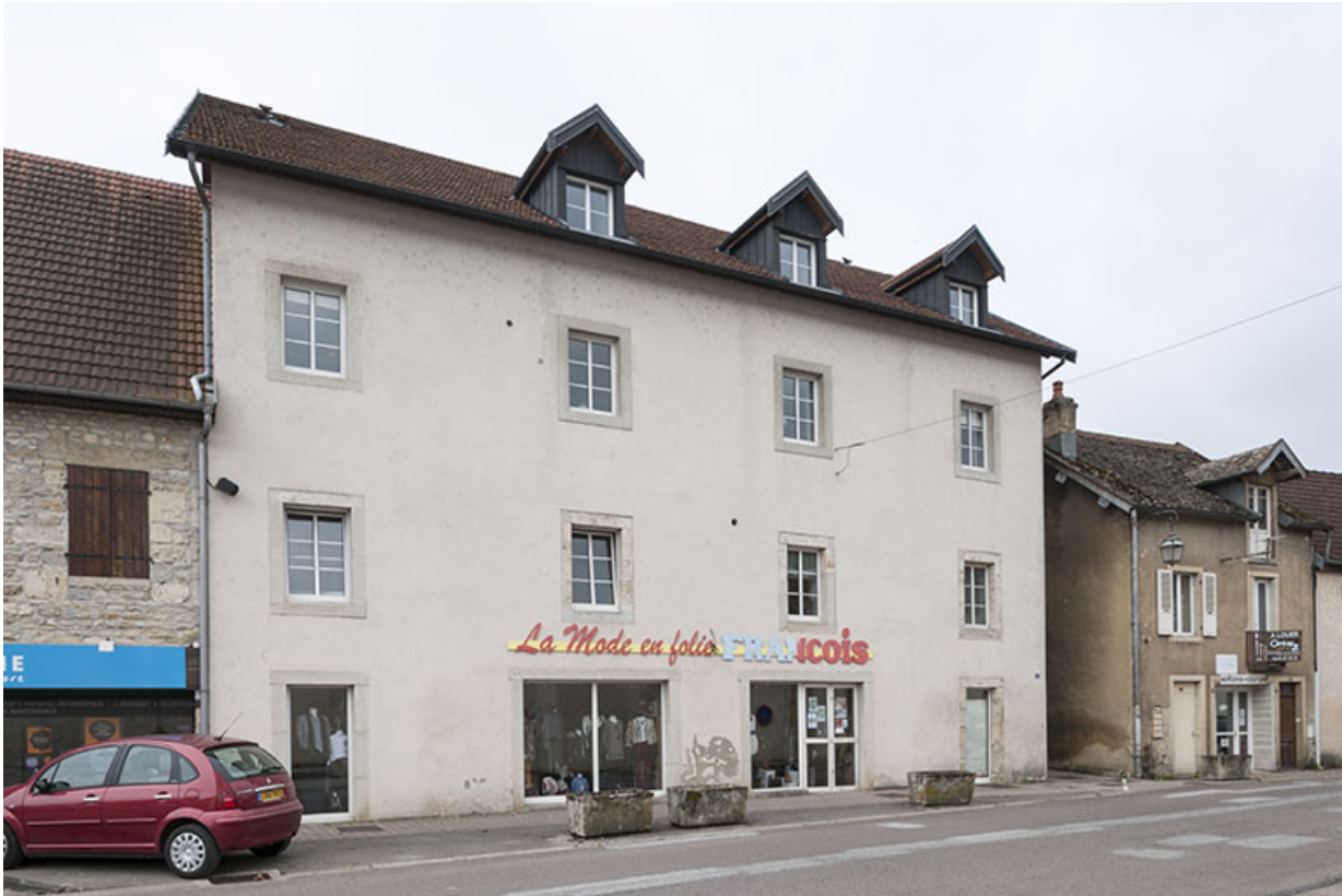
Partie ouest du moulin.