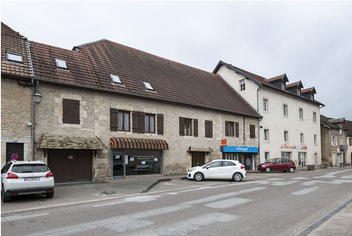
Vue d'ensemble depuis la rue.