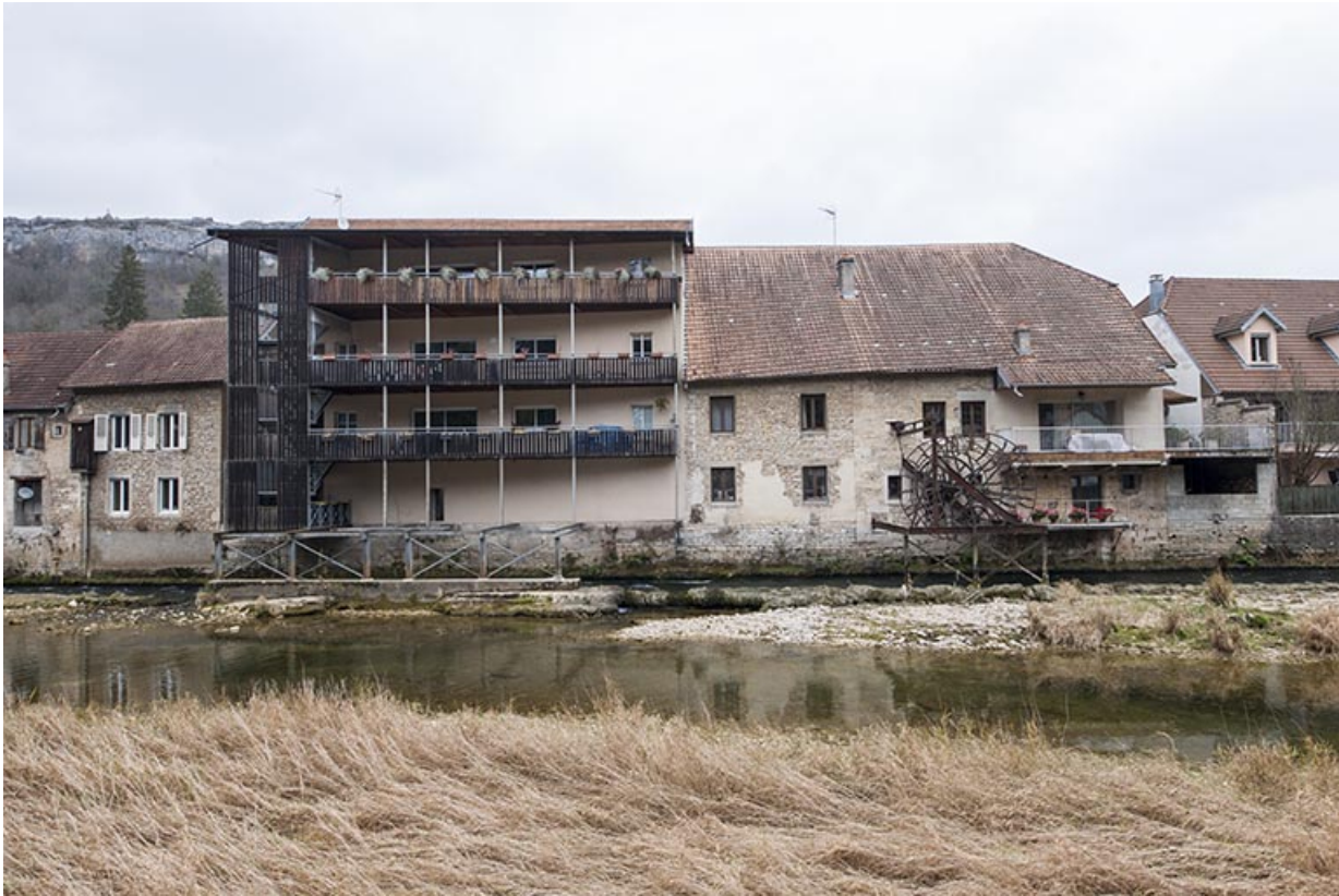
Façade sur la Loue depuis la rive gauche.