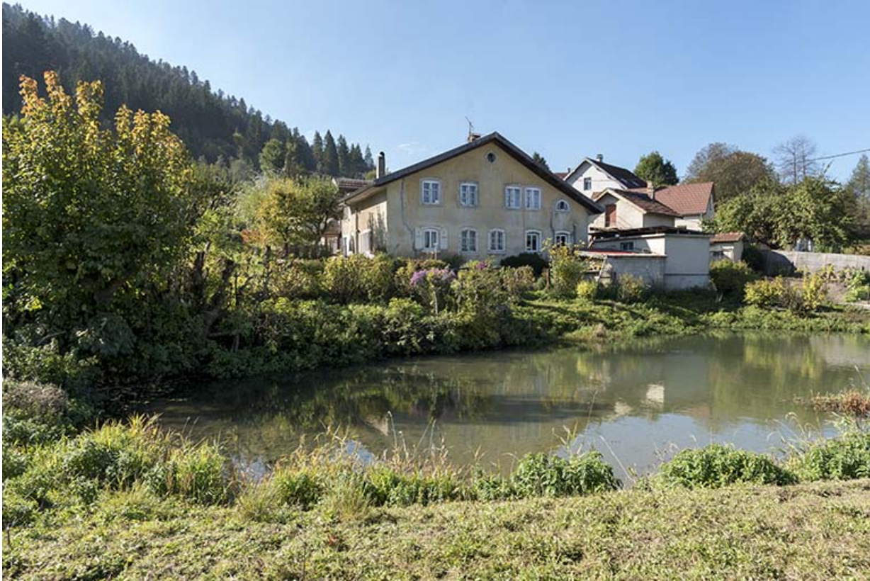
Vue d'ensemble, depuis le nord-est (façade latérale gauche).

25, Villers-le-Lac, 21 rue du Temple, lieudit : les Bassots