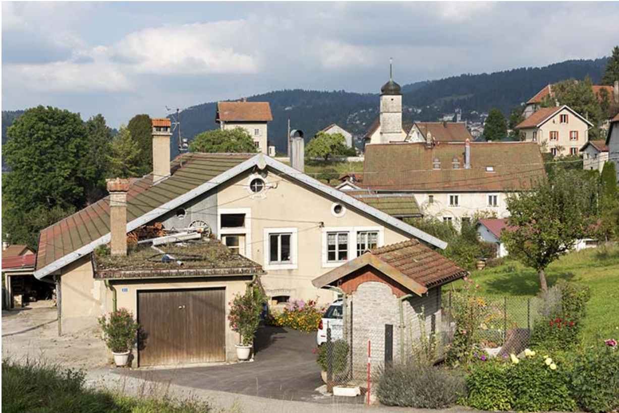
Vue d'ensemble, depuis le sud (façade latérale droite).

25, Villers-le-Lac, 21 rue du Temple, lieudit : les Bassots