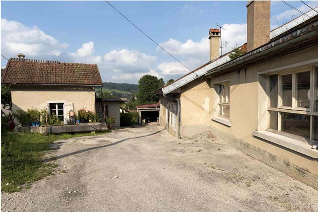
Façade antérieure vue en enfilade, avec la buanderie et la fontaine à gauche.

25, Villers-le-Lac, 21 rue du Temple, lieudit : les Bassots