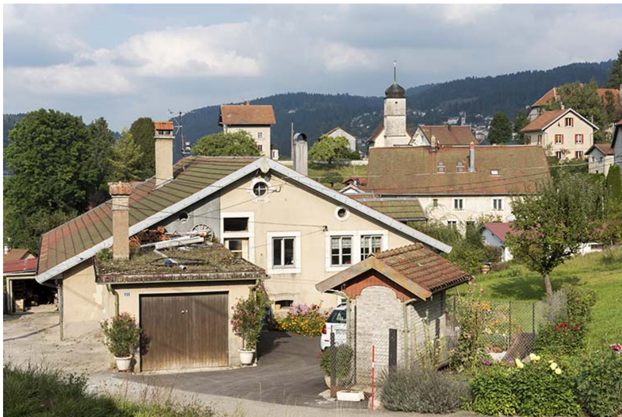
Vue d'ensemble, depuis le sud (façade latérale droite). 25, Villers-le-Lac, 21 rue du Temple, lieudit : les Bassots