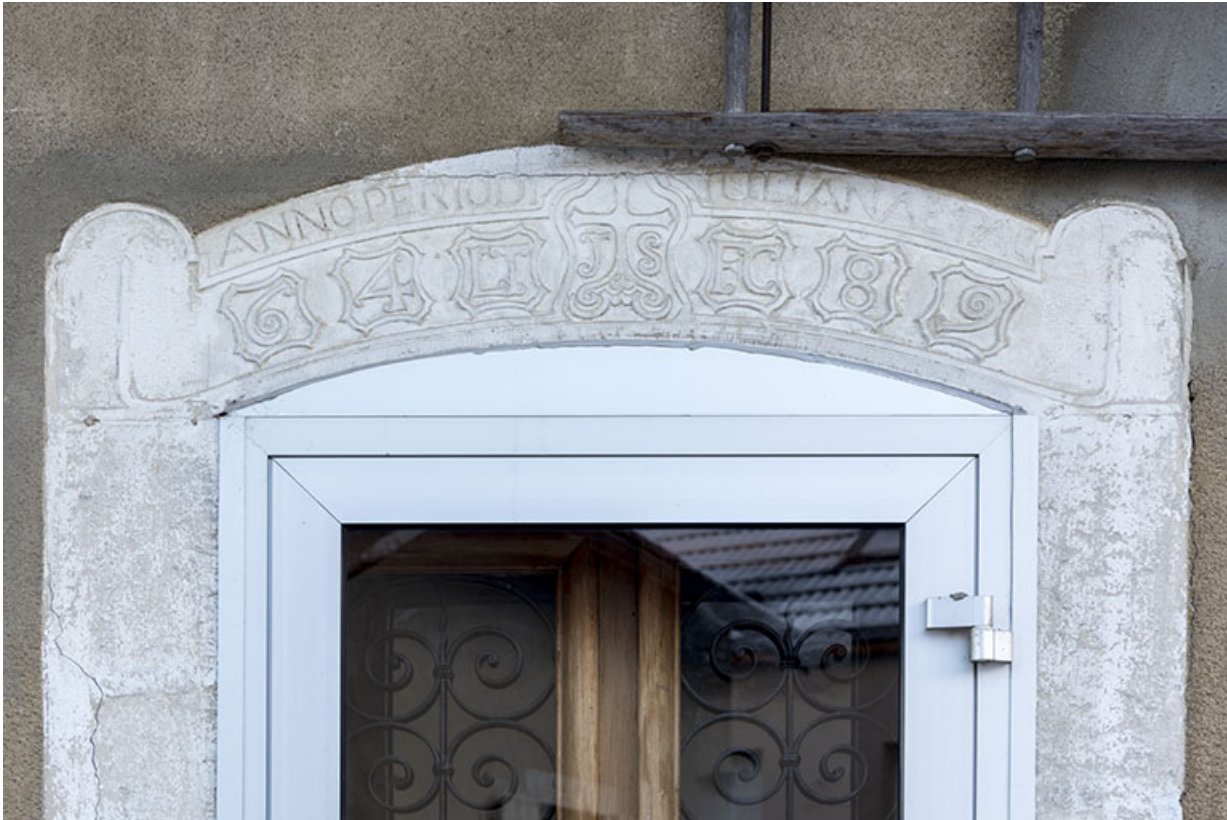
Façade antérieure : linteau avec inscription et datation.

25, Villers-le-Lac, 21 rue du Temple, lieudit : les Bassots