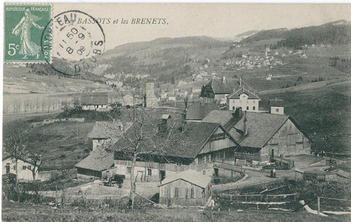
Les Bassots et les Brenets, 4e quart 19e siècle ou 1er quart 20e siècle [avant 1909].