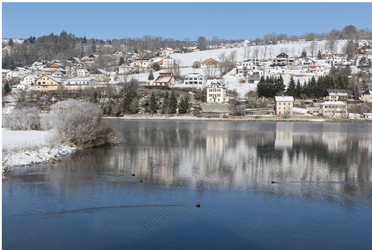
Vue d'ensemble, depuis le sud, en hiver.