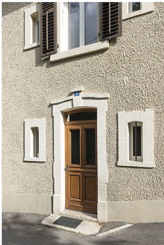
Façade antérieure : entrée.

25, Villers-le-Lac, 7 route du Port, lieudit : Chaillexon