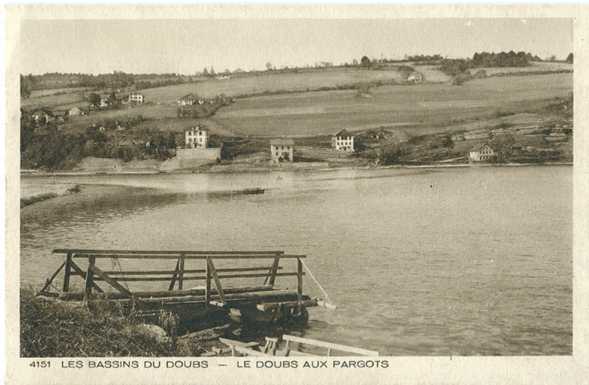
4151 Les bassins du Doubs - Le Doubs aux Pargots, 1ère moitié 20e siècle. 25, Villers-le-Lac

4151 Les bassins du Doubs - Le Doubs aux Pargots, carte postale, s.n., s.d. [1ère moitié 20e siècle], Braun et Cie impr.-éd. à Mulhouse-Dornach.