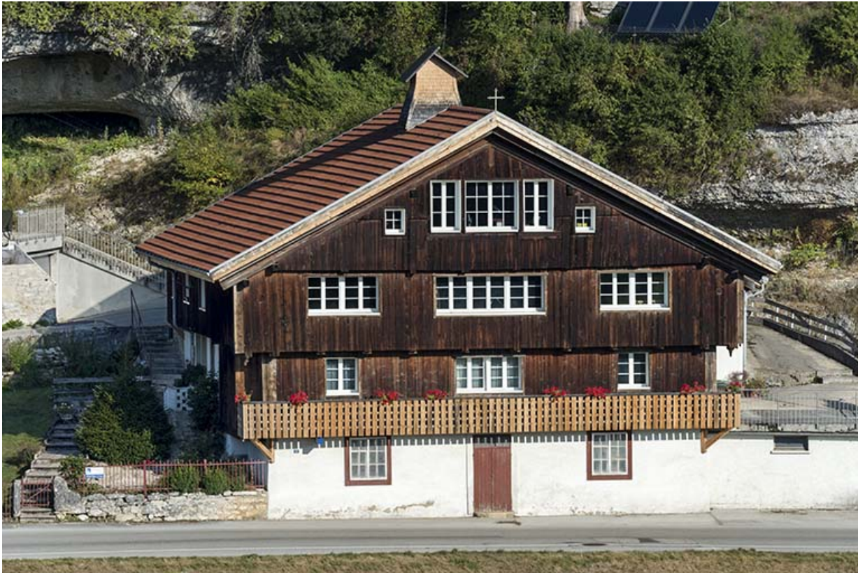
Façade antérieure, vue en plongée.