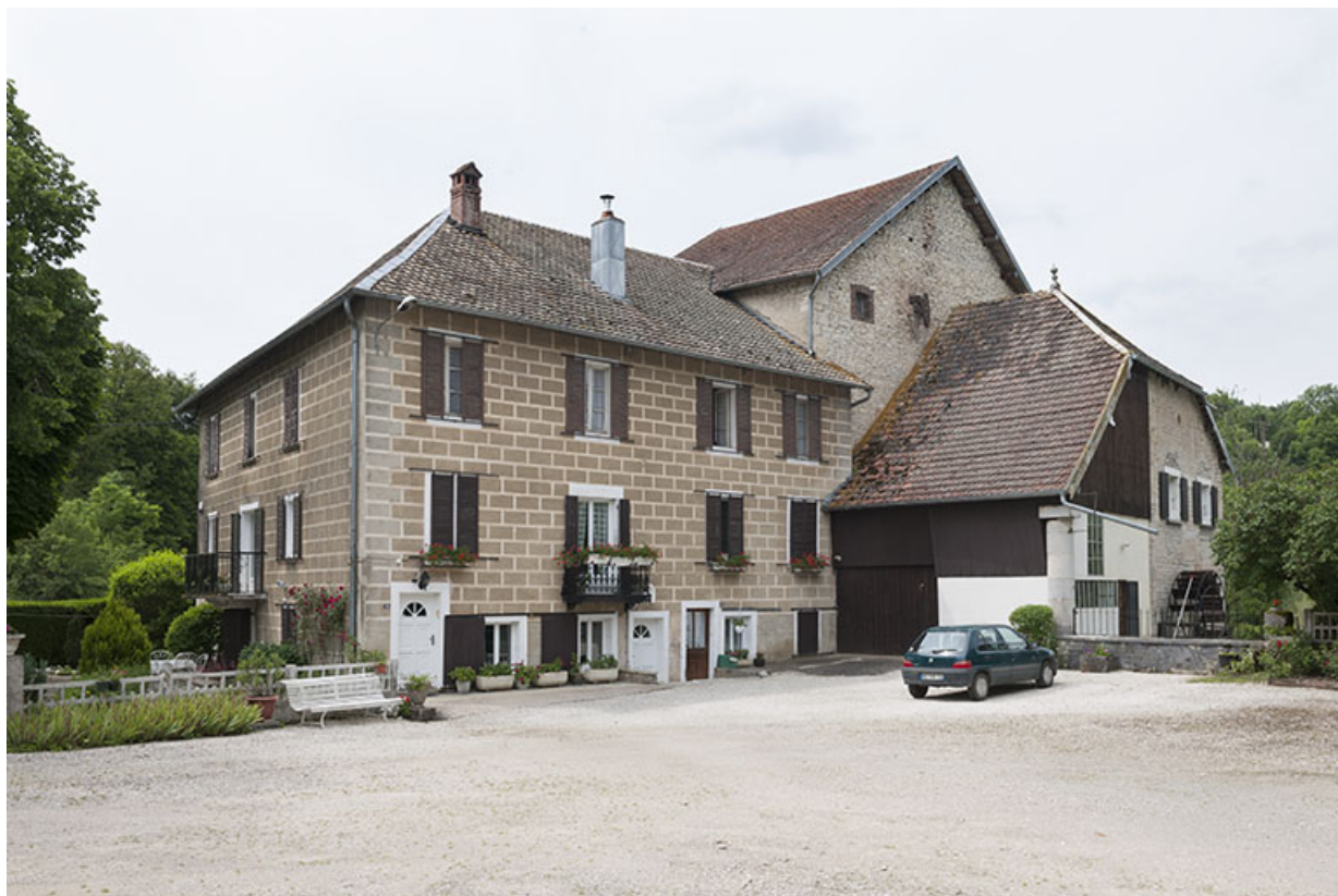
Logement et moulin depuis la cour.