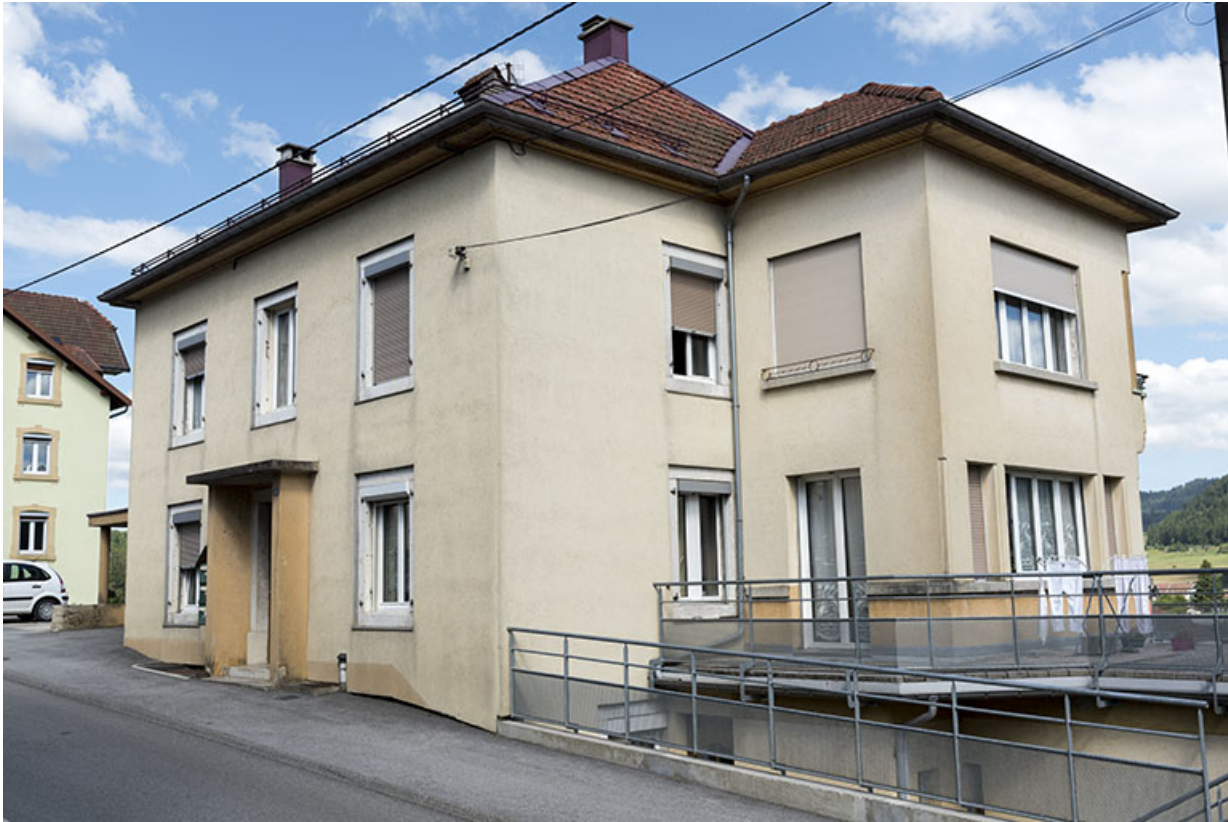
Façades antérieure et latérale droite.

25, Villers-le-Lac, 18 rue du Quartier neuf