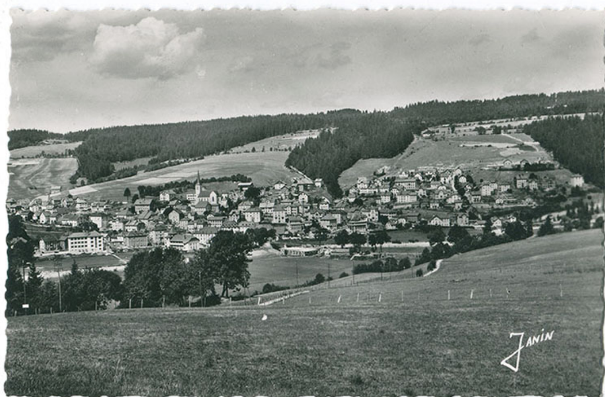
Frontière franco-suisse. 105 - Vue générale de Villers-le-Lac [depuis le sud], entre 1948 et 1952. Le bâtiment rehaussé est visible au centre droit de l'image.