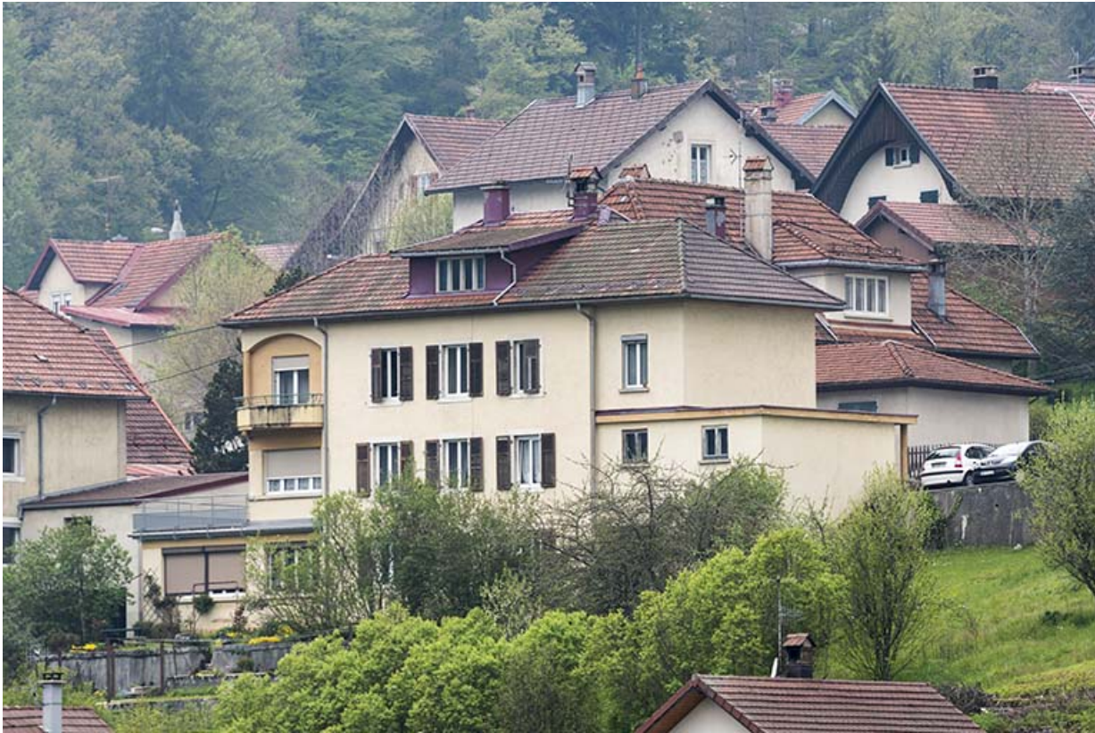
Façade postérieure, de trois quarts droite.

25, Villers-le-Lac, 18 rue du Quartier neuf