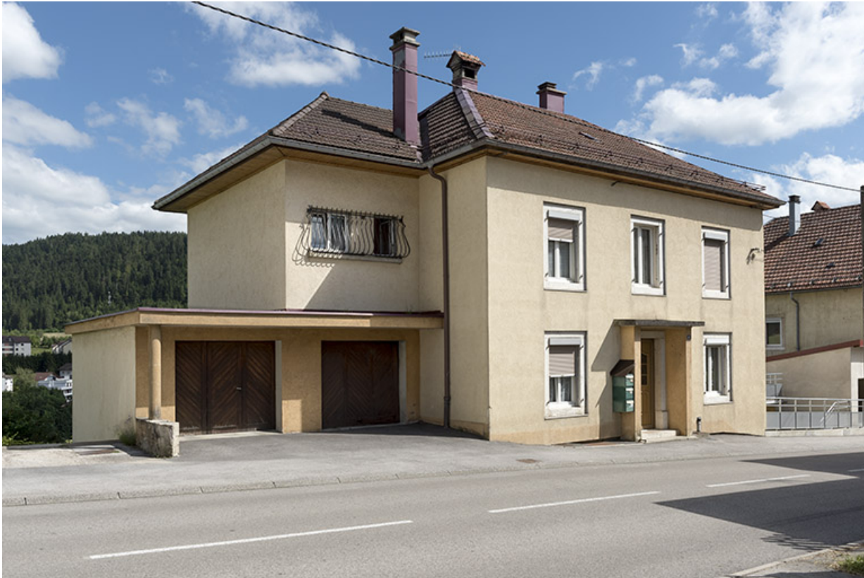
Façades antérieure et latérale gauche.

25, Villers-le-Lac, 18 rue du Quartier neuf