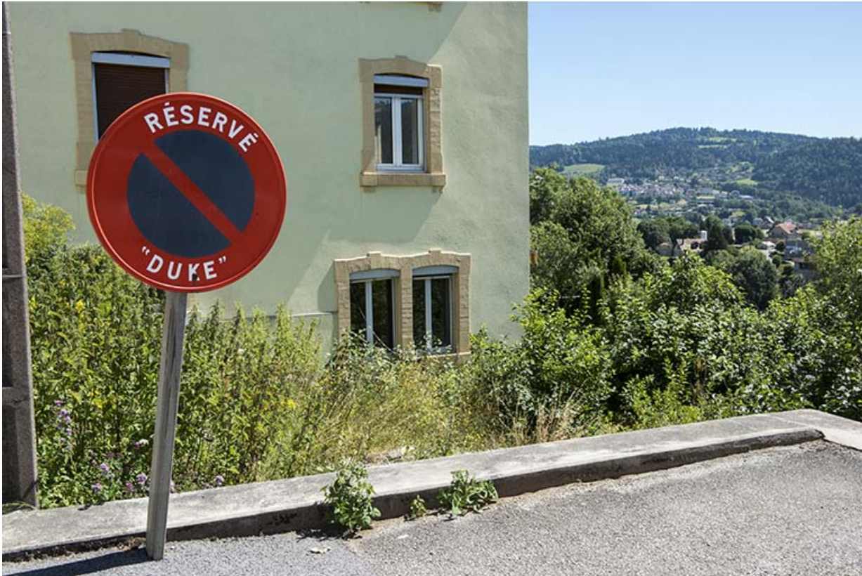
Panneau de la "Duke".

25, Villers-le-Lac, 18 rue du Quartier neuf