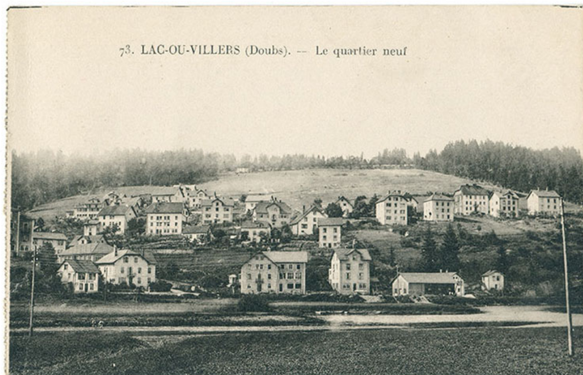
73. Lac-ou-Villers (Doubs). - Le quartier neuf [vu de l'est], 2e quart 20e siècle [vers 1925-1927]. Seul existe le premier bâtiment (au centre à gauche). 25, Villers-le-Lac

73. Lac-ou-Villers (Doubs). - Le quartier neuf [vu de l'est], carte postale, s.n., s.d. [2e quart 20e siècle, vers 1925-1927]