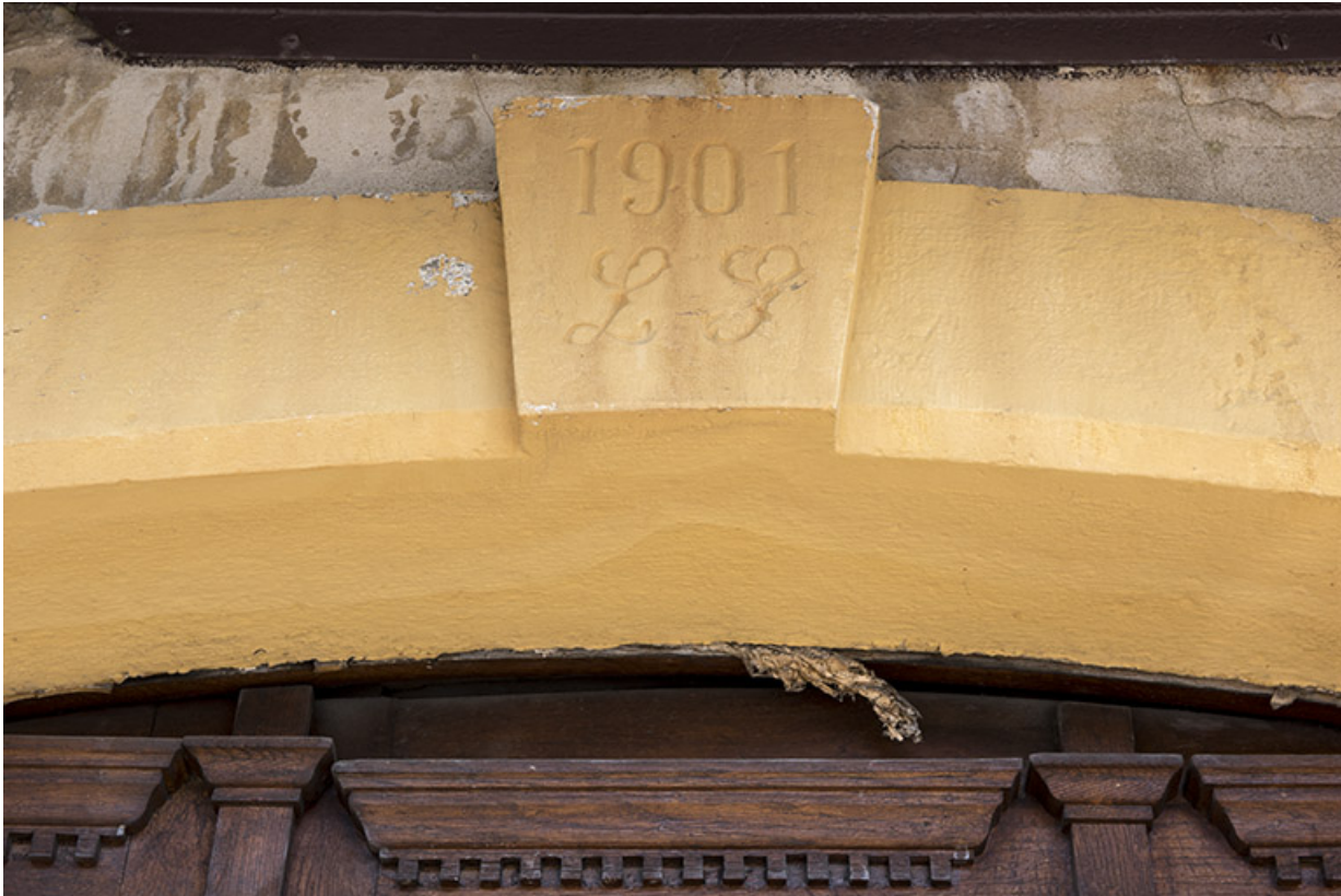
Façade antérieure : date et initiales sur le linteau de la porte.

25, Villers-le-Lac, 15 rue du Quartier neuf