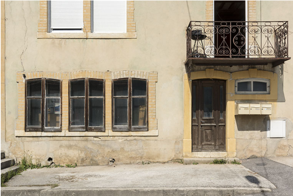
Façade antérieure : fenêtres multiples à l'étage de soubassement.

25, Villers-le-Lac, 15 rue du Quartier neuf