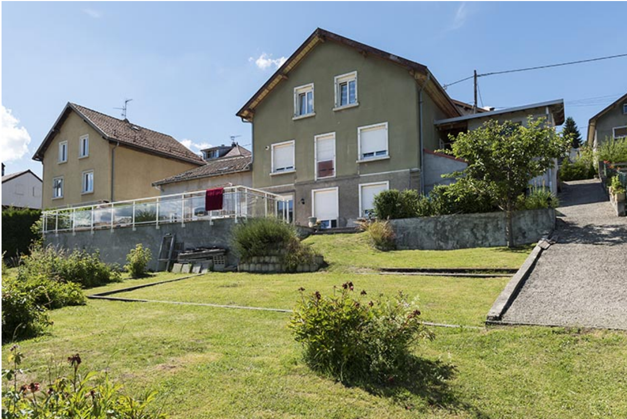
Façade postérieure, de trois quarts gauche.