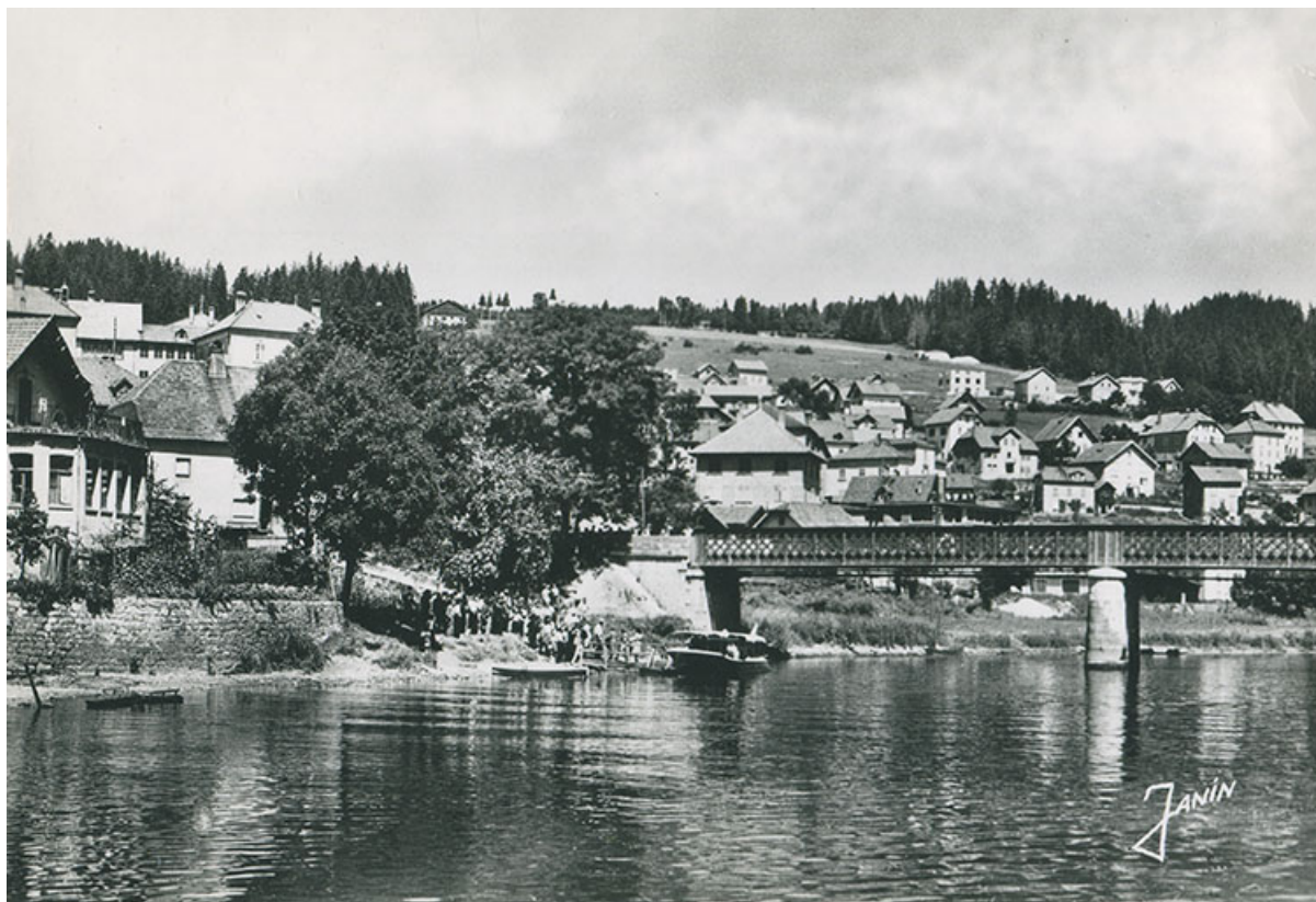
118 - Frontière franco-suisse. Villers-le-Lac. Le pont et l'embarcadere de l'hôtel de France, entre 1938 et 1951. 25, Villers-le-Lac, 10 rue de Curcol

118 - Frontière franco-suisse. Villers-le-Lac. Le pont et l'embarcadere de l'hôtel de France, carte postale, par Janin, s.d. [entre 1938 et 1951], Editions Photo Janin à Maîche