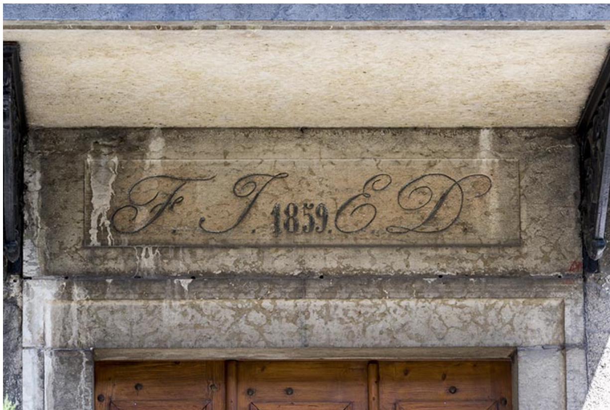
Façade antérieure : date et initiales sur le linteau de la porte.