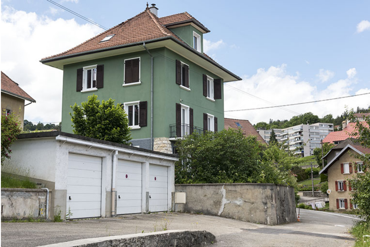
Façades antérieure et latérale gauche.