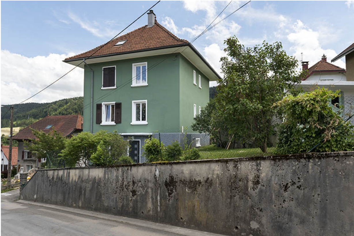
Façade latérale droite, de trois quarts.