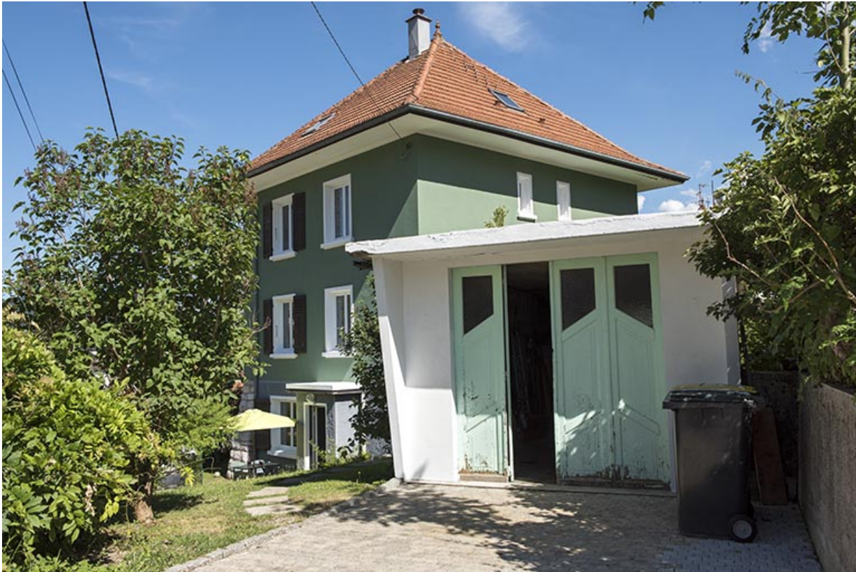
Garage et façade latérale droite.