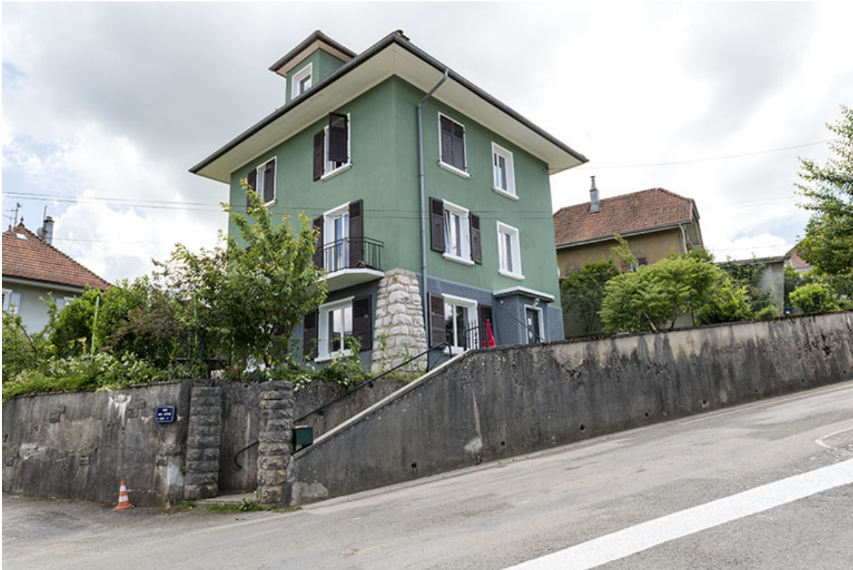
Façades antérieure et latérale droite.