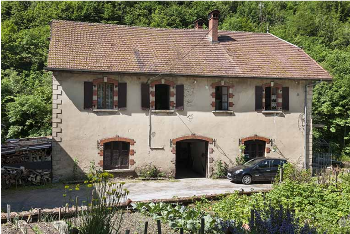
Atelier ouest (magasin et atelier de finissage)

25, Mouthier-Haute-Pierre, 6 à 10 chemin des Moulins