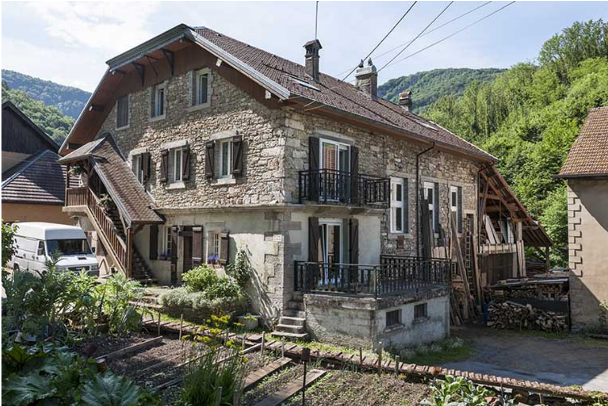
Atelier vu de trois quarts gauche.

25, Mouthier-Haute-Pierre, 6 à 10 chemin des Moulins