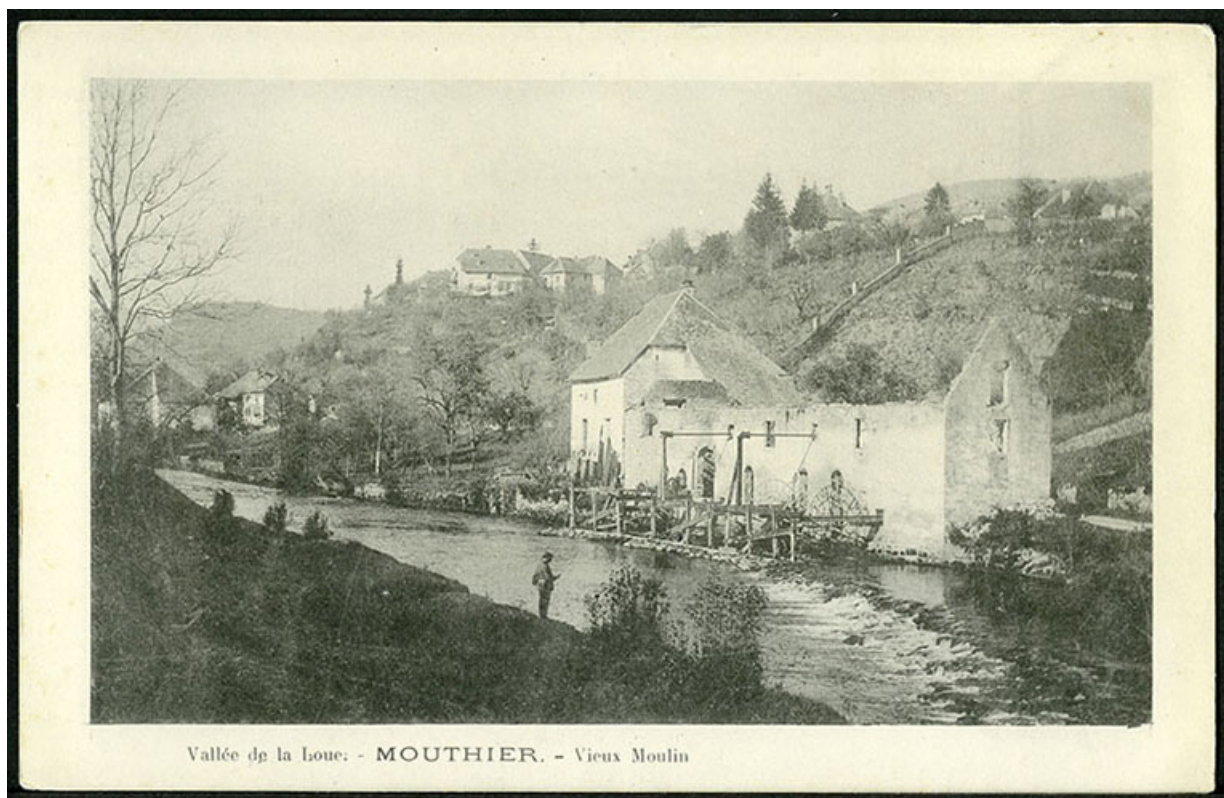
Vallée de la Loue - Mouthier- Vieux moulin, carte postale, s.d. [fin 19e ou début 20e siècle]. 25, Mouthier-Haute-Pierre, 6 à 10 chemin des Moulins