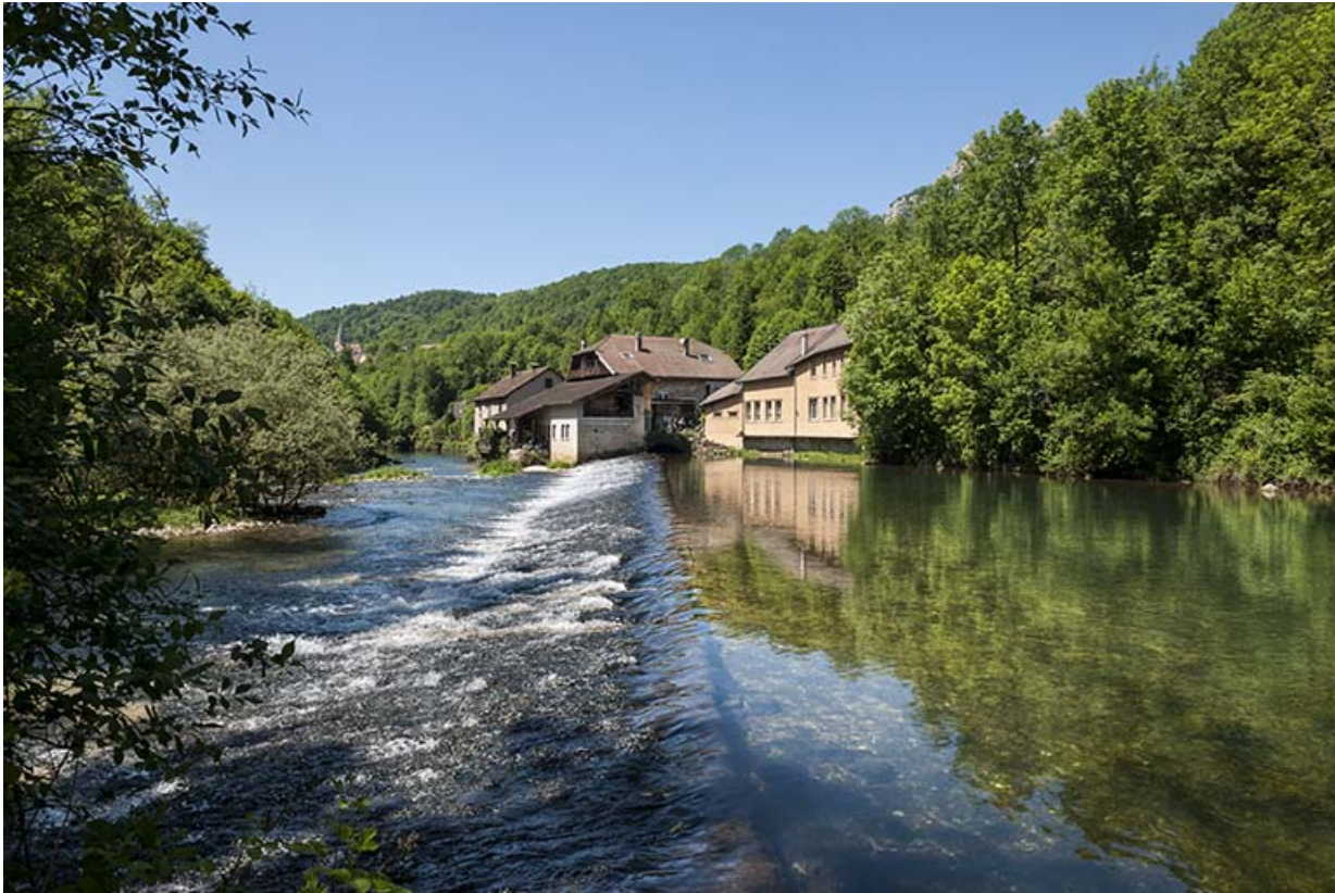
Vue d'ensemble depuis le barrage, en amont.