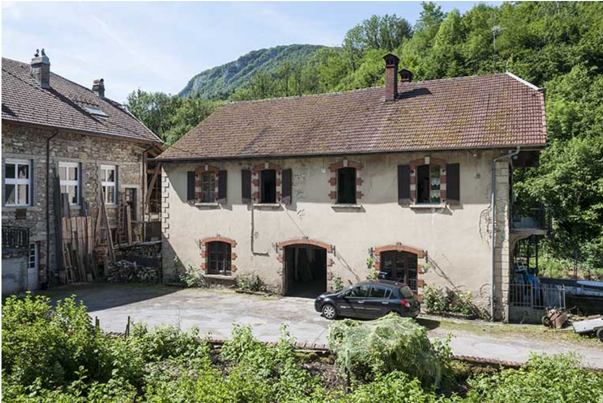
Vue depuis le nord.

25, Mouthier-Haute-Pierre, 6 à 10 chemin des Moulins