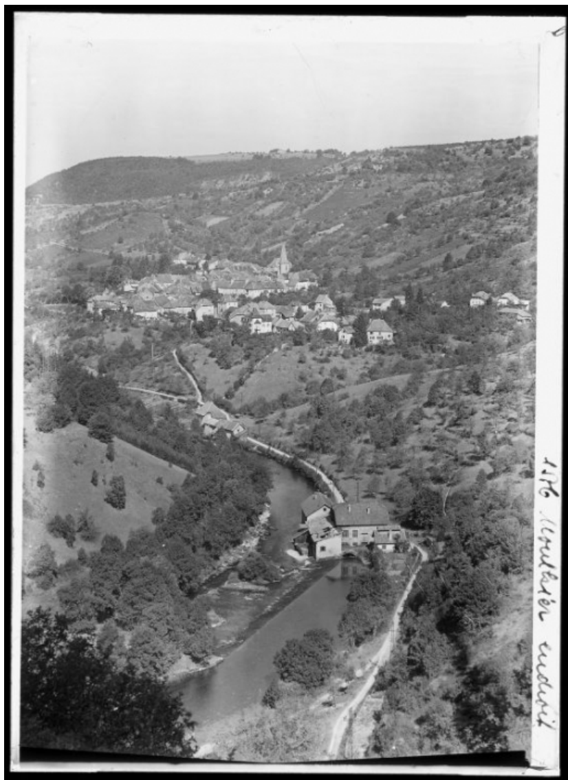
[Vue plongeante depuis l'est], s.d. [vers 1930].

25, Mouthier-Haute-Pierre, 6 à 10 chemin des Moulins