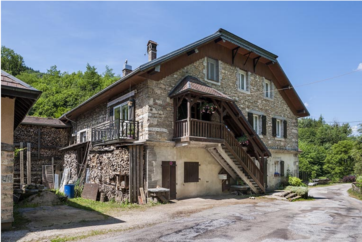
Atelier de fabrication vu de trois quarts arrière.

25, Mouthier-Haute-Pierre, 6 à 10 chemin des Moulins