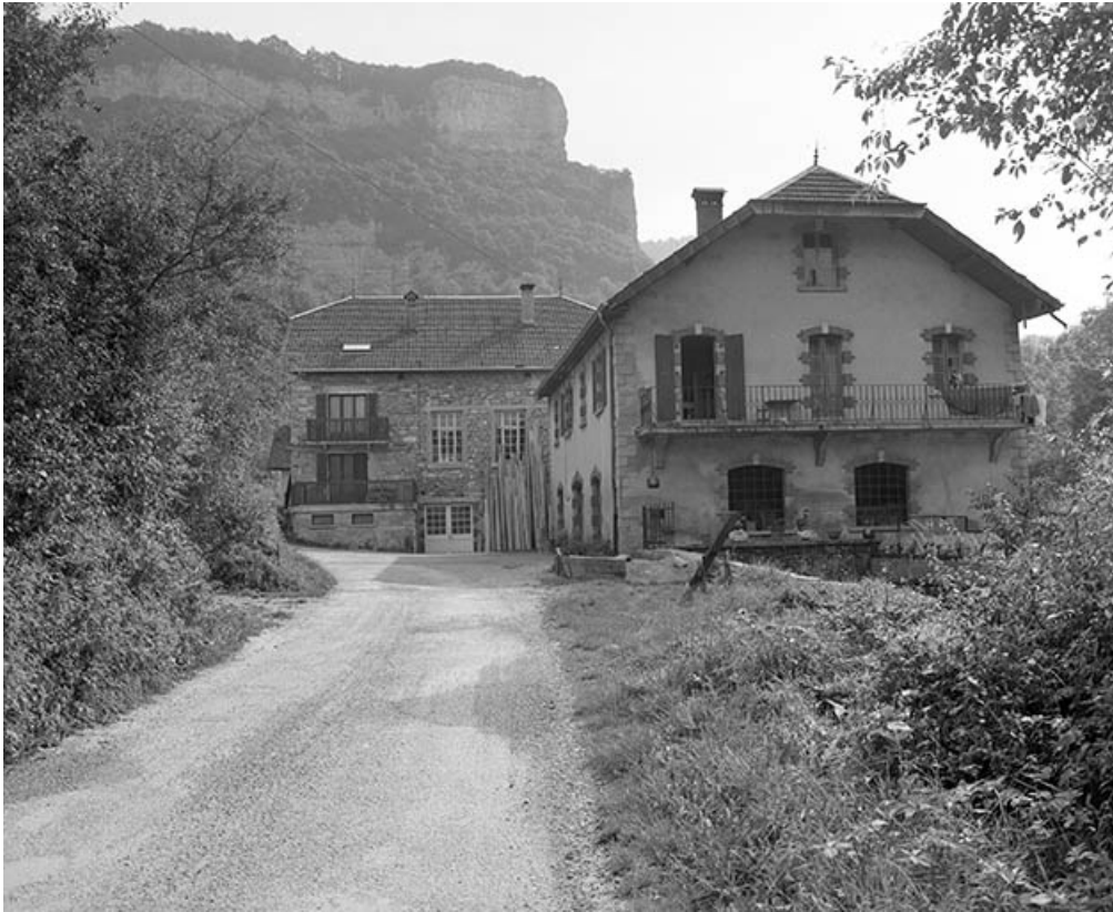
Vue rapprochée depuis l'ouest..

25, Mouthier-Haute-Pierre, 6 à 10 chemin des Moulins