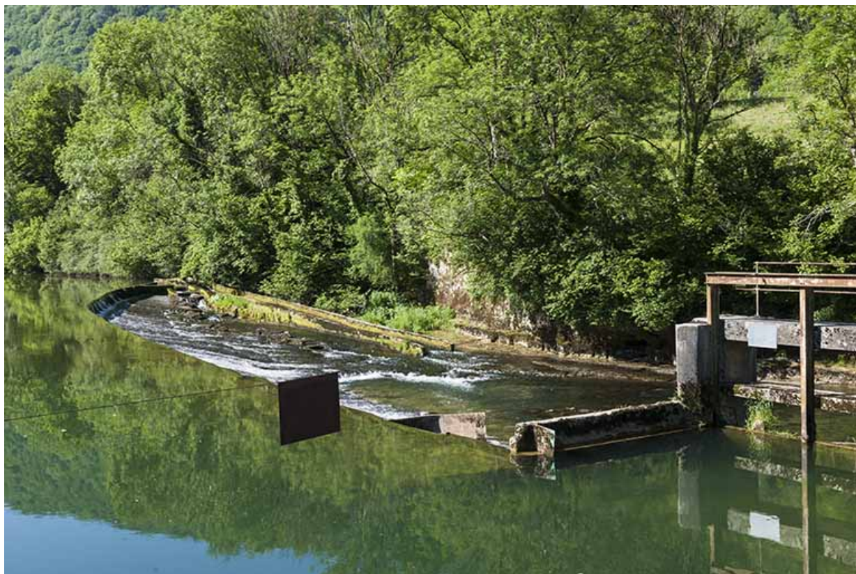
Le barrage depuis la rive droite.