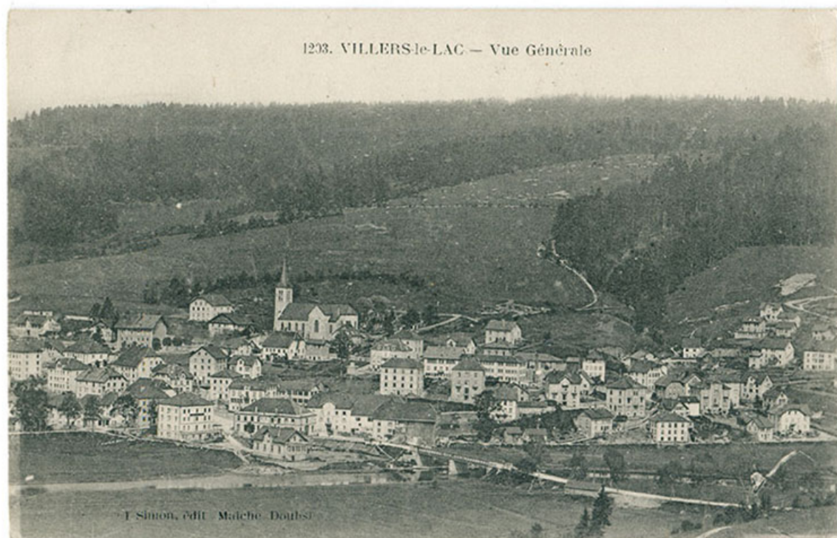
1203. Villers-le-Lac - Vue générale [le village, vu du sud-est], 1er quart 20e siècle [guerre 1914-1918 ?, avant 1921]. Seul existe le premier bâtiment (à droite).

25, Villers-le-Lac, 3 et 5 rue de l' Horlogerie