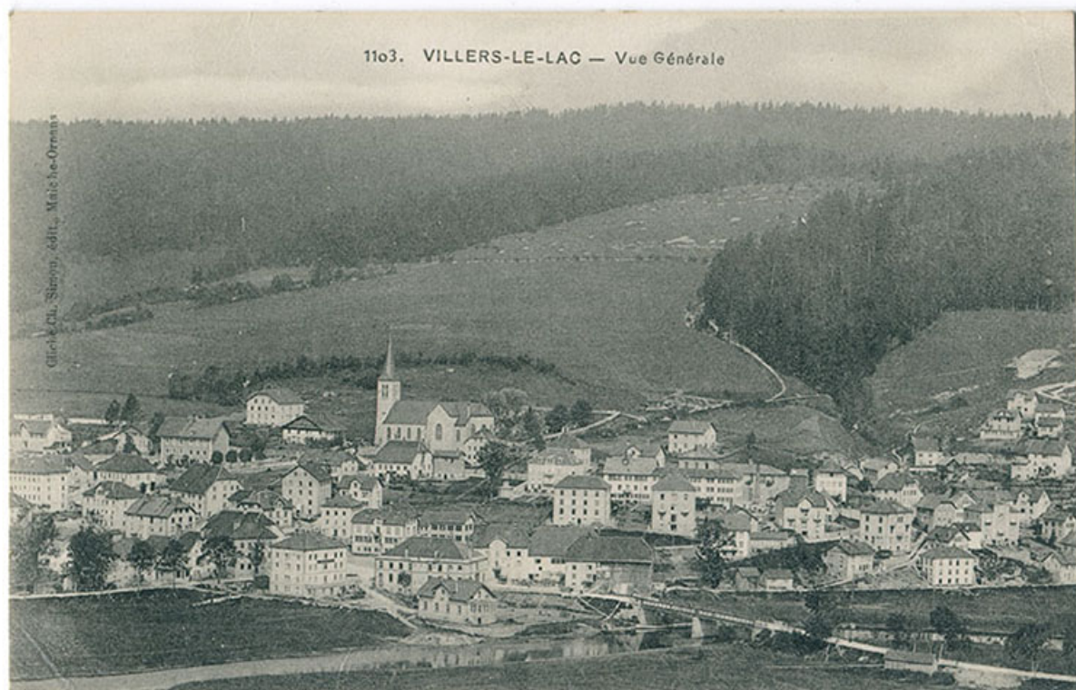
1103. Villers-le-Lac - Vue générale [le village, vu du sud-est], 1er quart 20e siècle [guerre 1914-1918 ?]. La maison et l'atelier sont visibles à l'arrière-plan à droite.

25, Villers-le-Lac, 3 et 5 rue de l' Horlogerie