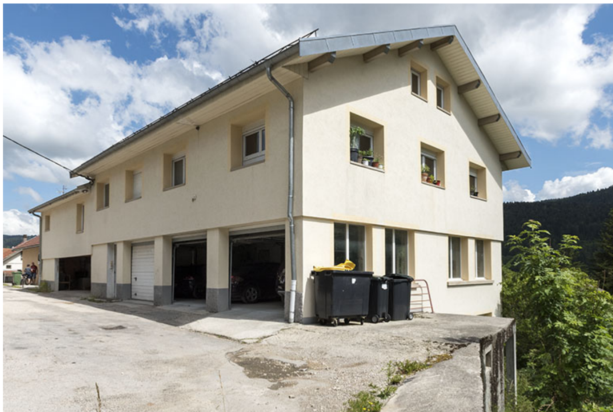
Façades sur la rue de l'Horlogerie, depuis l'ouest.

25, Villers-le-Lac, 3 et 5 rue de l' Horlogerie