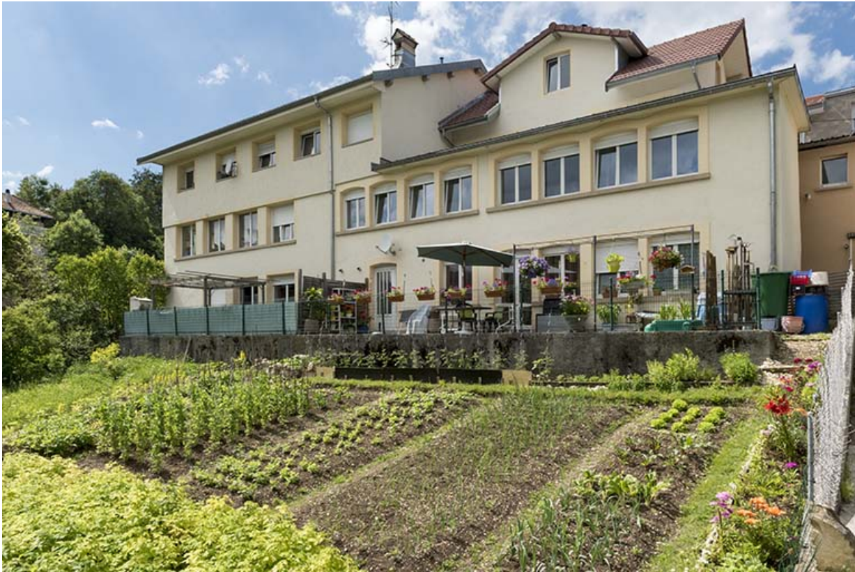
Façade postérieure, de trois quarts droite.

25, Villers-le-Lac, 3 et 5 rue de l' Horlogerie