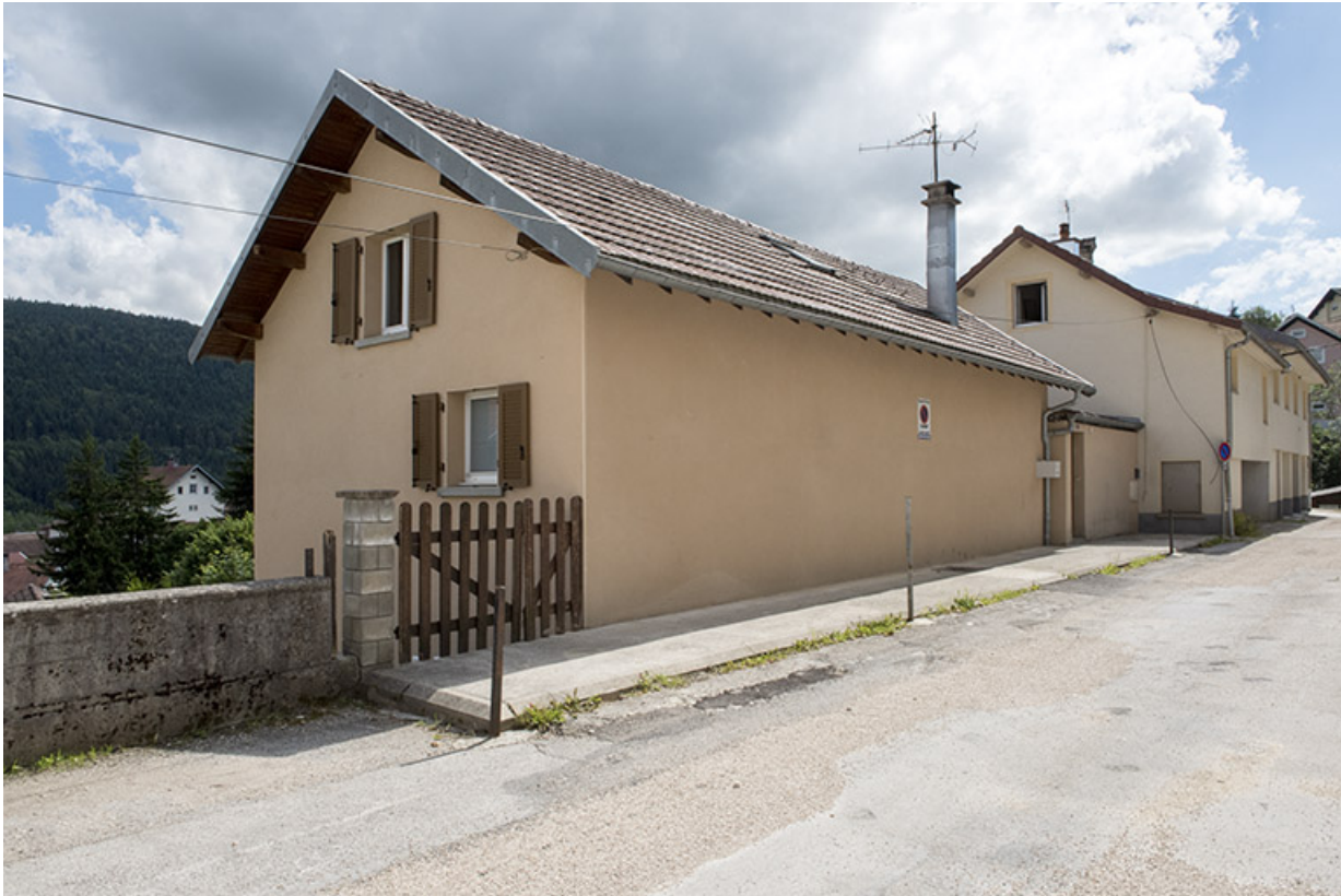
Façades sur la rue de l'Horlogerie, depuis le nord-est (maison Sire au premier plan, Jaccard à l'arrière-plan). 25, Villers-le-Lac, 3 et 5 rue de l' Horlogerie