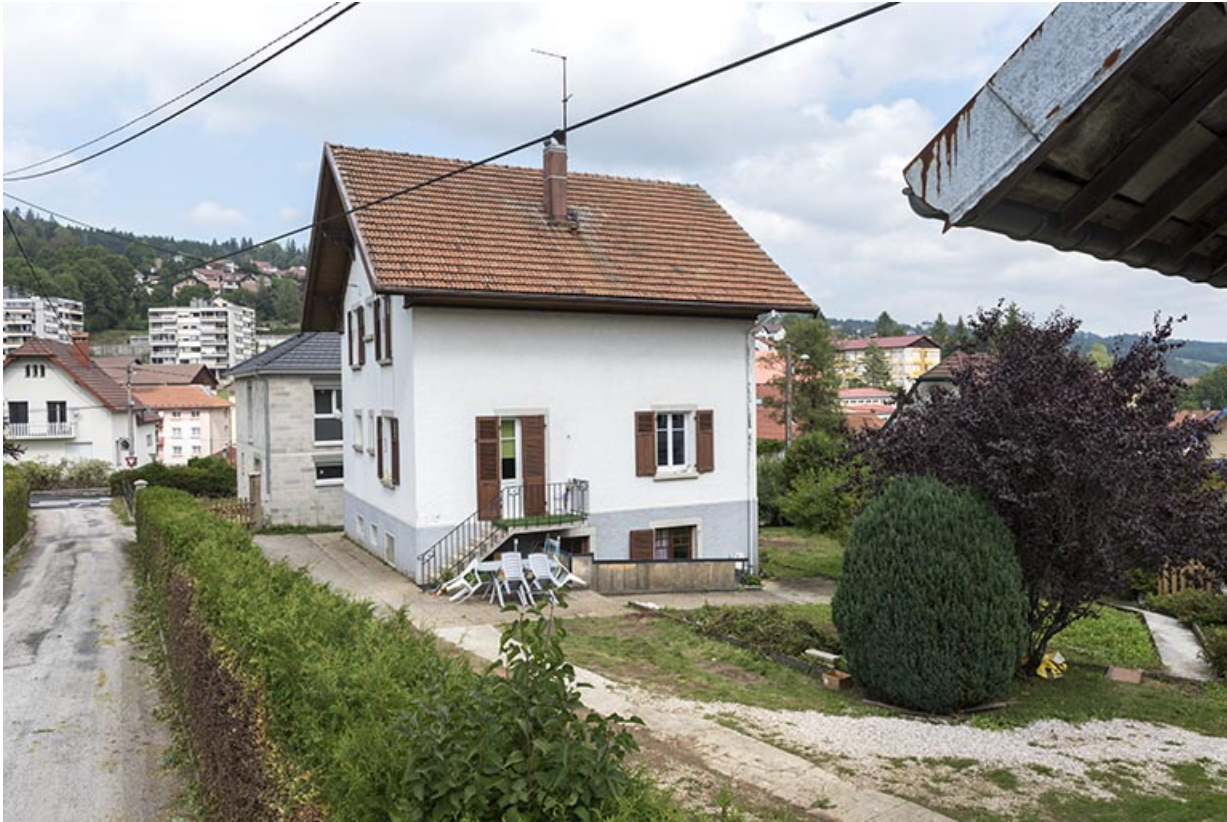
Maison : façades antérieure et latérale droite.