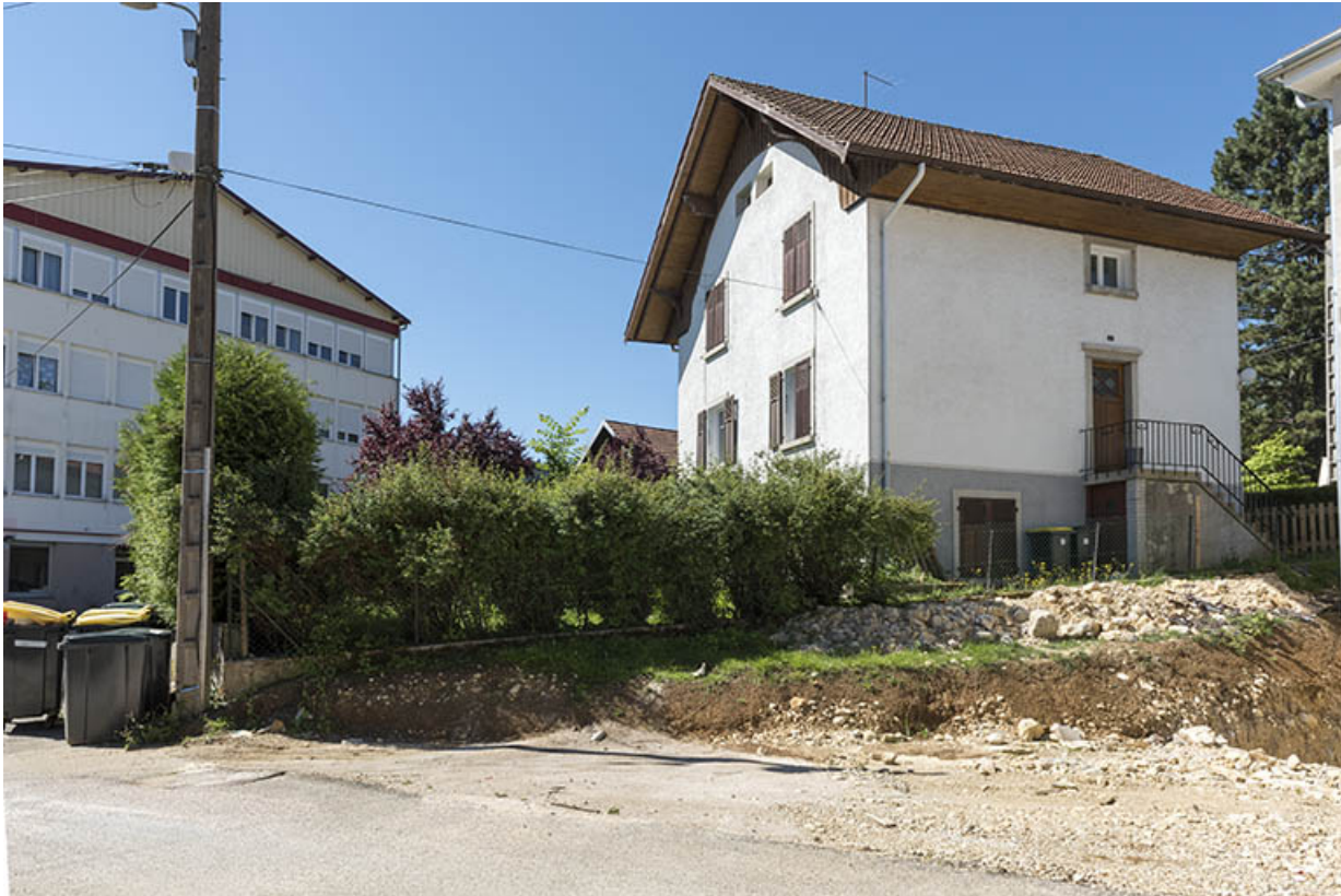
Vue d'ensemble, depuis le nord : usine à gauche, maison à droite.