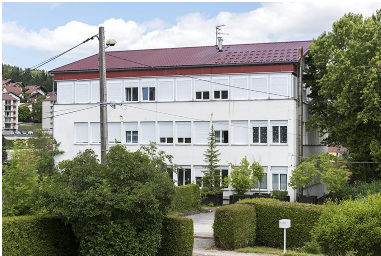
Usine : façade latérale droite, de trois quarts droite.