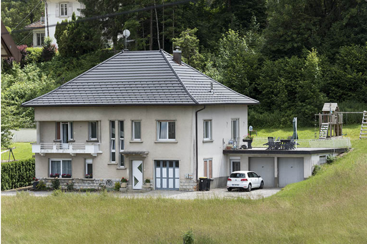
Vue d'ensemble, depuis le nord-ouest.

25, Villers-le-Lac, 4 et 6 bis rue de la Cotote