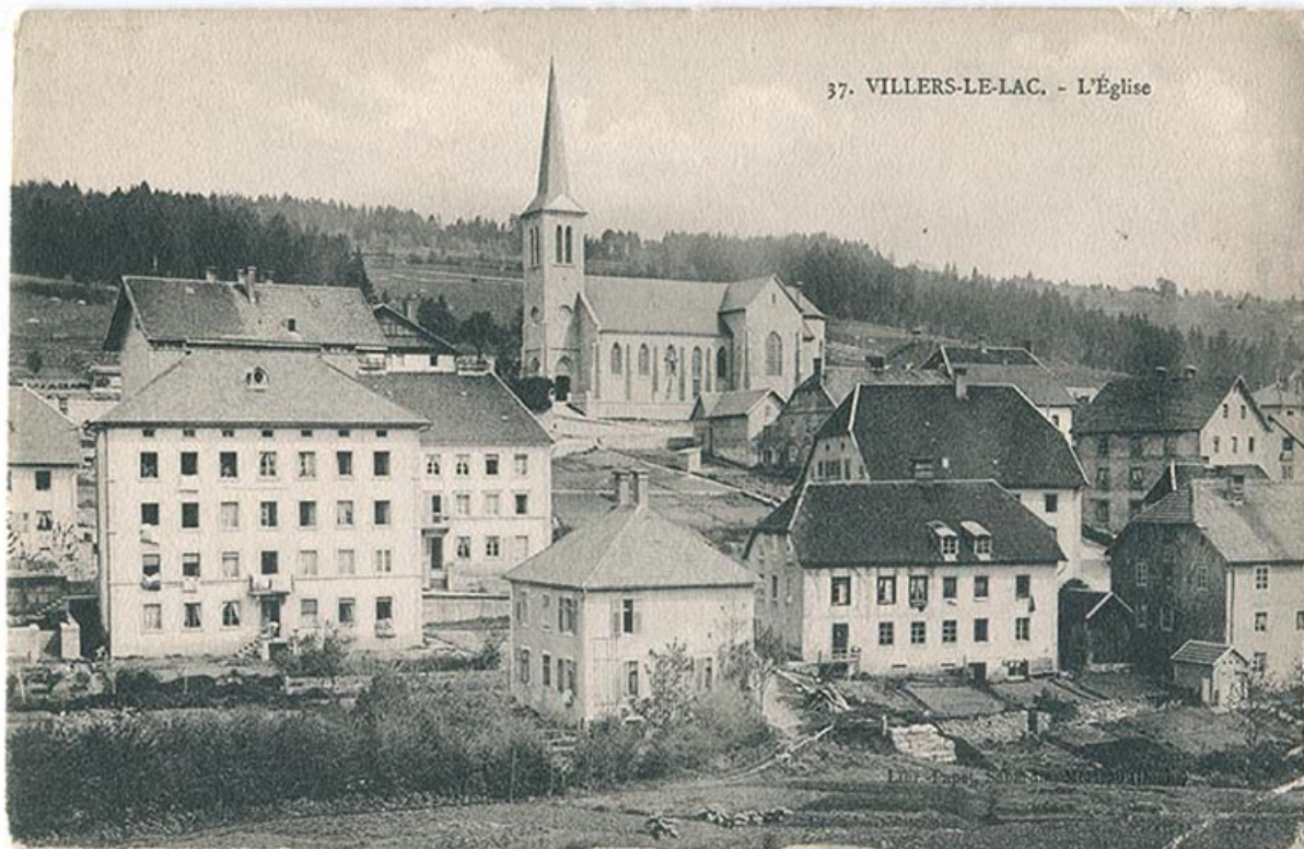
37. Villers-le-Lac. - L'Église [quartier de l'église, vu du sud], 1er quart 20e siècle [avant 1915]. Le bâtiment, au centre, est partiellement masqué par l'imposante demeure de gauche.