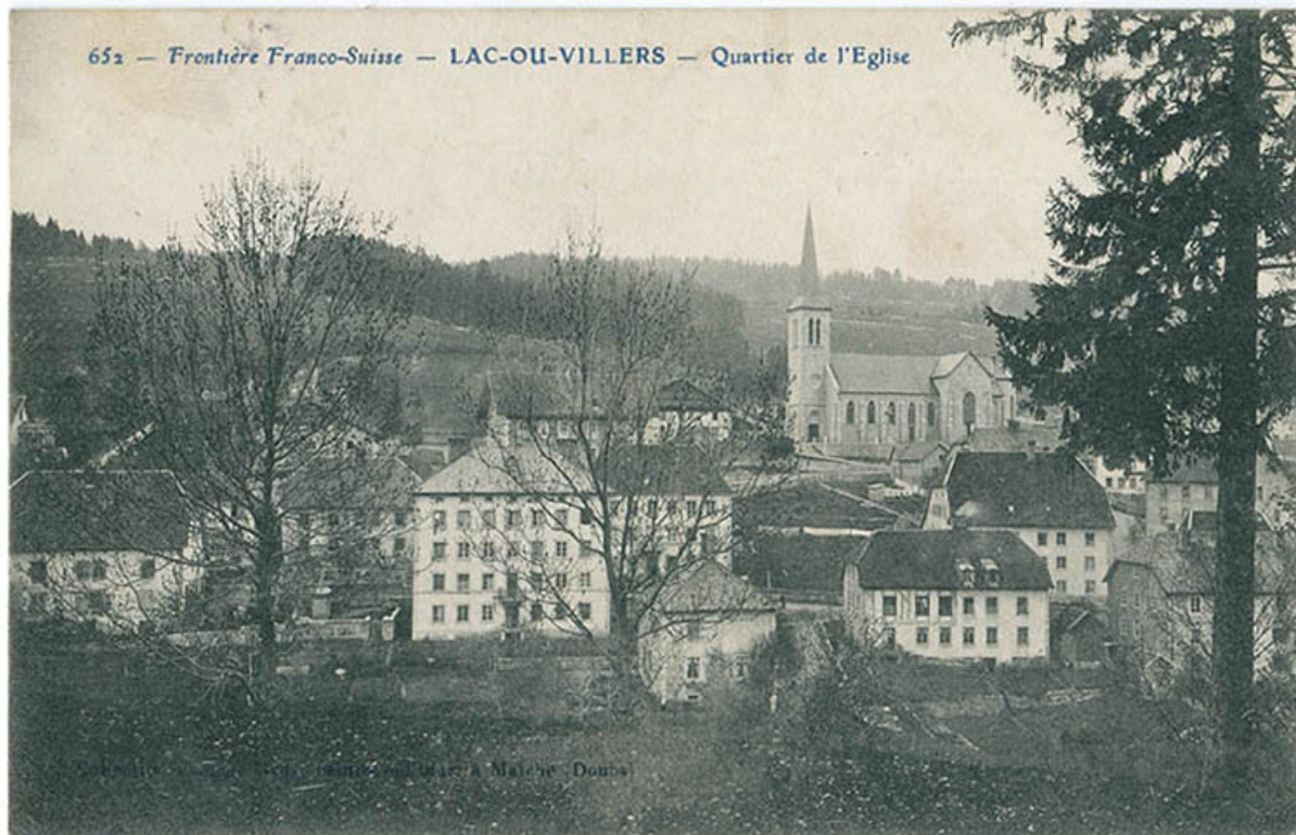
652 - Frontière franco-suisse - Lac-ou-Villers - Quartier de l'Eglise [vu du sud], 1er quart 20e siècle [avant 1915]. 25, Villers-le-Lac, 2 rue de la Cotote