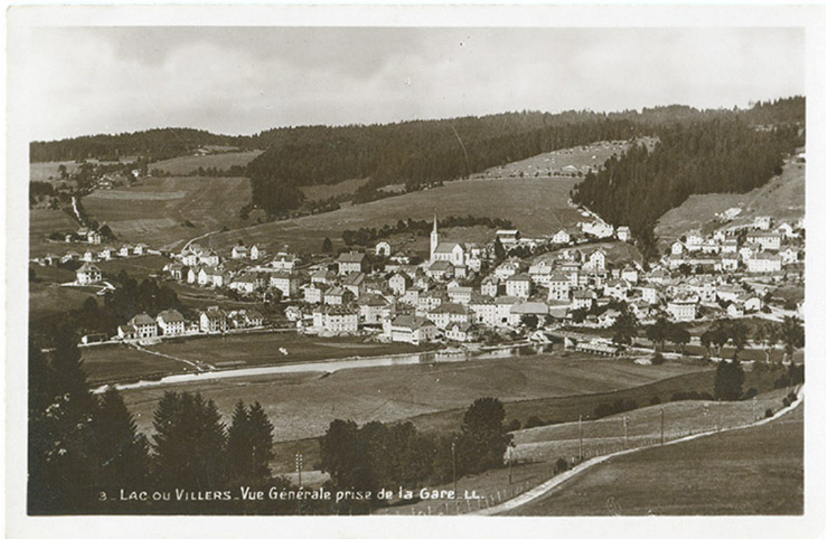
3 - Lac ou Villers - Vue générale prise de la gare, décennie 1930 [avant 1938]. Le bâtiment est visible au centre à droite. 25, Villers-le-Lac

3 - Lac ou Villers - Vue générale prise de la gare, carte postale, par Louis Lévy, [décennie 1930, avant 1938], Lévy et Neurdein réunis impr. à Paris. Porte la date 1938 (tampon) au verso. Cliché aussi exploité par la CAP pour : "Ed. H. Guillaume, Saut du Doubs - Villers-le-Lac (Doubs)".