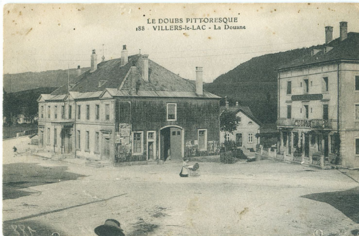
Le Doubs pittoresque. 188 - Villers-le-Lac - La Douane, 1ère moitié 20e siècle. 25, Villers-le-Lac, 1 rue Pierre Berçot