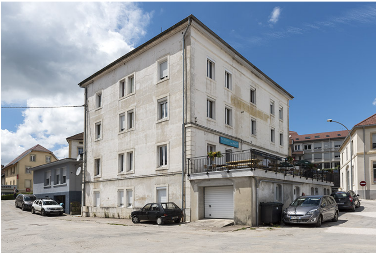
Immeuble : façades postérieure et latérale gauche.