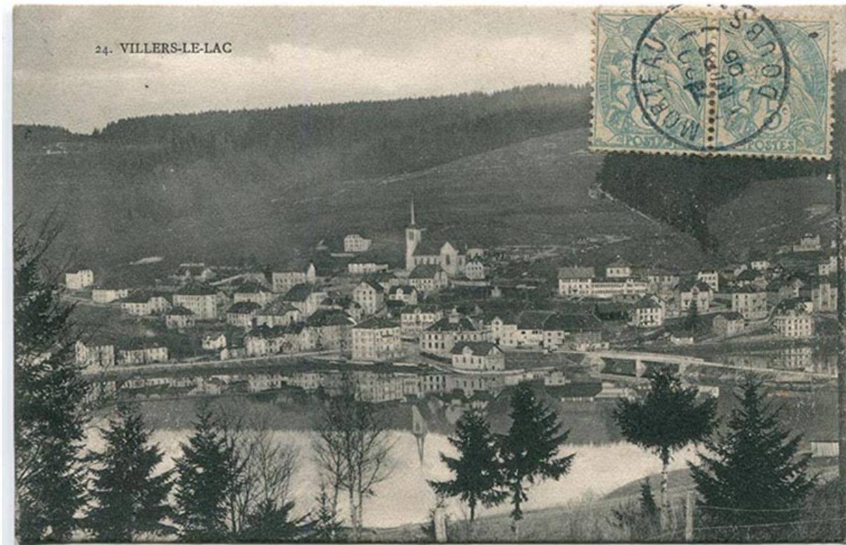
24. Villers-le-Lac [le village vu du sud-est], limite 19e siècle 20e siècle [entre 1893 et 1906]. La maison est bâtie mais pas l'atelier. 25, Villers-le-Lac, 6 rue du Maréchal Foch

24. Villers-le-Lac [le village vu du sud-est], carte postale, s.n., limite 19e siècle 20e siècle [entre 1897 et 1906], Librairie-papeterie Sabardin éd à Morteau. Porte la date 20 mars 1906 (cachet) au recto et au verso