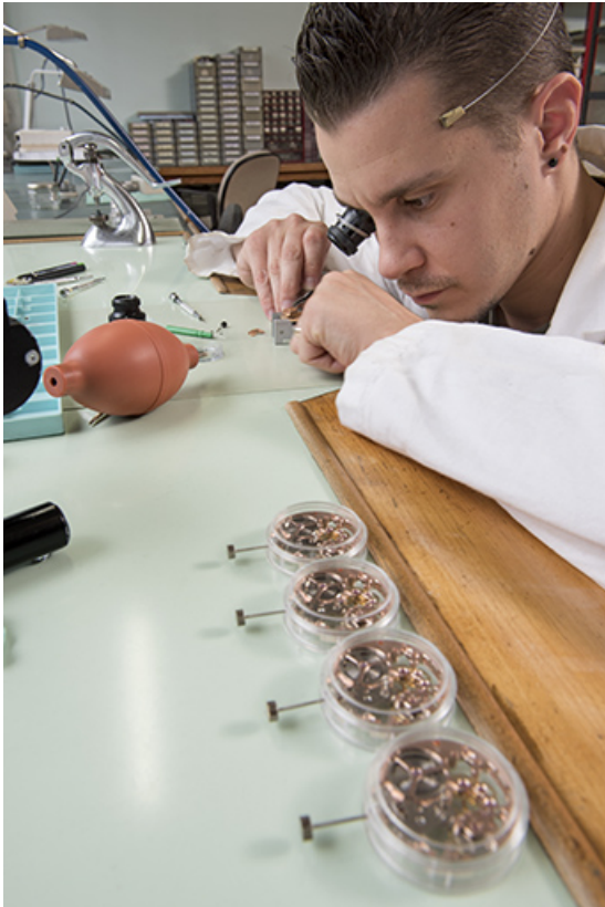
Horloger à l'établi : assemblage d'une montre.