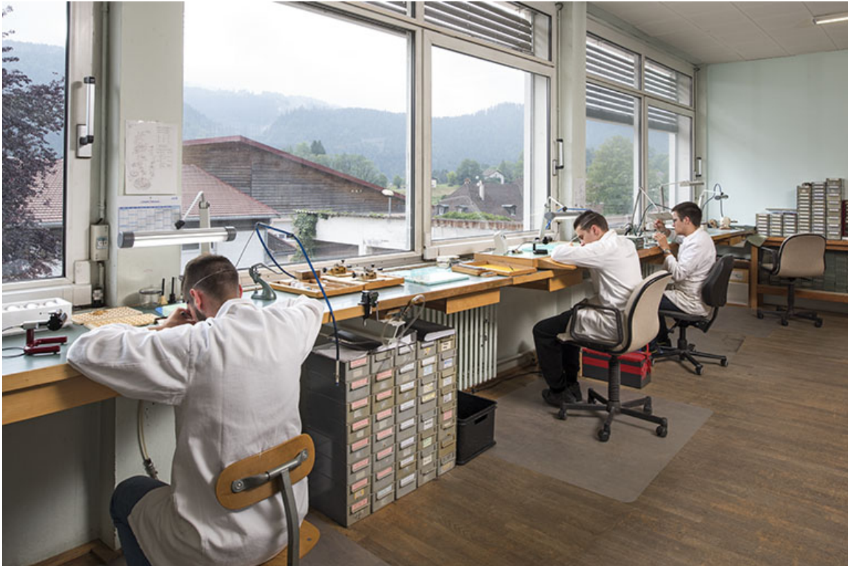
Atelier de fabrication, avec horlogers à l'établi.