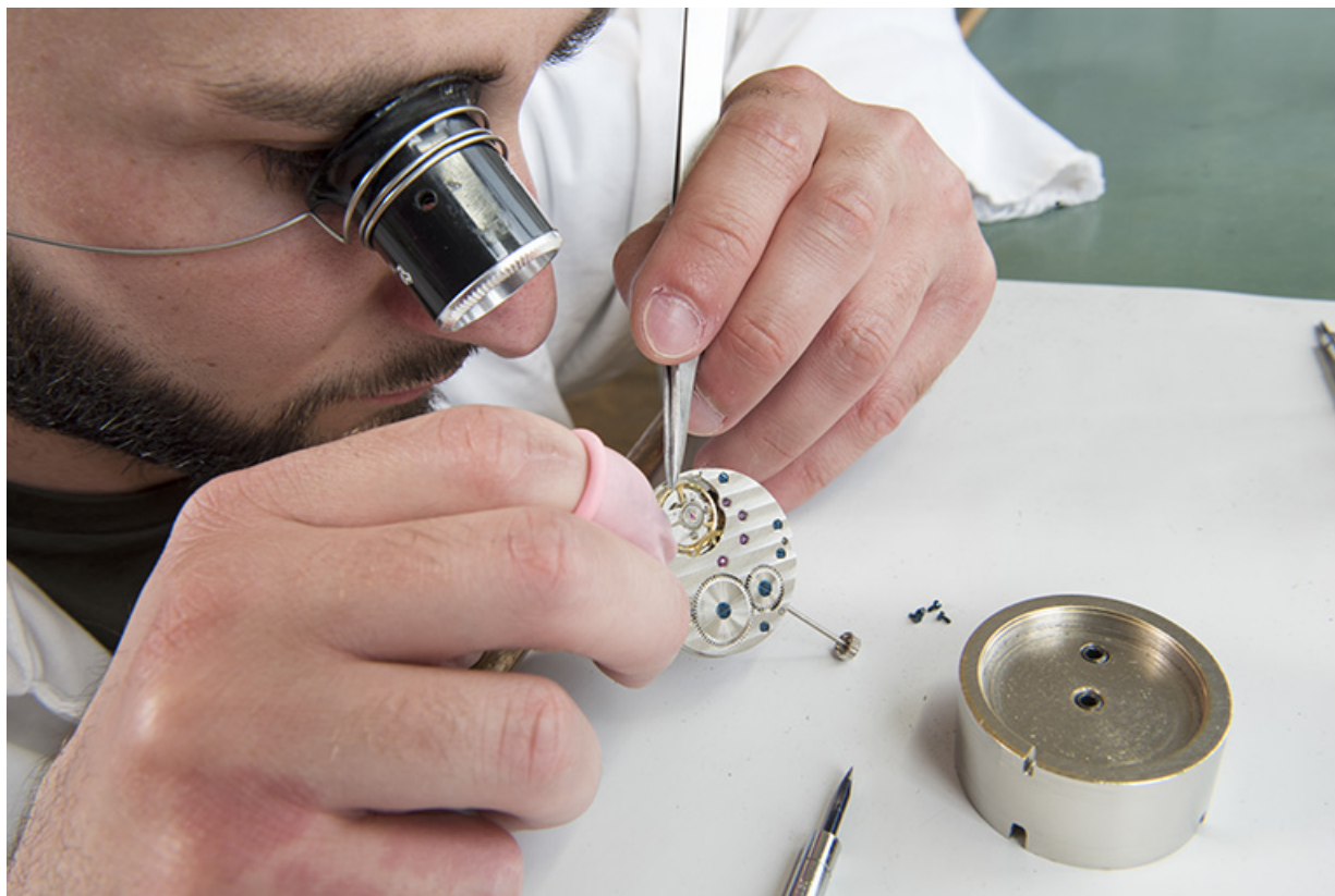
Horloger à l'établi : assemblage d'une montre.