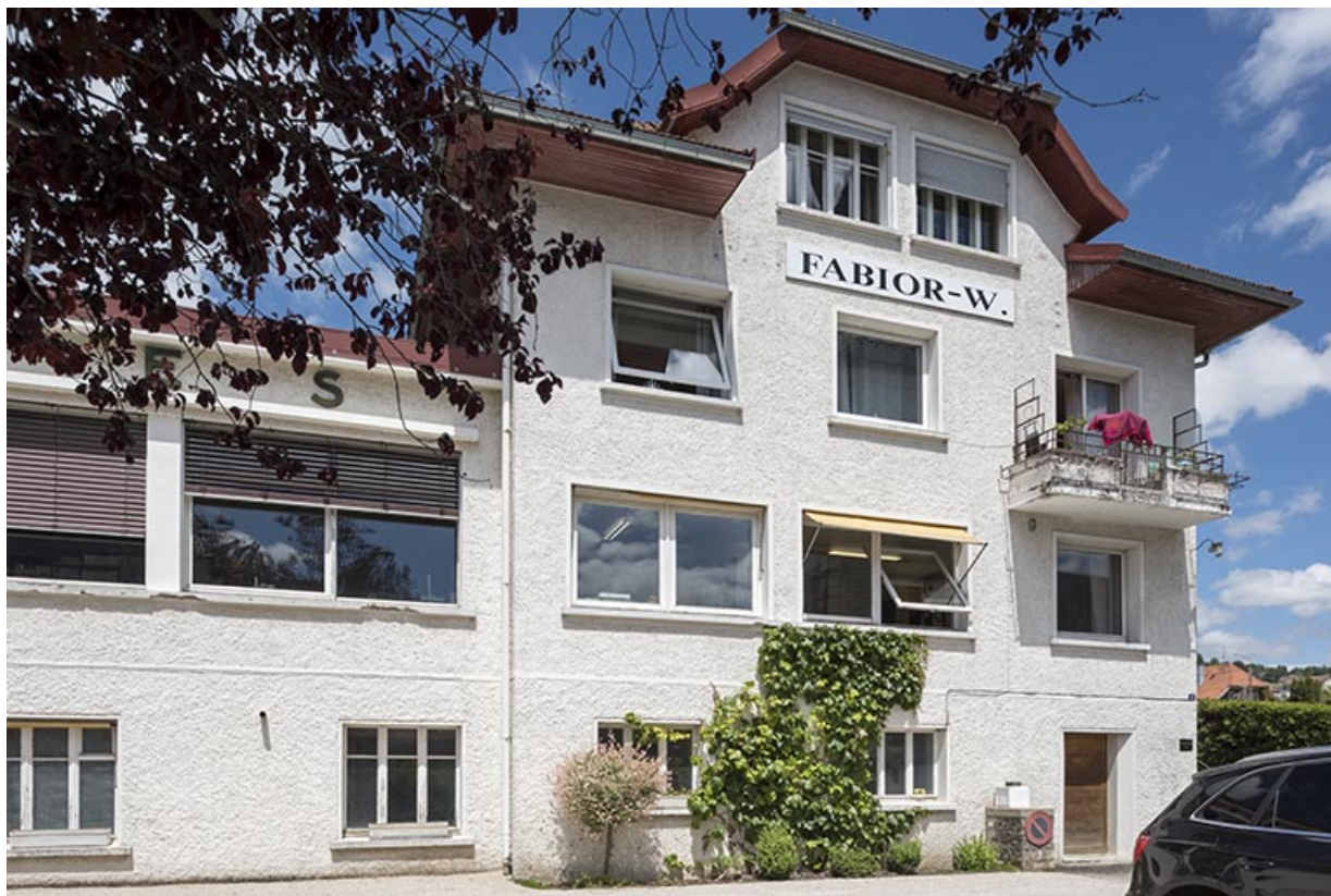
Façade antérieure de la maison.