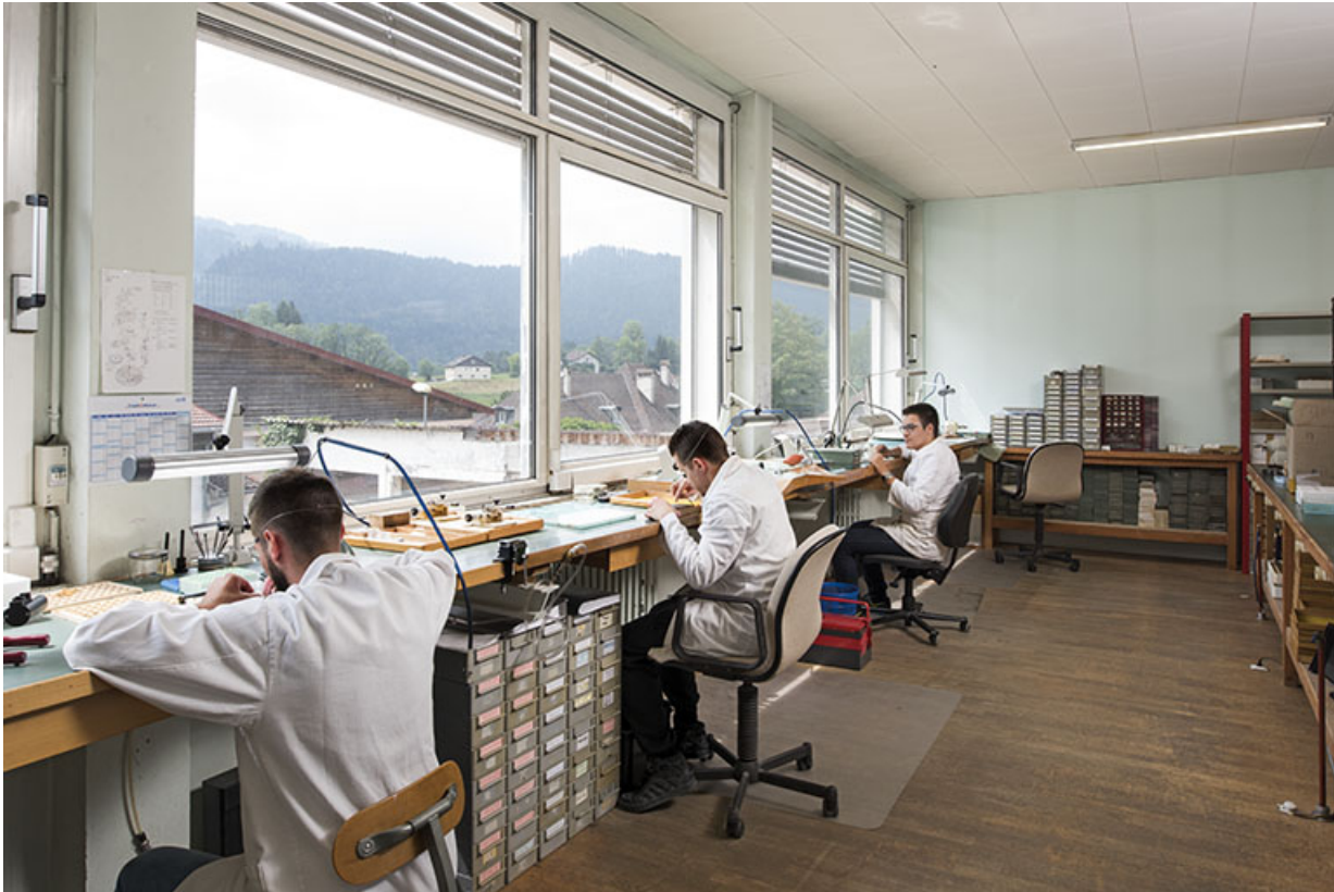
Atelier de fabrication, avec horlogers à l'établi.