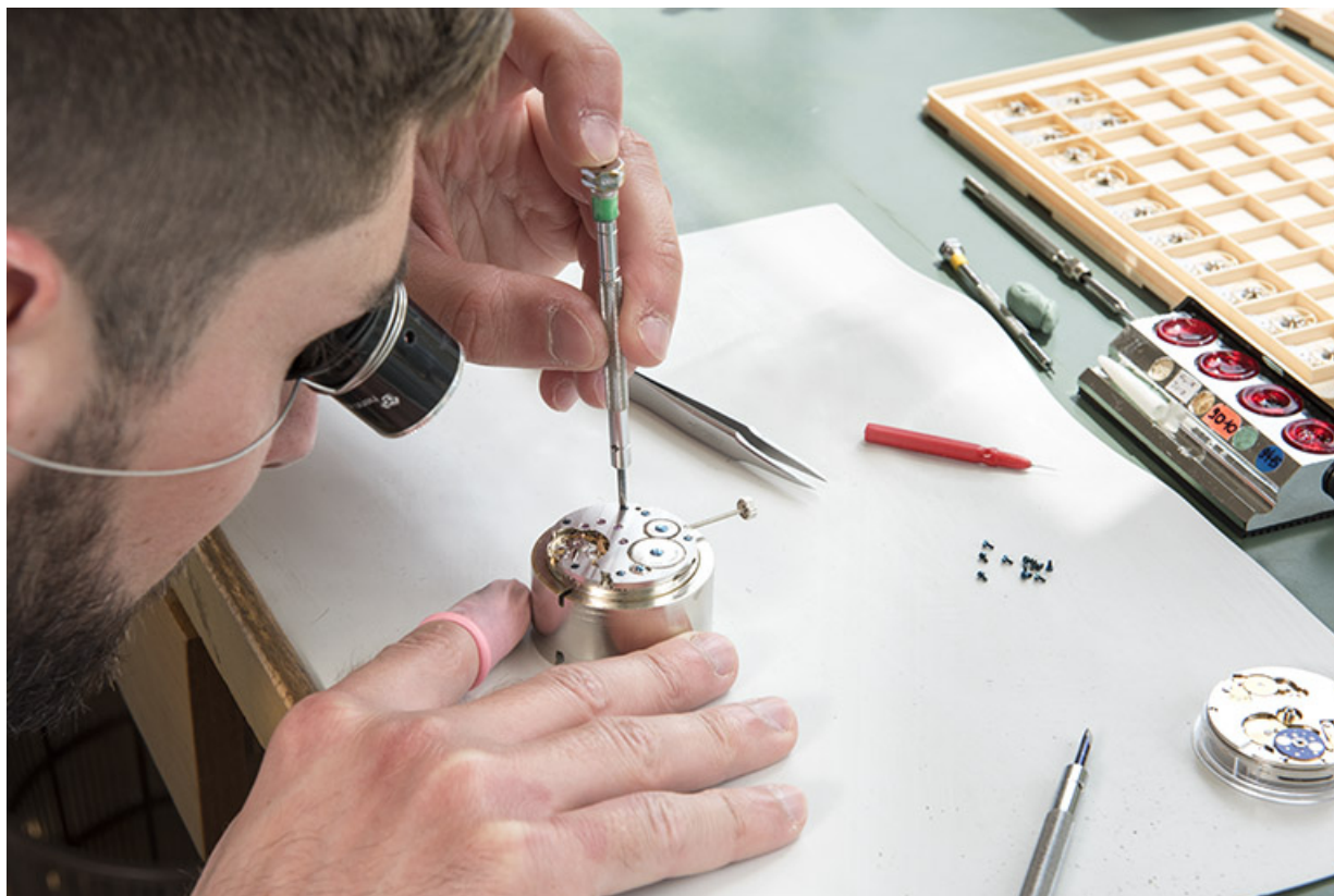
Horloger à l'établi : assemblage d'une montre.