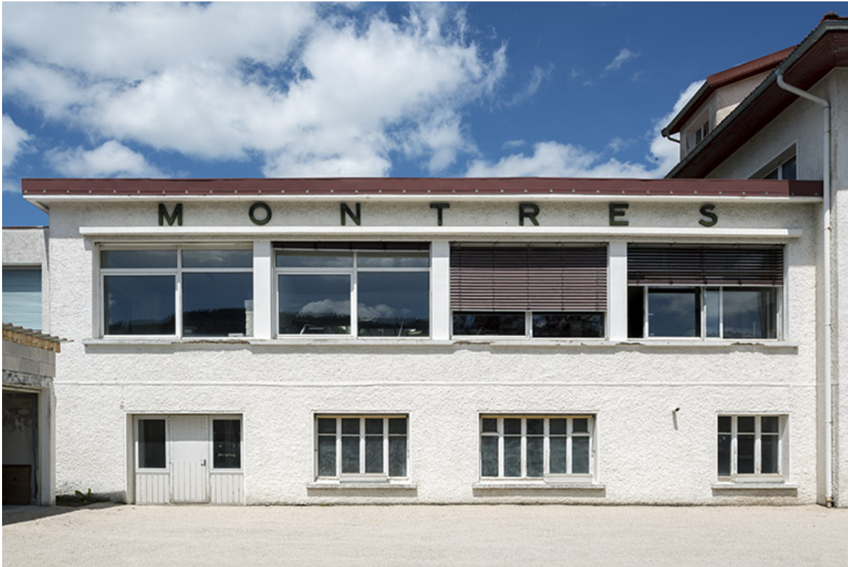
Façade antérieure de l'usine.