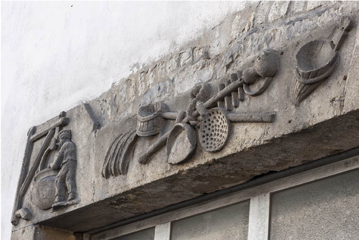
Linteau figurant le métier de fromager.