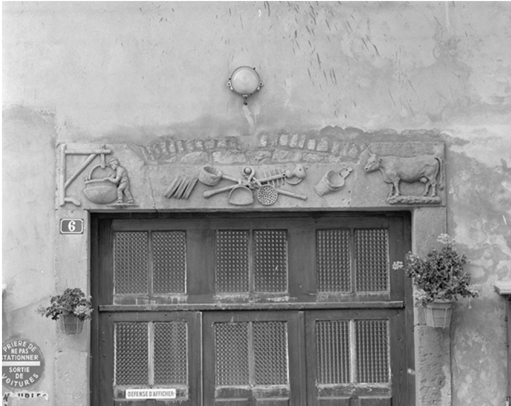
Linteau de la porte d'entrée.