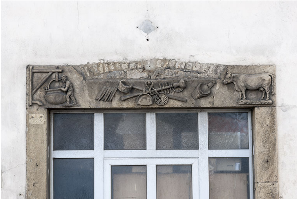
Façade antérieure. Linteau figuré.