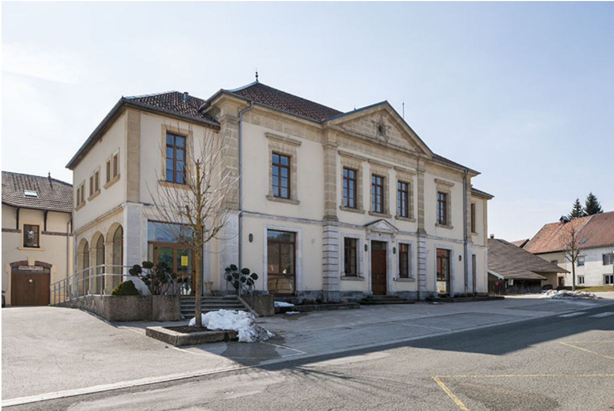
Mairie-fromagerie vue de trois quarts gauche.