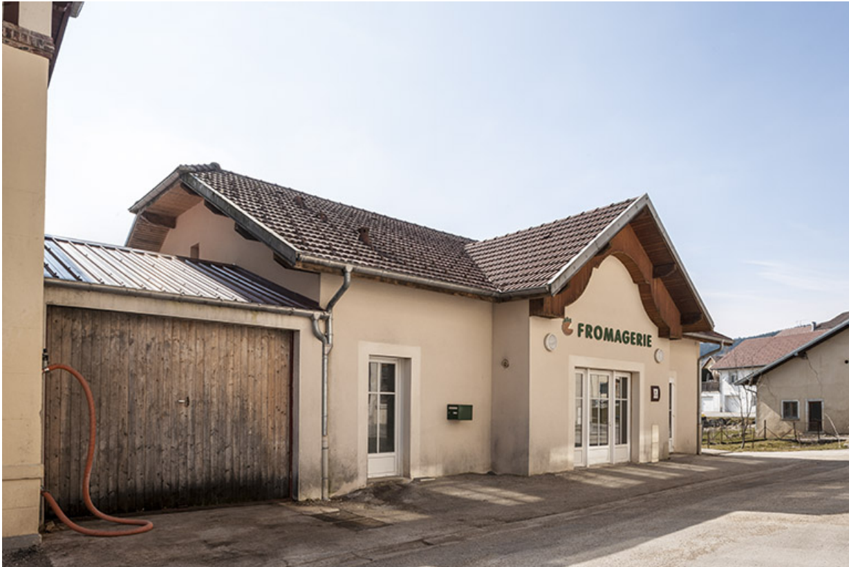
Nouvelle fromagerie vue de trois quarts gauche.