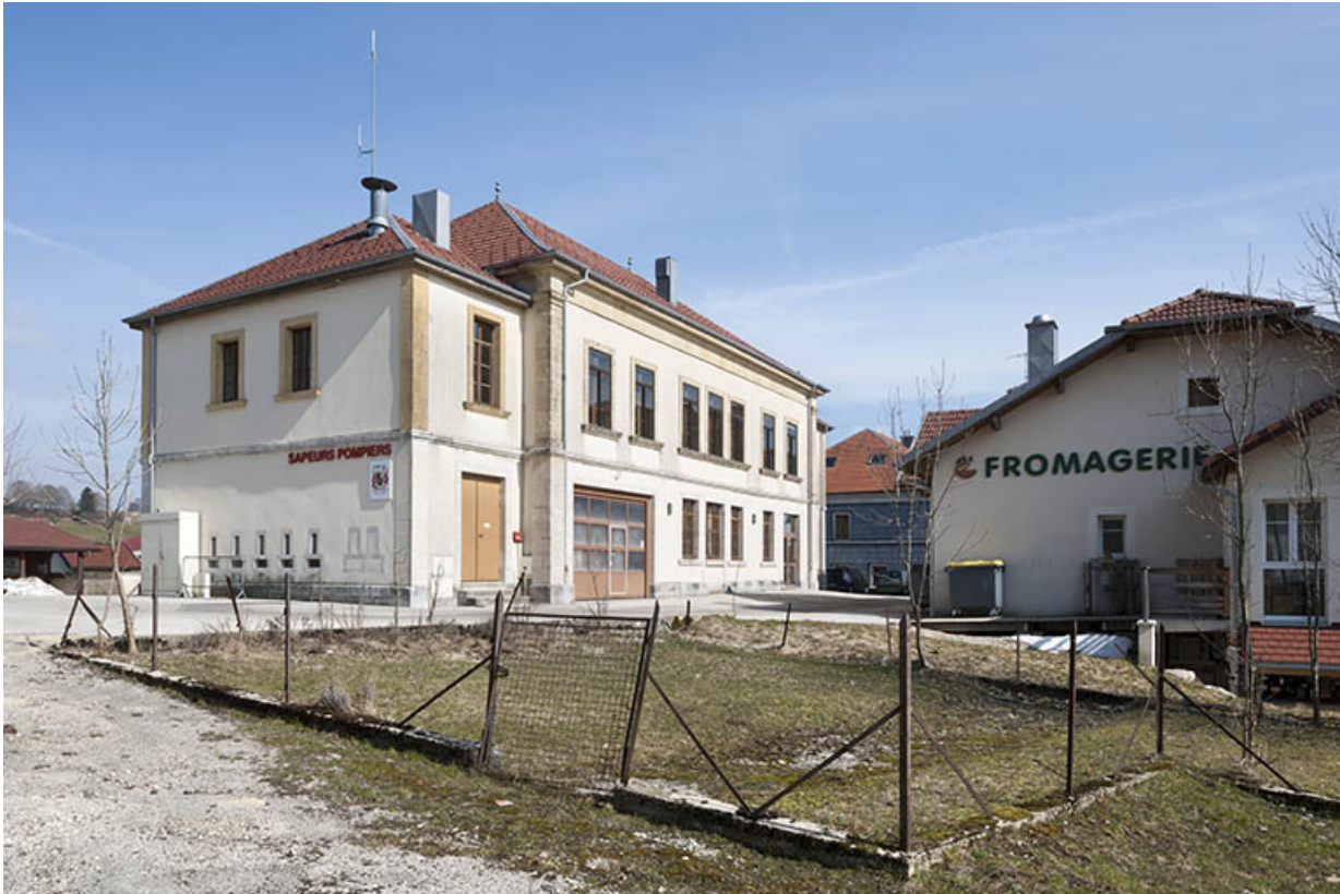
Les fromageries vues depuis l'ouest.