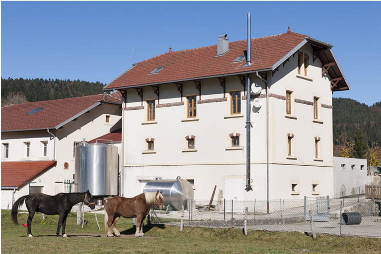
Vue de trois quarts arrière.