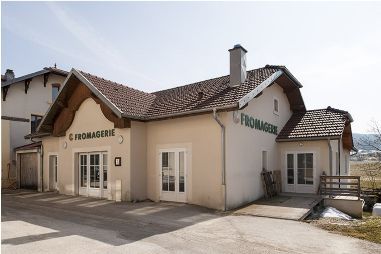
Nouvelle fromagerie vue de trois quarts droite.