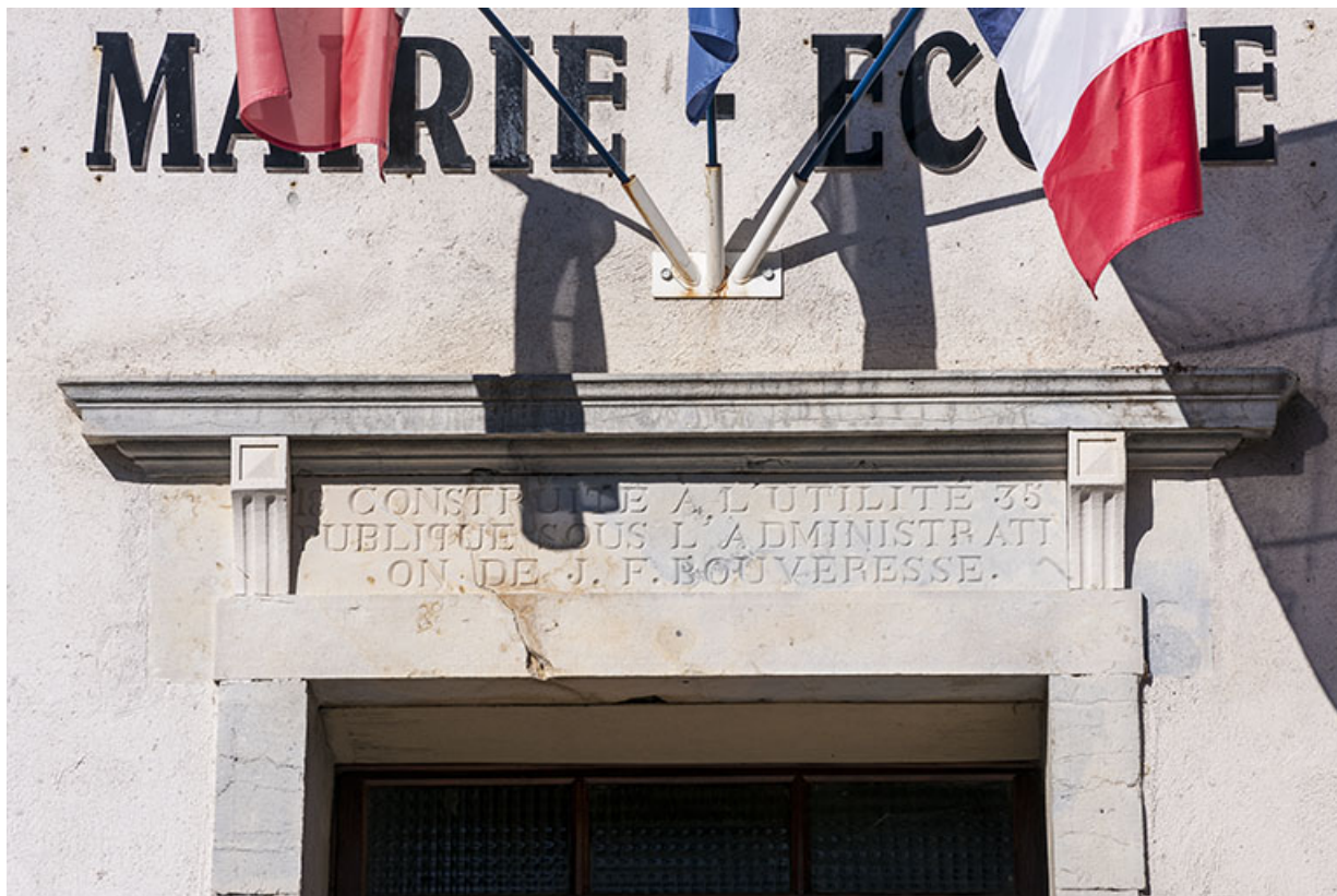
Inscription surmontant la porte principale.