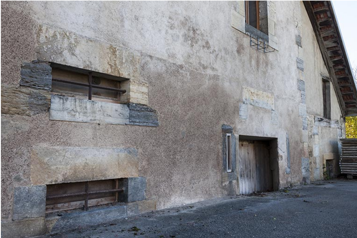
Ouvertures (caves d'affinage) sur la façade postérieure.