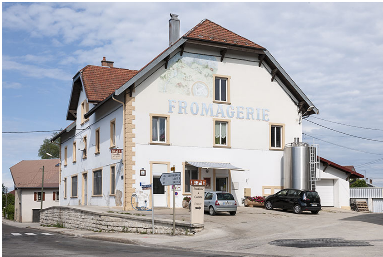
Vue d'ensemble depuis l'est. 25, Frasne, 2 rue de Bellevue