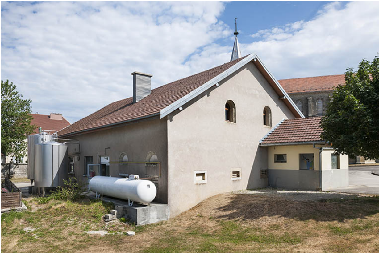
Vue de trois quarts arrière en 2015.