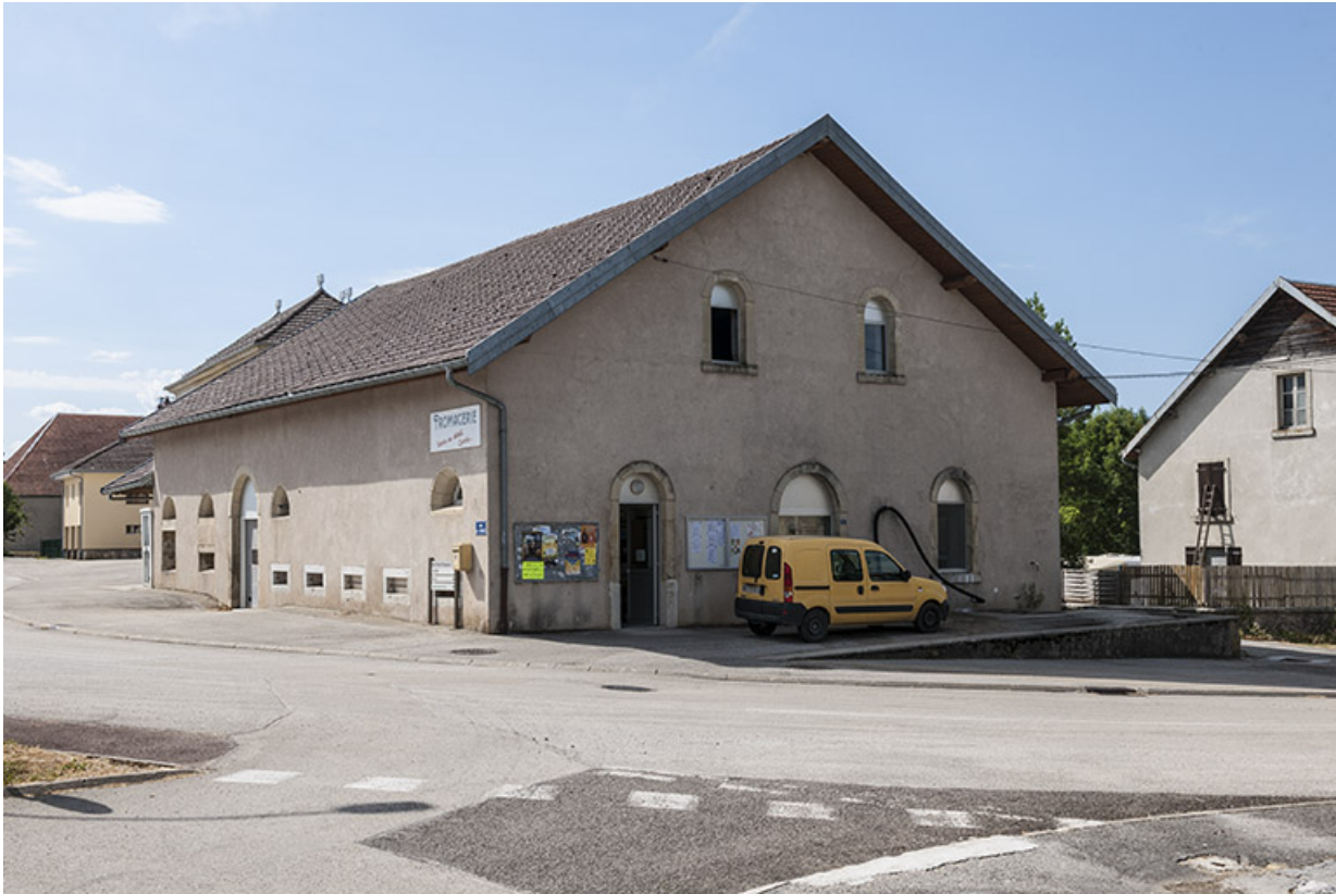
Vue de trois quarts gauche en 2015.