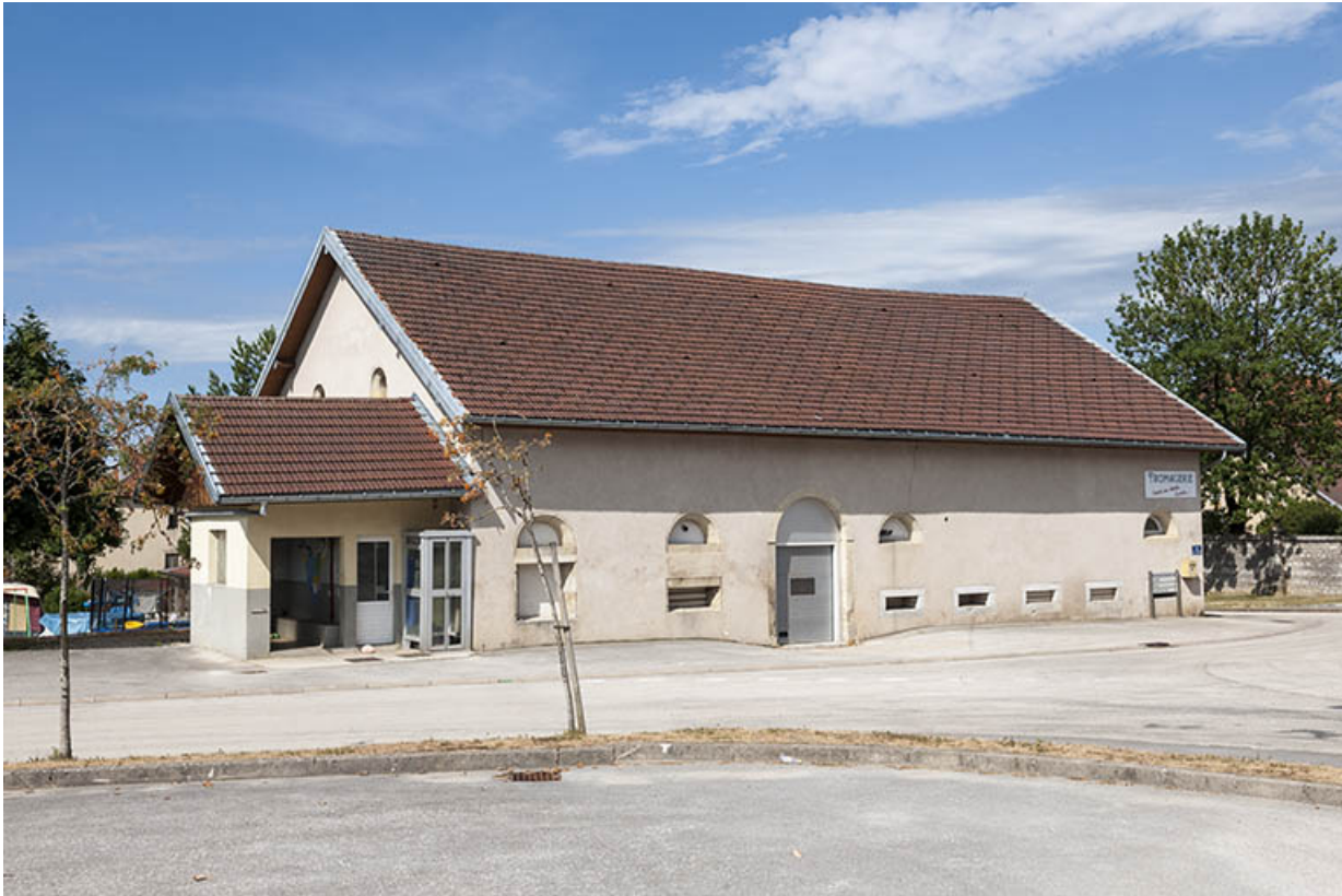
Façade nord en 2015.