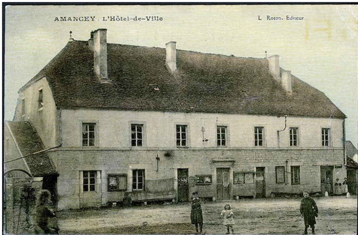
Amancey - L'hôtel de ville, carte postale, s.d. [fin 19e ou début 20e siècle]. 25, Amancey, 1 place de la Mairie