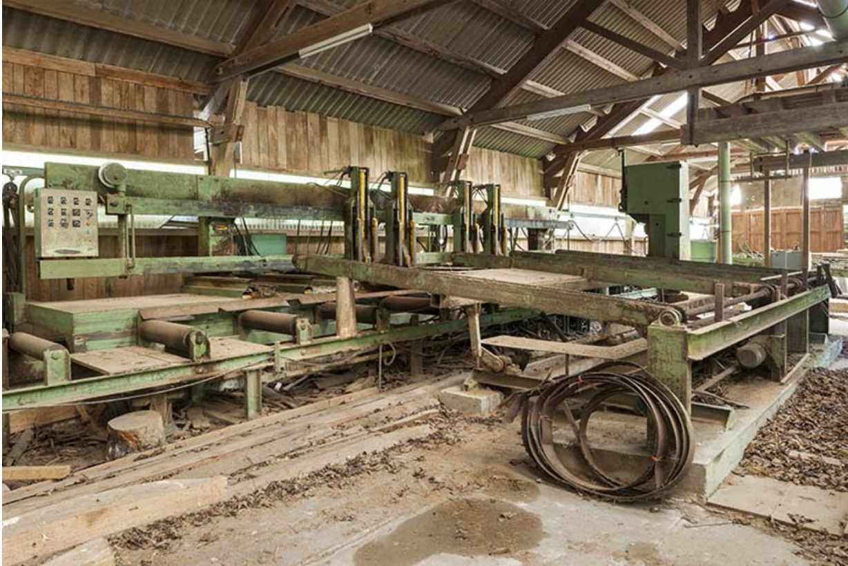
Chariot de la scie à ruban.

25, Éternoz route d' Alaise, lieudit : Chiprey