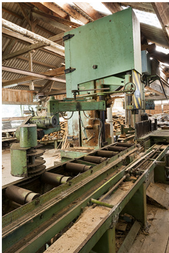
Scie (à ruban) de reprise.

25, Éternoz route d' Alaise, lieudit : Chiprey