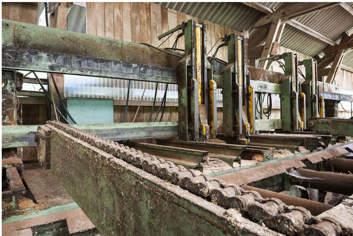
Table de la scie à ruban.

25, Éternoz route d' Alaise, lieudit : Chiprey