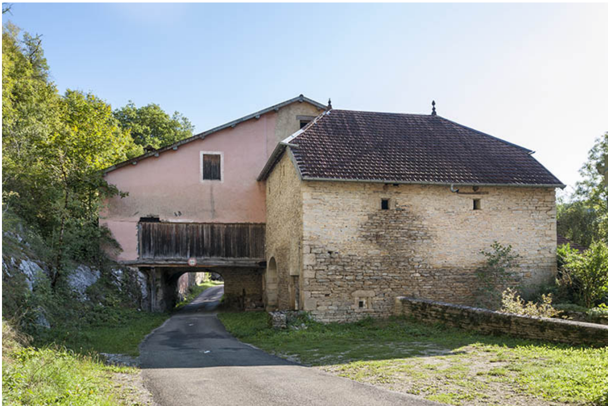
Façade ouest du moulin.

25, Éternoz route d' Alaise, lieudit : Chiprey