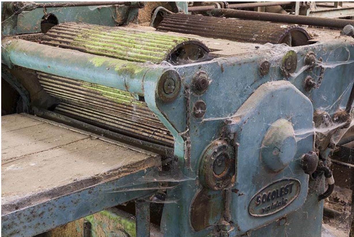
Déligneuse. Détail des rouleaux cannelés.

25, Éternoz route d' Alaise, lieudit : Chiprey