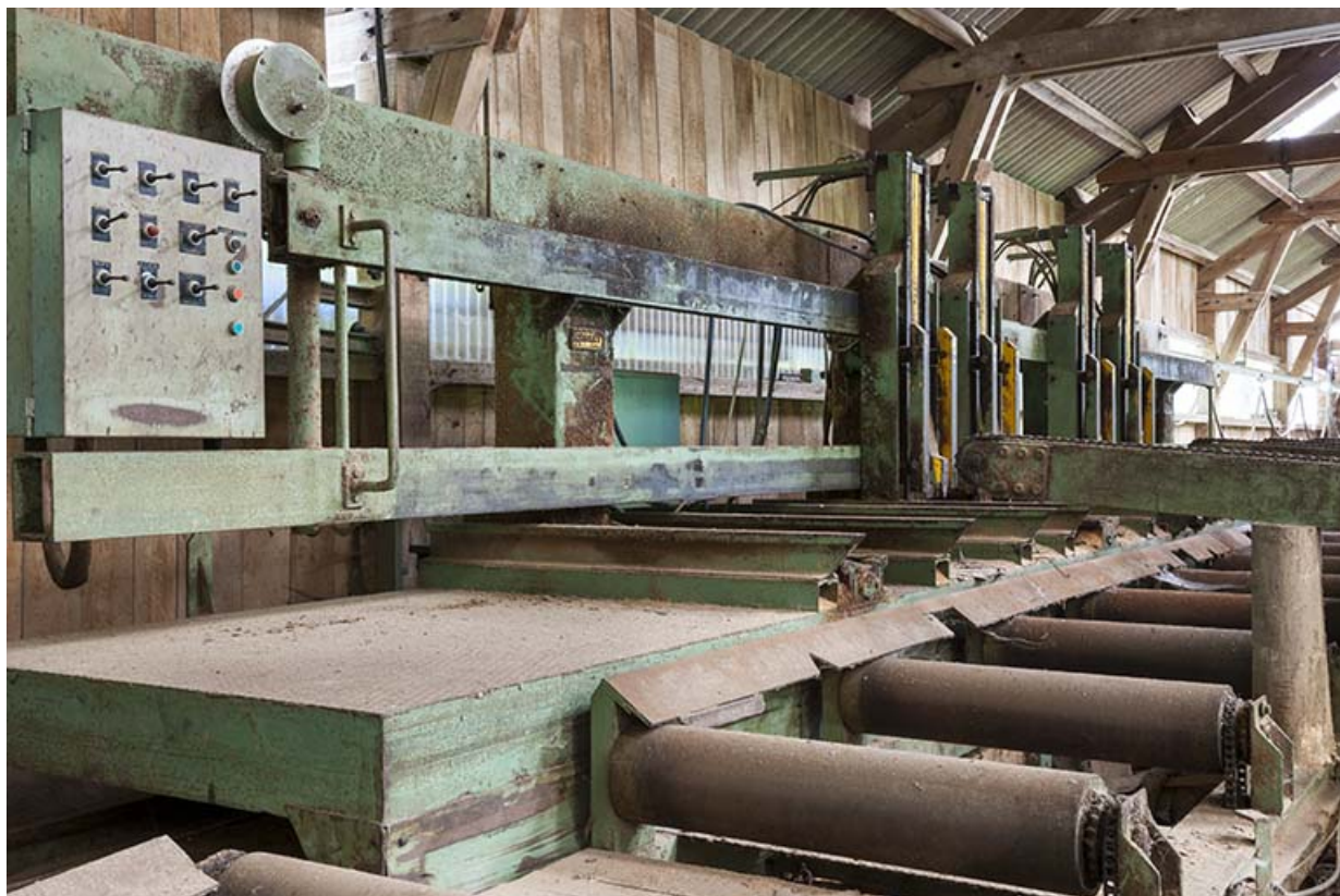
Détail du convoyeur de la scie à ruban.

25, Éternoz route d' Alaise, lieudit : Chiprey