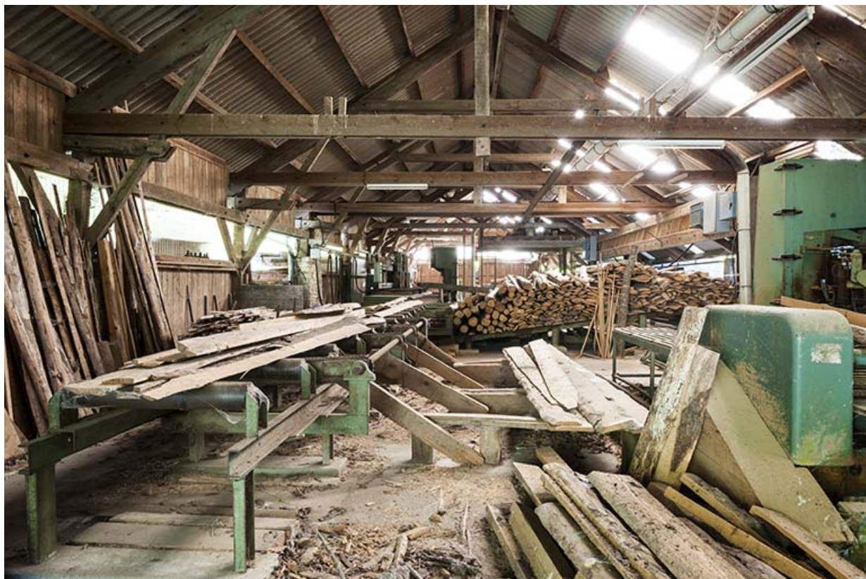
Vue intérieure de l'atelier de scierie.

25, Éternoz route d' Alaise, lieudit : Chiprey