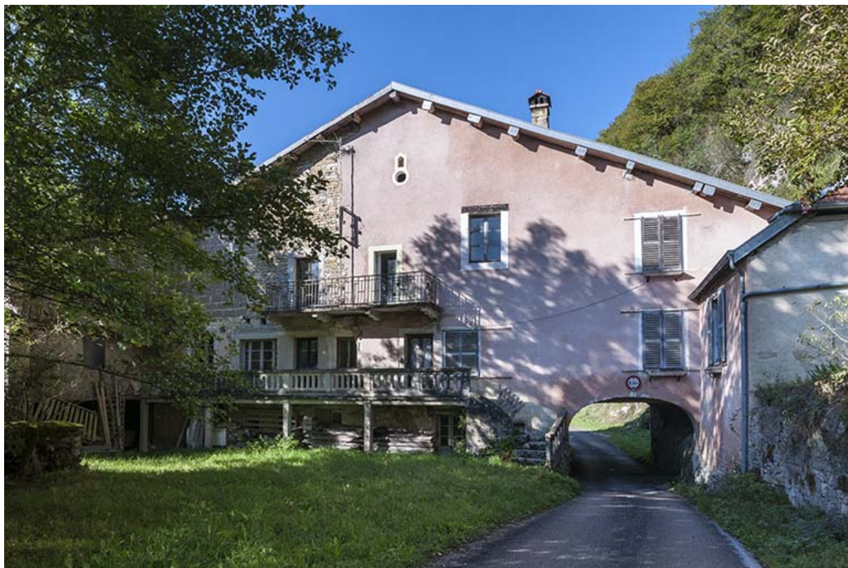
Façade est du moulin.

25, Éternoz route d' Alaise, lieudit : Chiprey