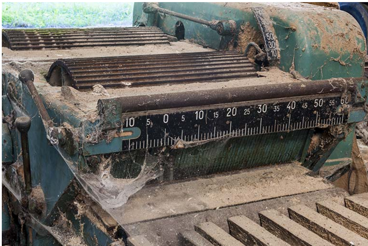
Barre de réglage de la déligneuse.

25, Éternoz route d' Alaise, lieudit : Chiprey