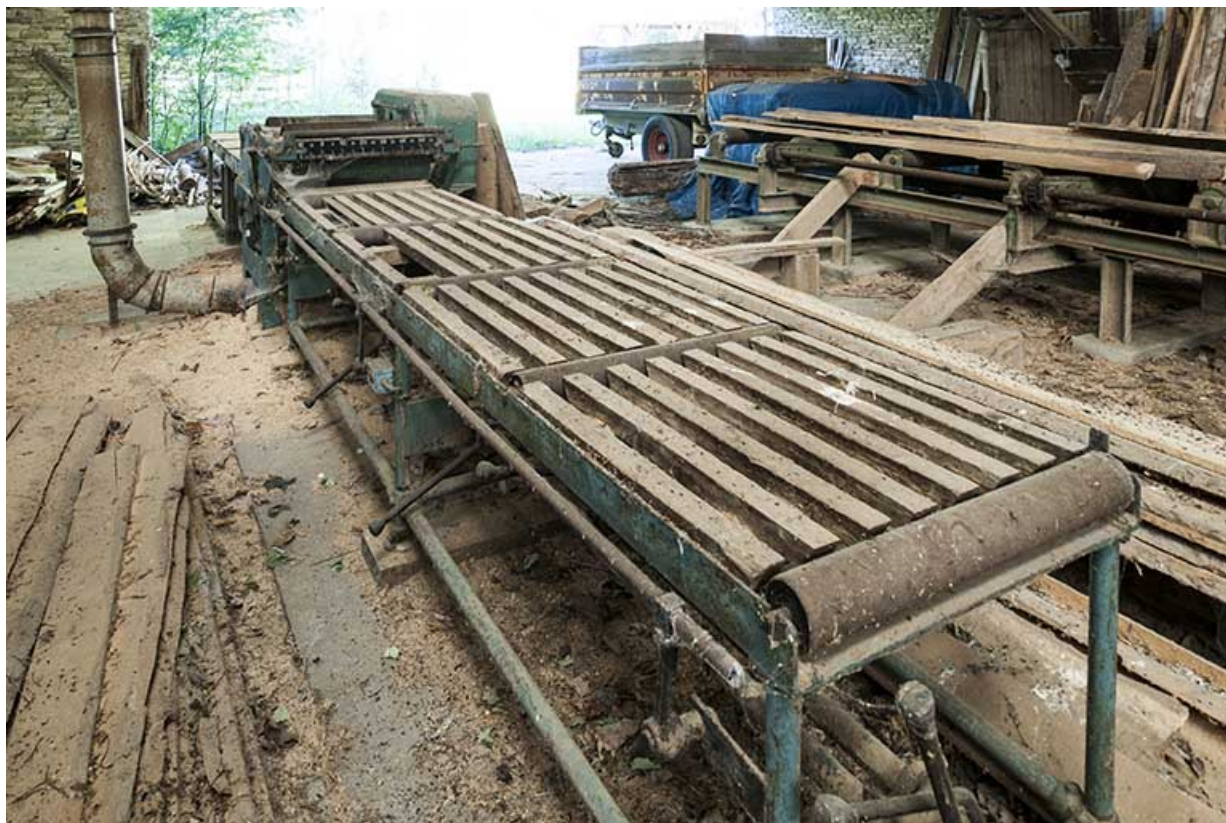
Tapis à rouleaux de la déligneuse.

25, Éternoz route d' Alaise, lieudit : Chiprey