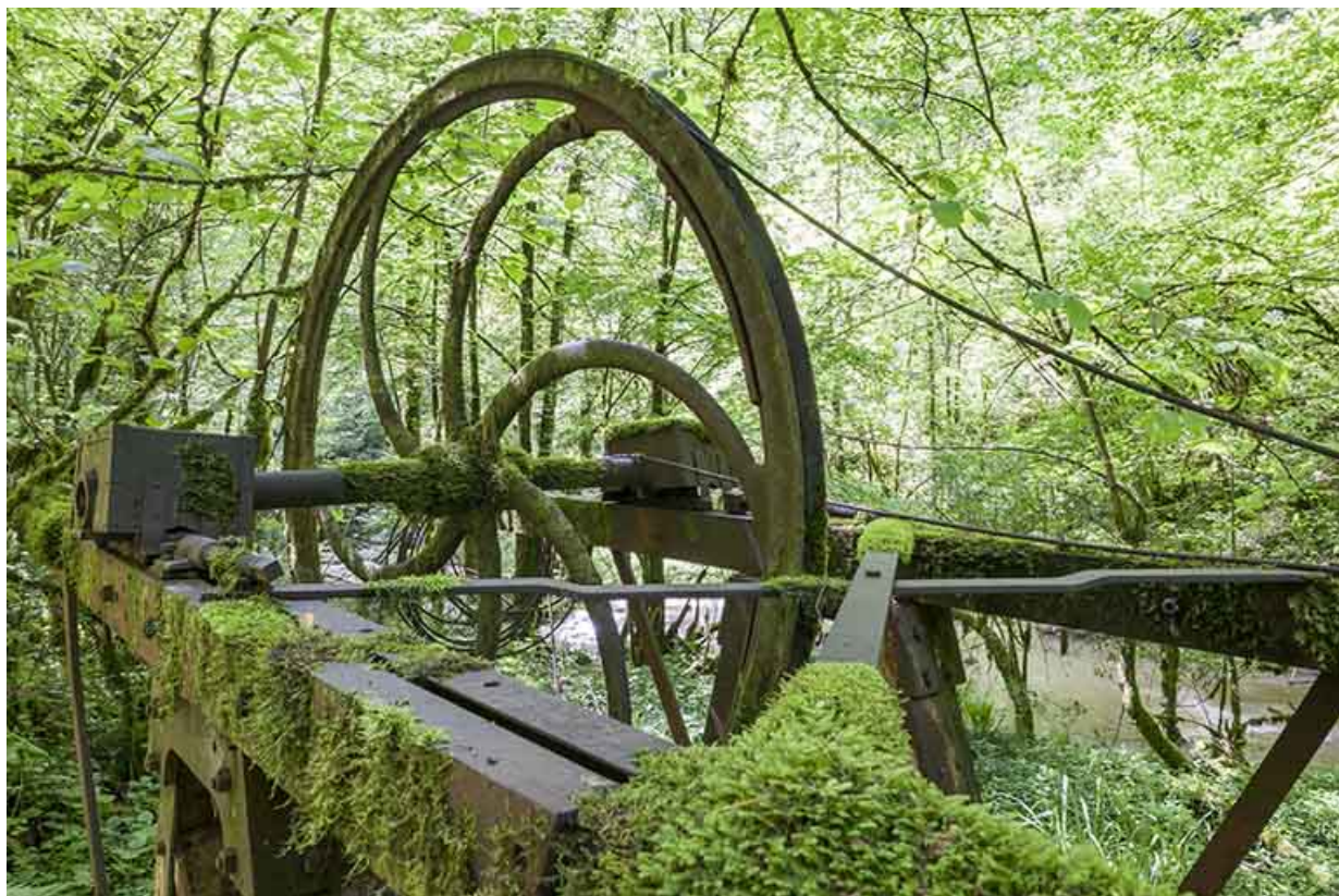
Poulie métallique à gorge du support aval.