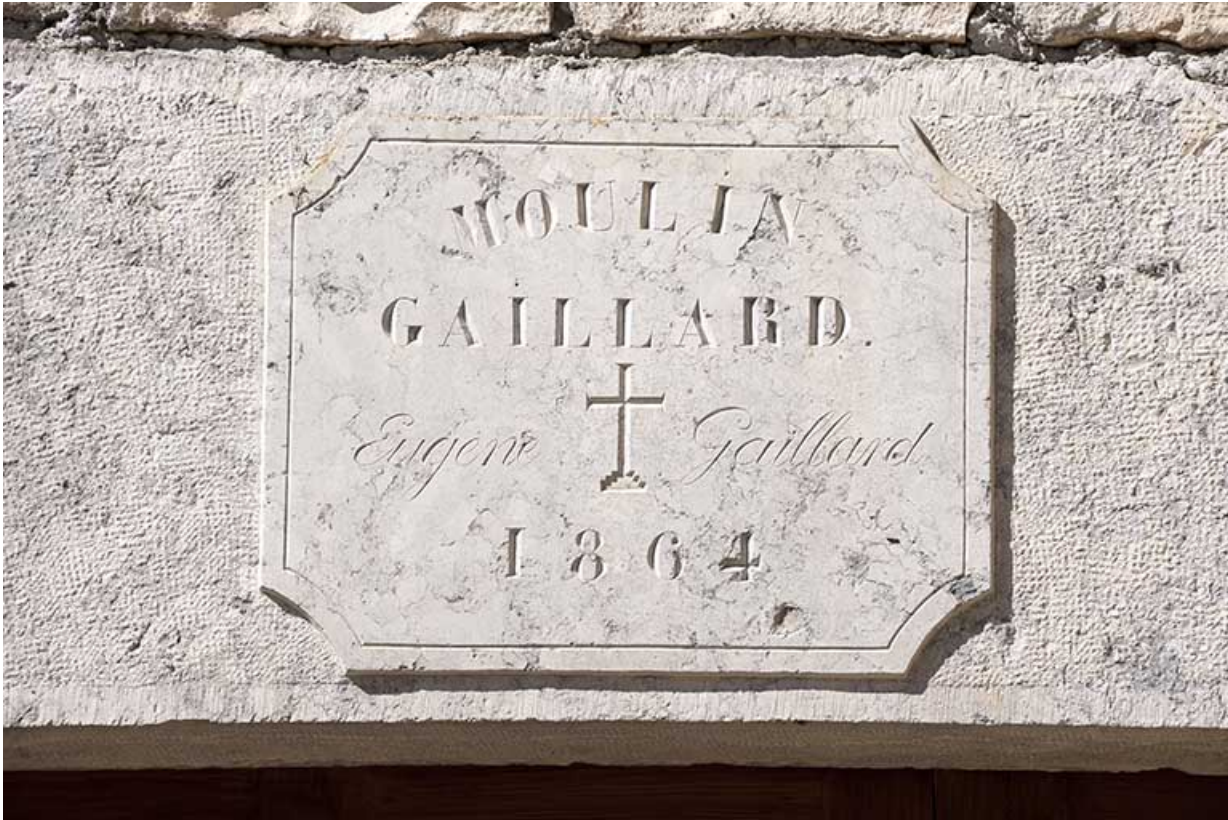
Linteau de porte du moulin.