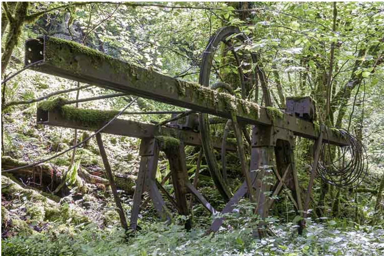
Support métallique (aval) de la transmission par câble.