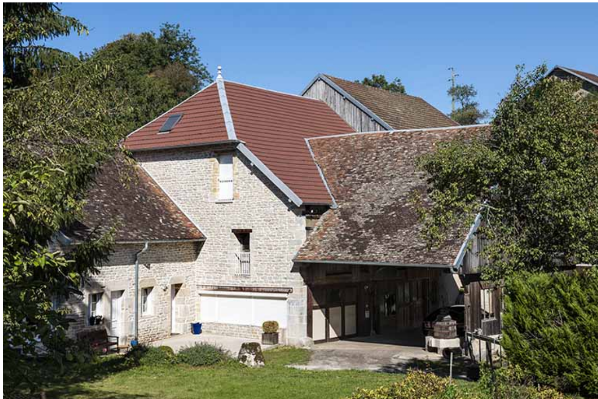
Ateliers de la scierie et du moulin.