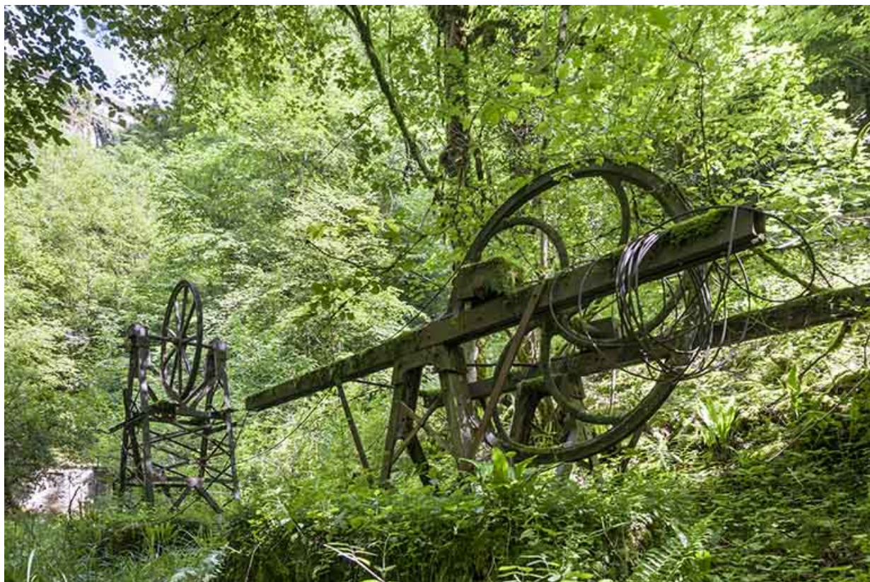
Supports métalliques de la transmission par câble.