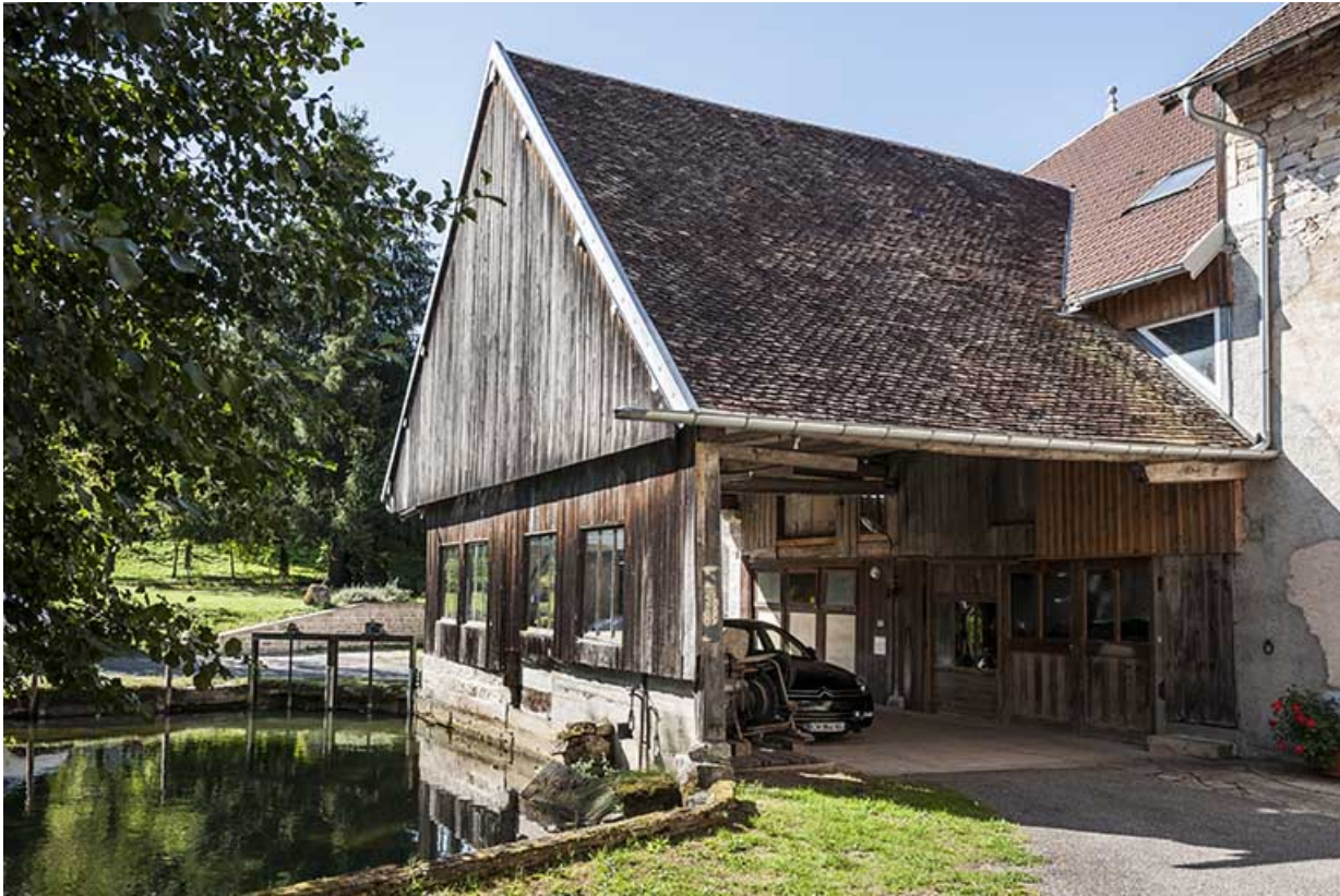
Prise d'eau de la retenue et passage couvert de la scierie. 25, Éternoz, 4 rue du Moulin