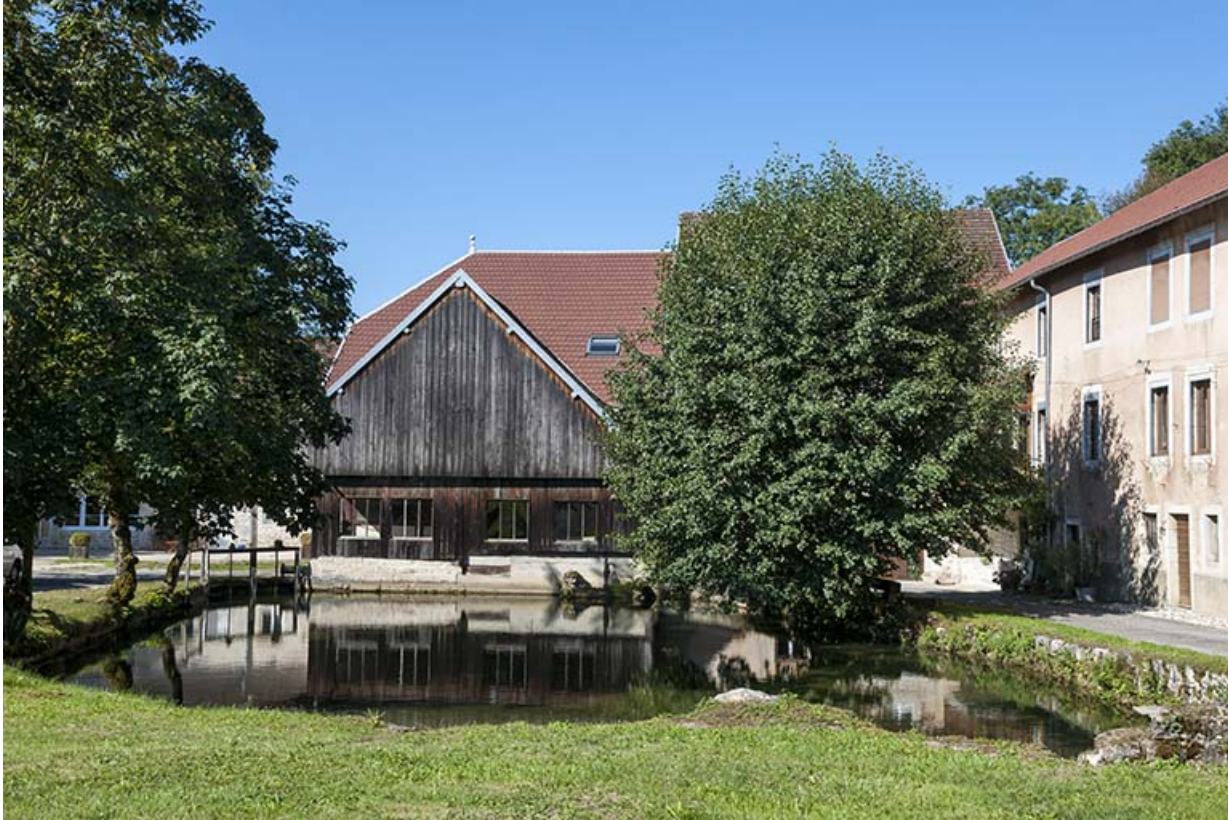
Atelier de scierie depuis le bassin de retenue, à l'est. 25, Éternoz, 4 rue du Moulin