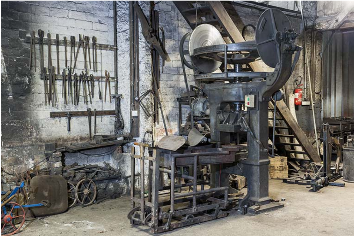
Balancier à friction (emboutissage des socs).