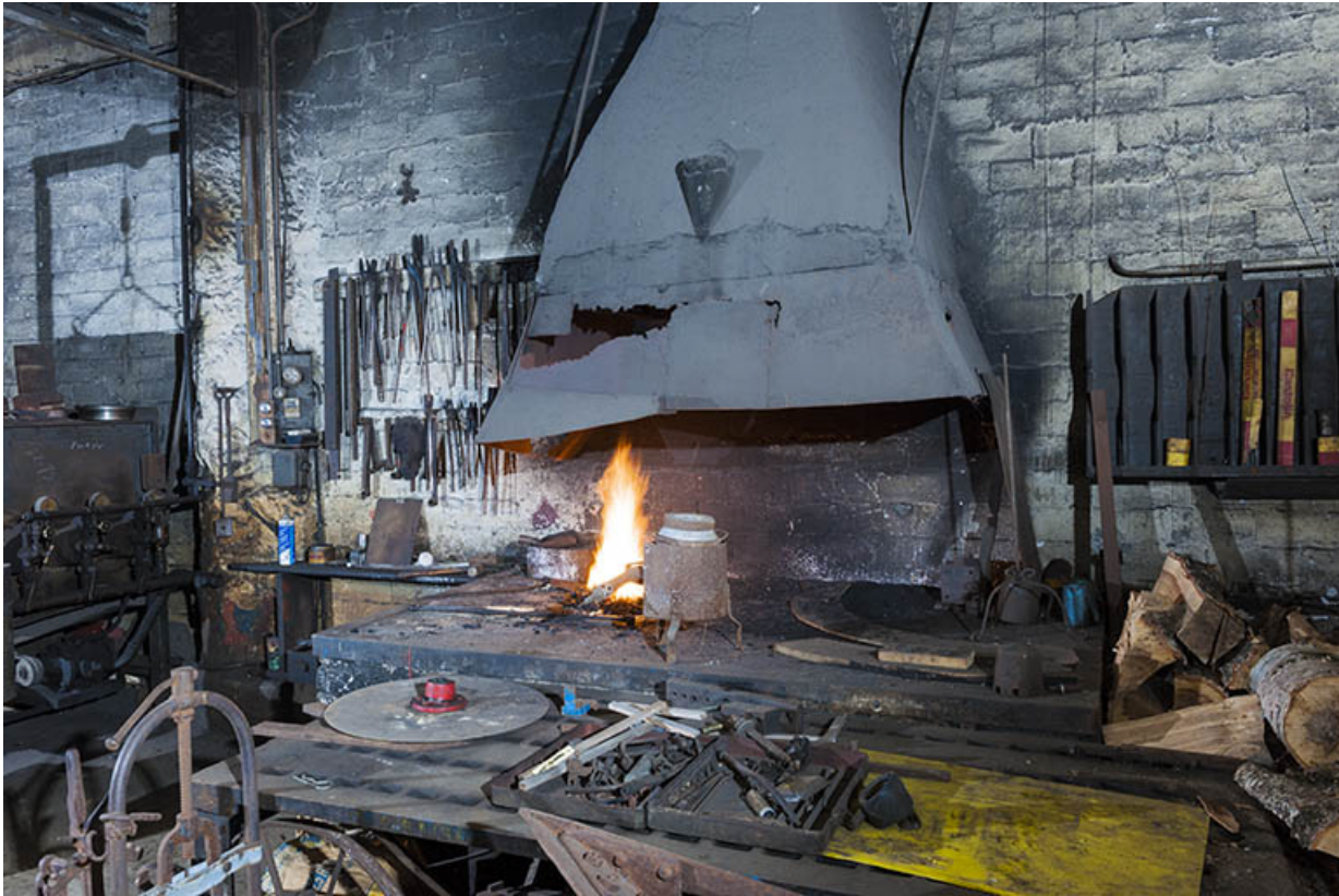
Forge. Vue de trois quarts.