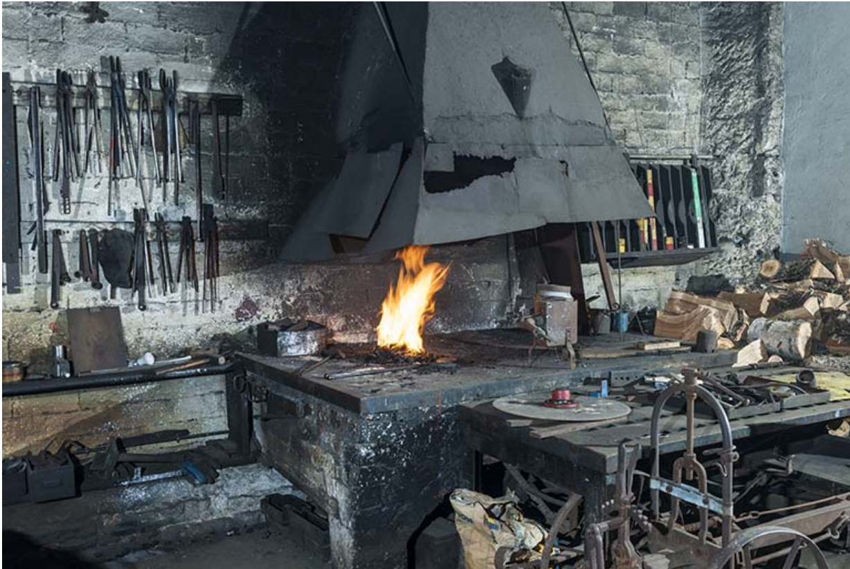
Forge. Vue d'ensemble.