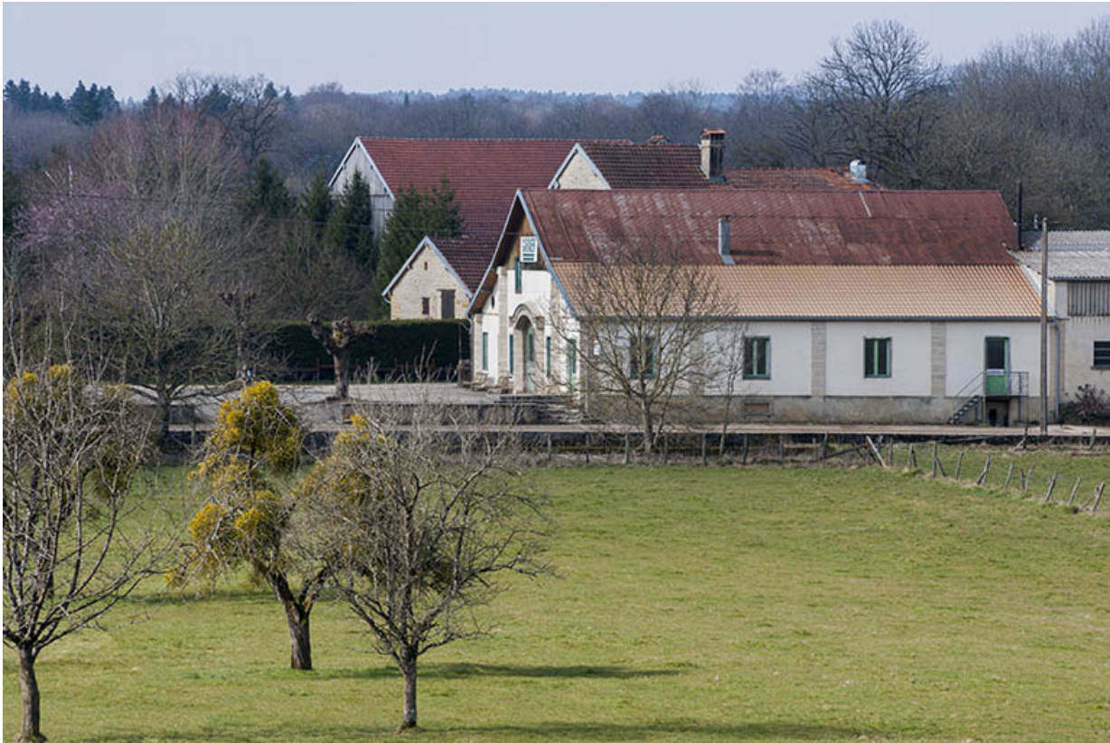
Façade nord de l'atelier de fabrication.