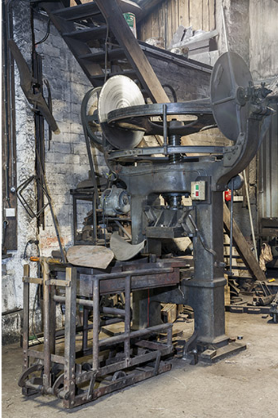
Balancier à friction et sa desserte.