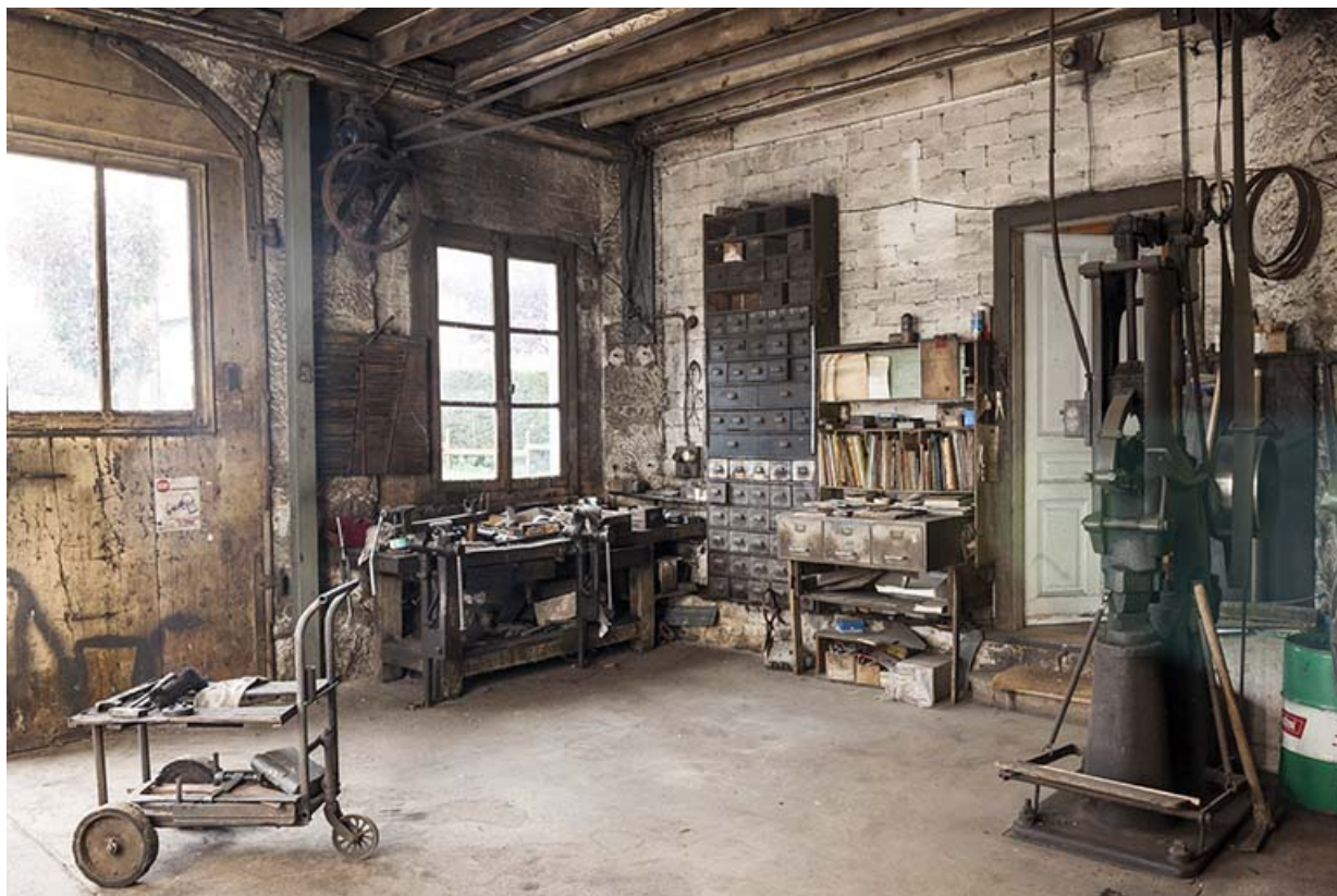
Entrée de l'atelier.