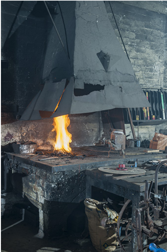
Forge : le foyer et le manteau en tôle.