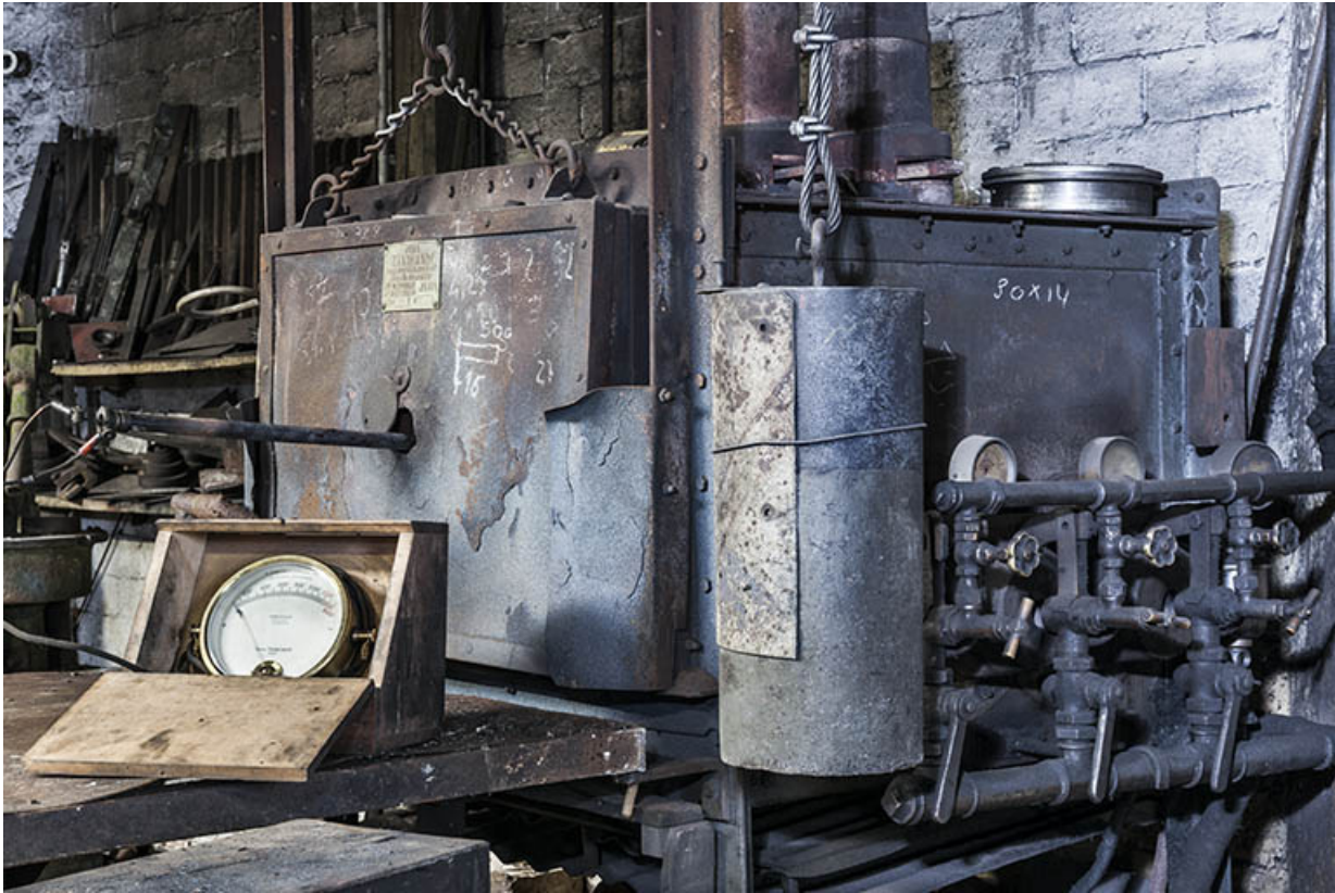
Four à fuel de marque Tranchant (Paris). Au premier plan : pyromètre et sa sonde. 25, Éternoz, 39 Grand Rue