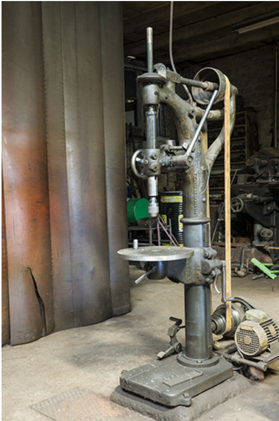
Perceuse à colonne Rego-AA-Jones