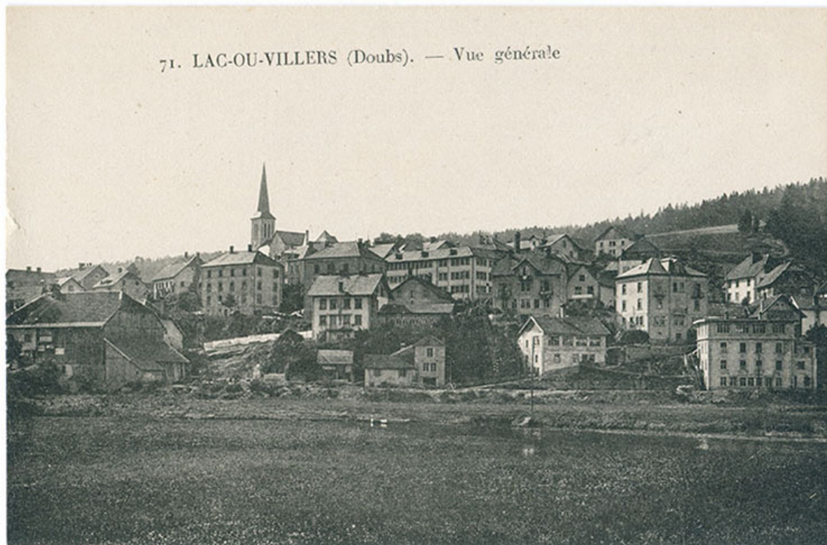
71. Lac-ou-Villers (Doubs). - Vue générale [le quartier des rues du Lac et du Doubs, depuis l'est], décennie 1930. 25, Villers-le-Lac, 3 et 4 rue du Lac

71. Lac-ou-Villers (Doubs). - Vue générale [le quartier des rues du Lac et du Doubs, depuis l'est], carte postale, s.n., s.d. [décennie 1930]