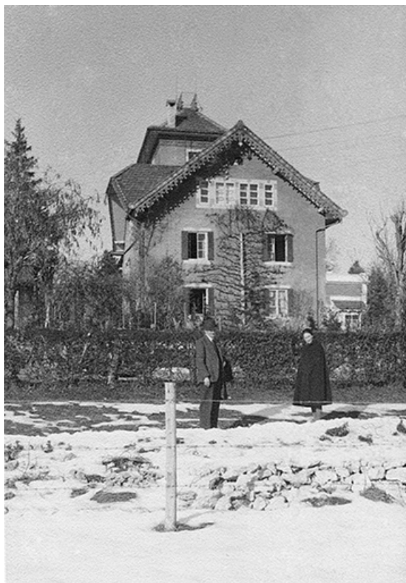
[La maison : façade latérale gauche], 1950.

25, Villers-le-Lac rue des Vergers, lieudit : le Replenot