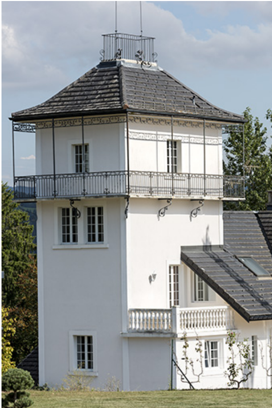
Tour, vue du nord-ouest.

25, Villers-le-Lac rue des Vergers, lieudit : le Replenot