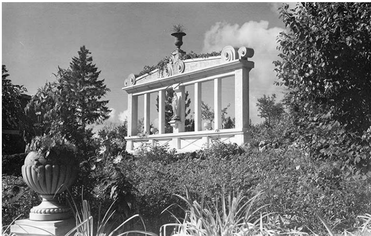
[Le monument à la Vierge], décennie 1950 [1957 ?]. 25, Villers-le-Lac rue des Vergers, lieudit : le Replenot