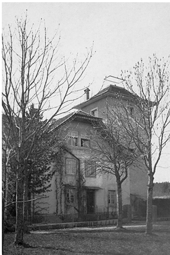
[La maison : façade latérale droite], 1936.

25, Villers-le-Lac rue des Vergers, lieudit : le Replenot