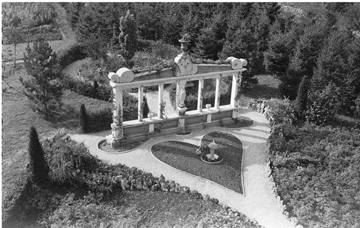
[Vue plongeante sur le monument à la Vierge], décennie 1950 [1957 ?].

25, Villers-le-Lac rue des Vergers, lieudit : le Replenot