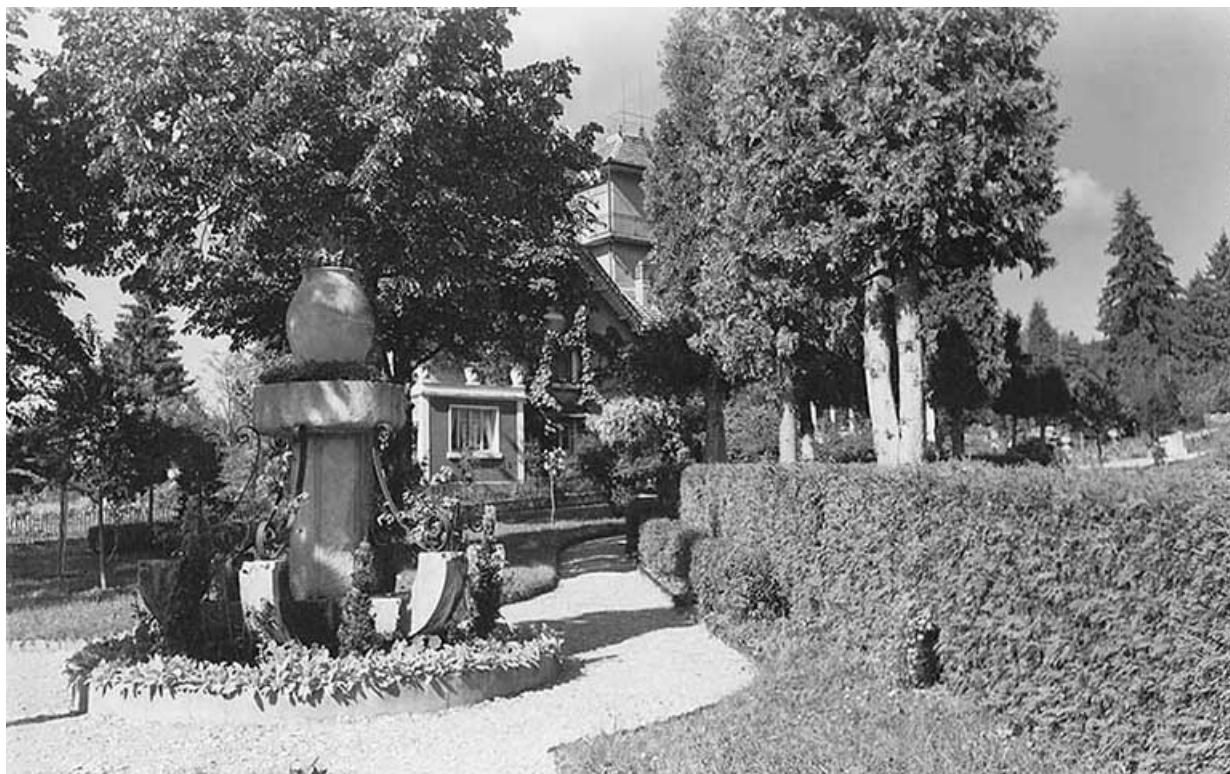
[Le parc et la maison], décennie 1950 [1957 ?].

25, Villers-le-Lac rue des Vergers, lieudit : le Replenot