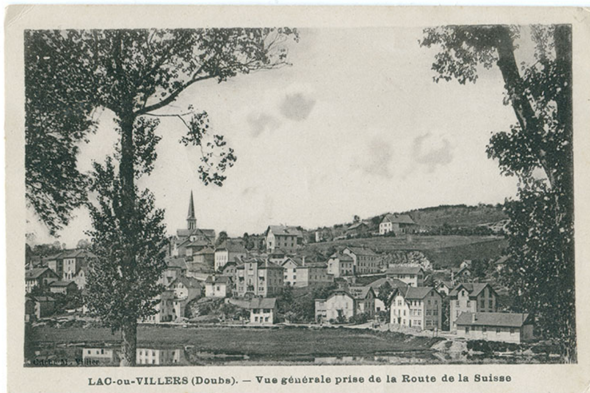
Lac-ou-Villers (Doubs). - Vue générale prise de la route de la Suisse [vue d'ensemble du village, depuis l'est], 2e quart 20e siècle [avant 1945].