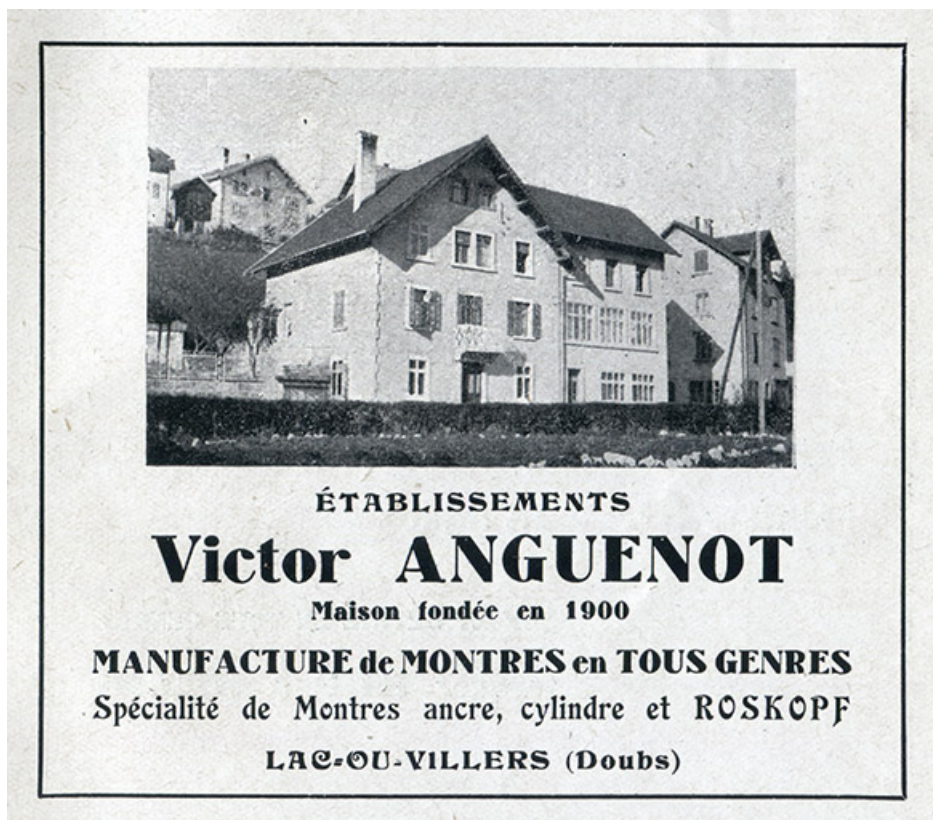
Etablissements Victor Anguenot [façade antérieure, de trois quarts gauche], 1943. 25, Villers-le-Lac, 7 rue du Lac

Etablissements Victor Anguenot [façade antérieure, de trois quarts gauche], photographie imprimée, s.n., s.d. [1943]. Publiée dans : Cent cinquantième de la fabrique d'horlogerie de Besançon. - S.l. [Besançon] : impr. Millot Frères, 1943, p. 39.