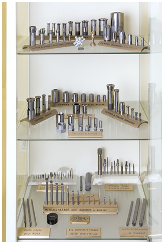
Exemples de produits fabriqués par l'entreprise.