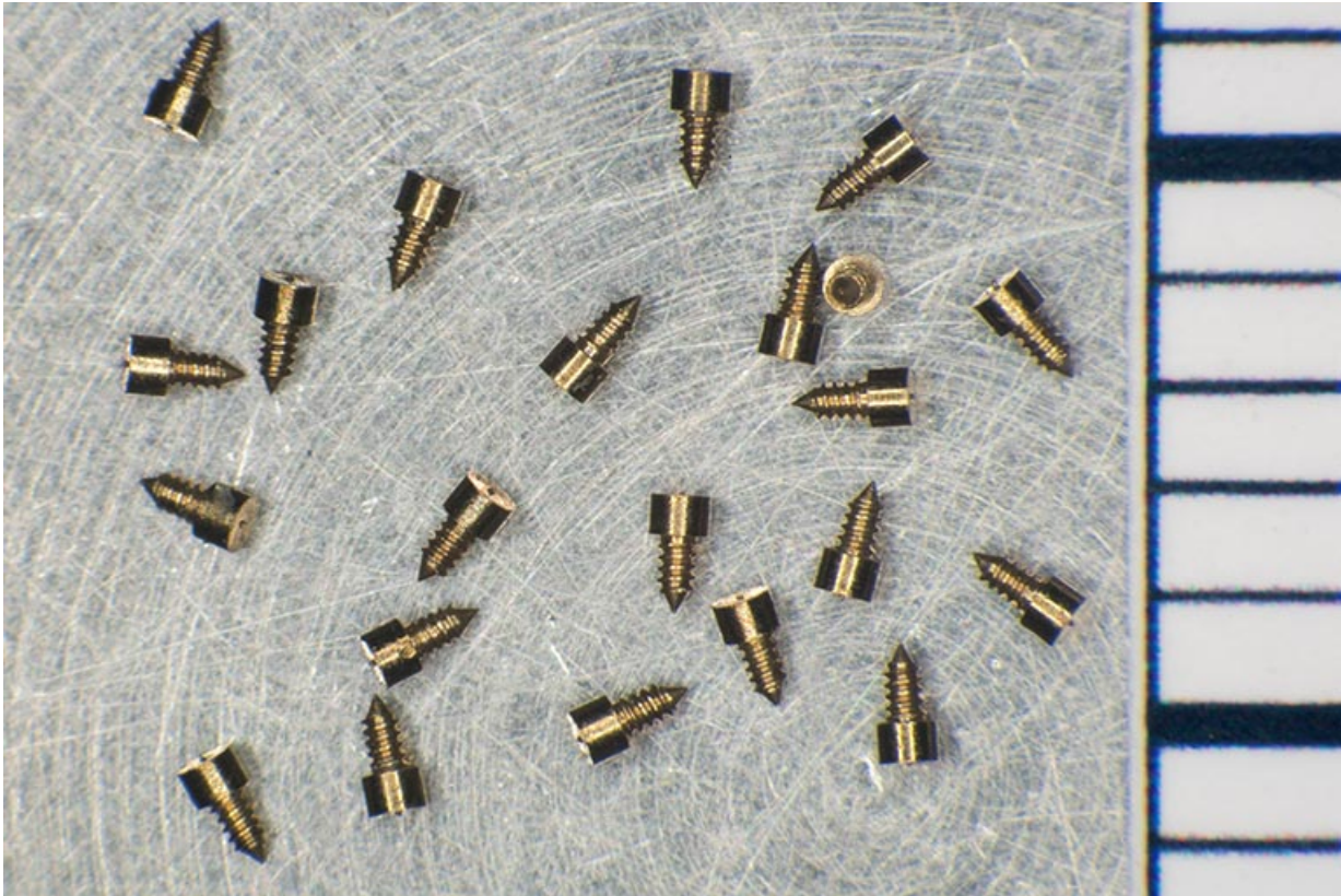
Exemple de composants fabriqués à l'usine : vis destinées au balancier de montre (avec échelle centimétrique). 25, Villers-le-Lac, 3 rue des Essarts