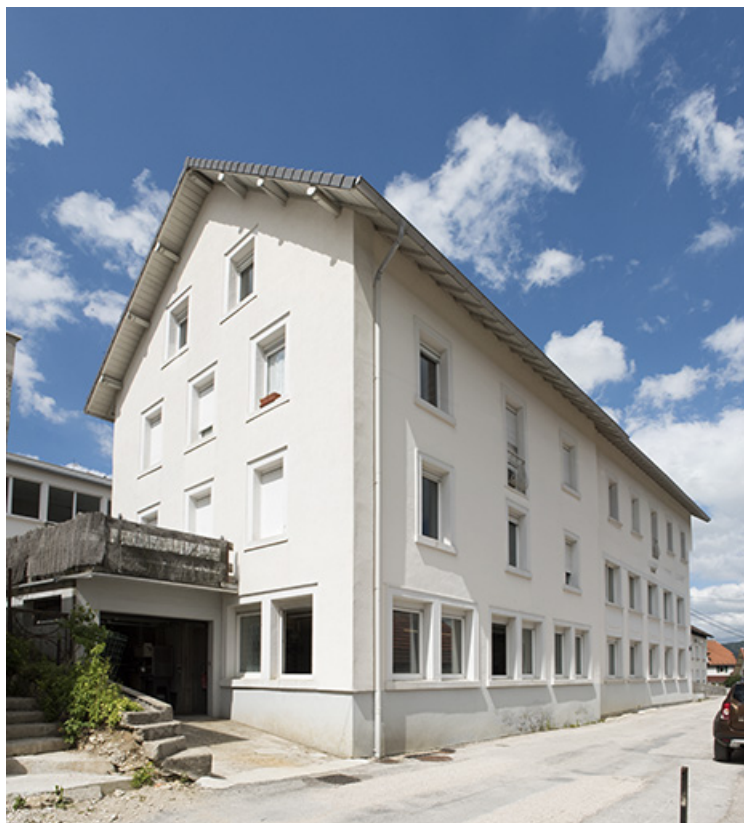
Bâtiments rue de l'Horlogerie : façades sud et ouest.