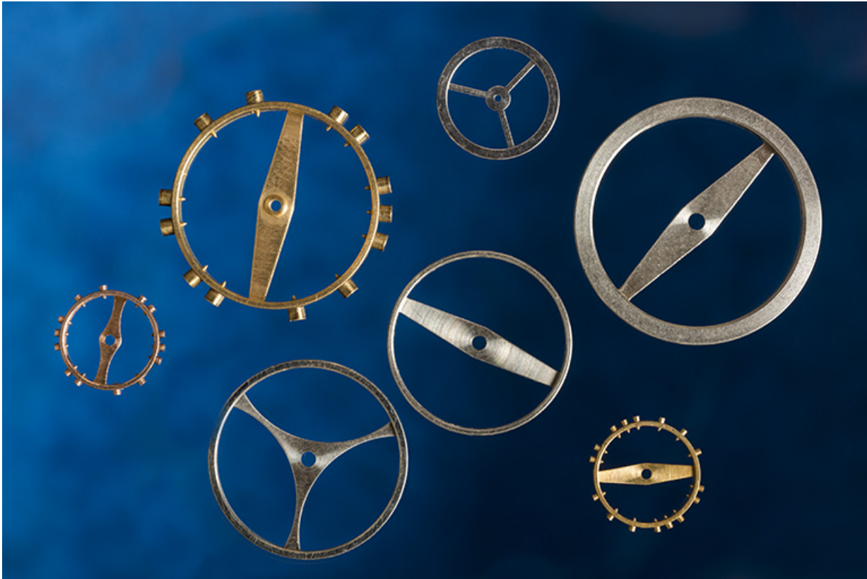
Exemple de composants fabriqués à l'usine : balanciers de montre.