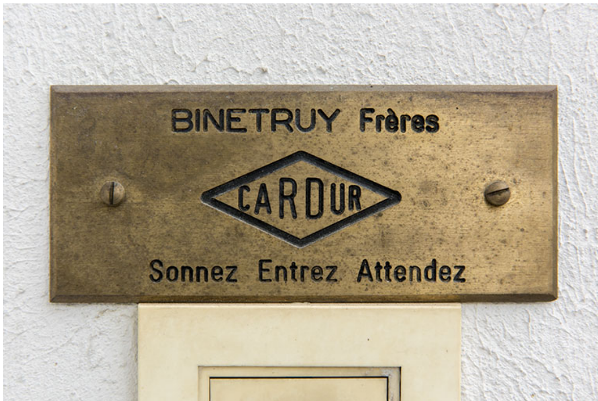
Plaque professionnelle de la société Binétruy Frères.