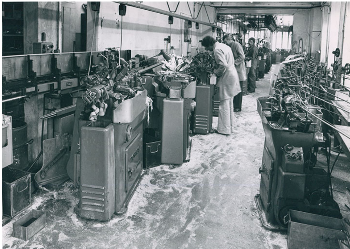
[Intérieur de l'atelier de décolletage], 1978. Daniel Binétruy est au premier plan, Louis au deuxième. 25, Villers-le-Lac, 3 rue des Essarts

[Intérieur de l'atelier de décolletage], photographie, s.n., s.d. [1978].