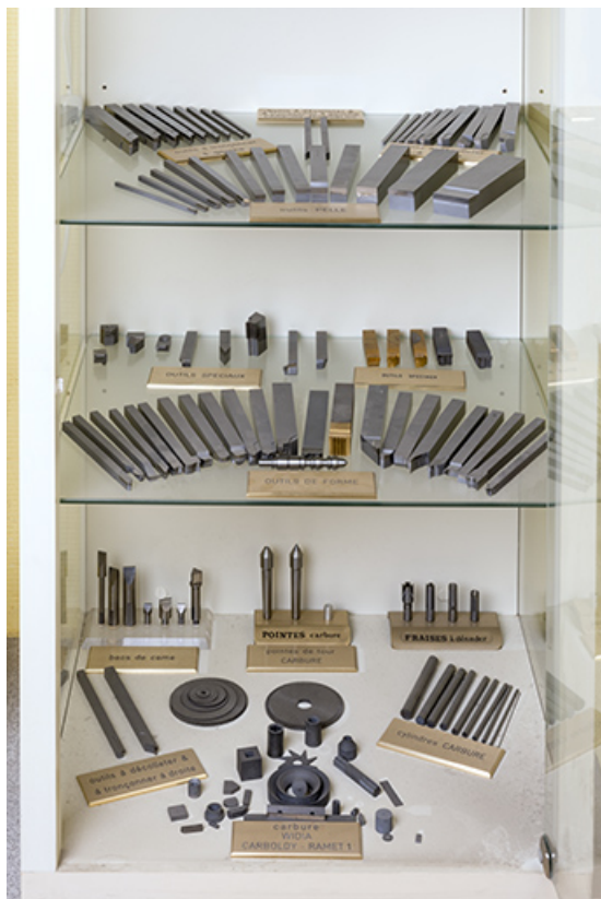
Exemples de produits fabriqués par l'entreprise.