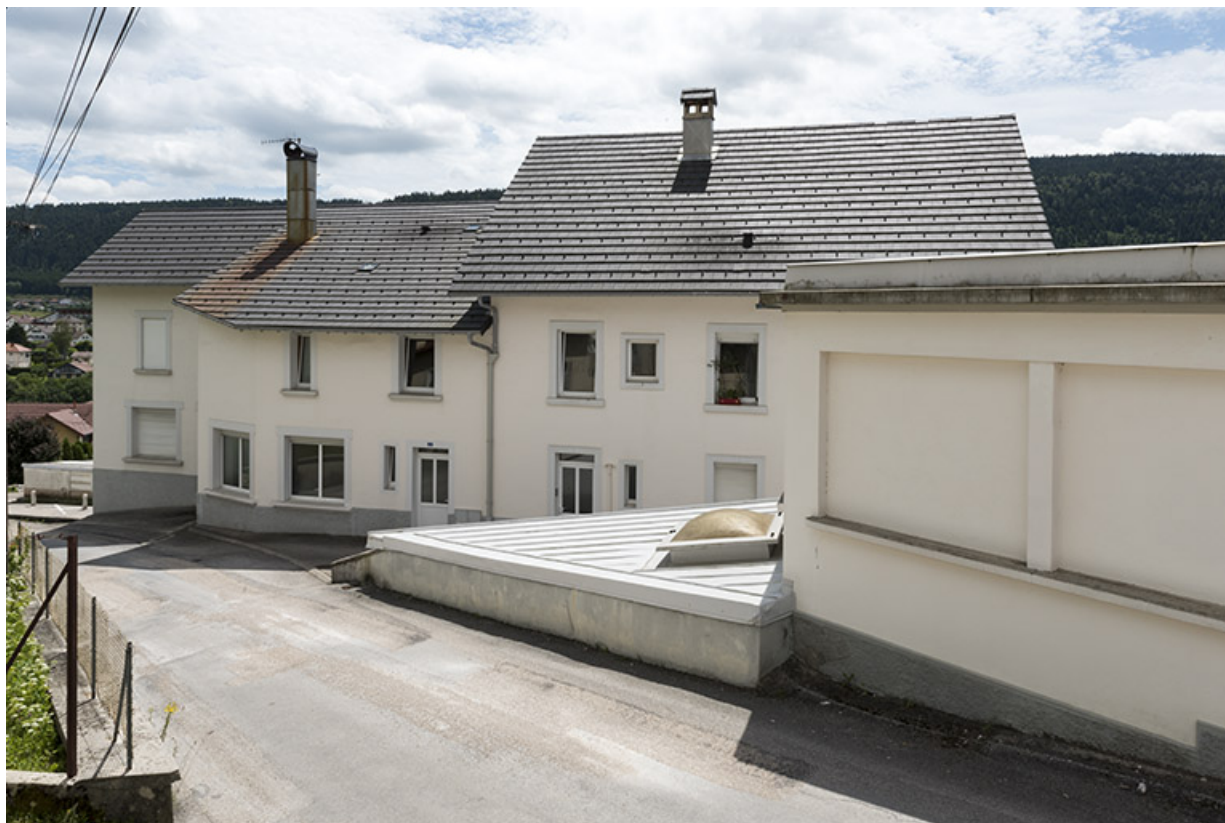
Vue d'ensemble, depuis la rue des Essarts au nord.