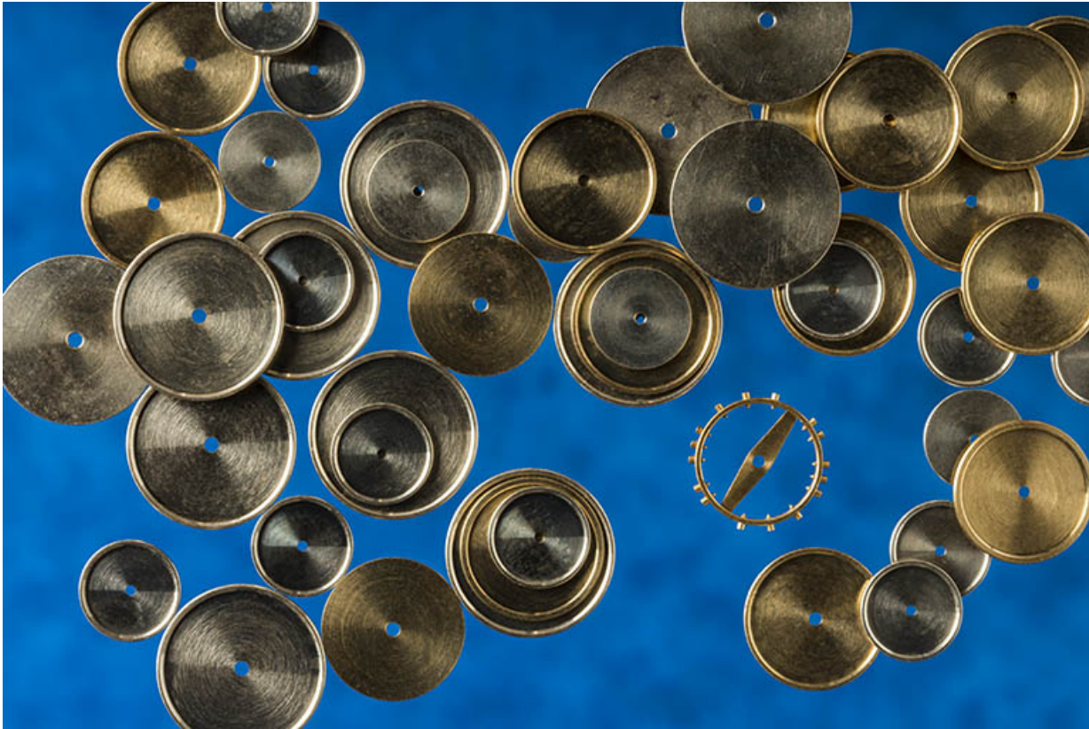
Exemple de composants fabriqués à l'usine : balanciers de montre en cours d'usinage (rondelles).