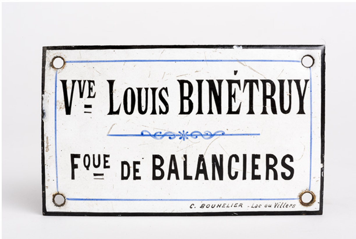
Plaque émaillée de la Fabrique de balanciers Veuve Louis Binétruy.