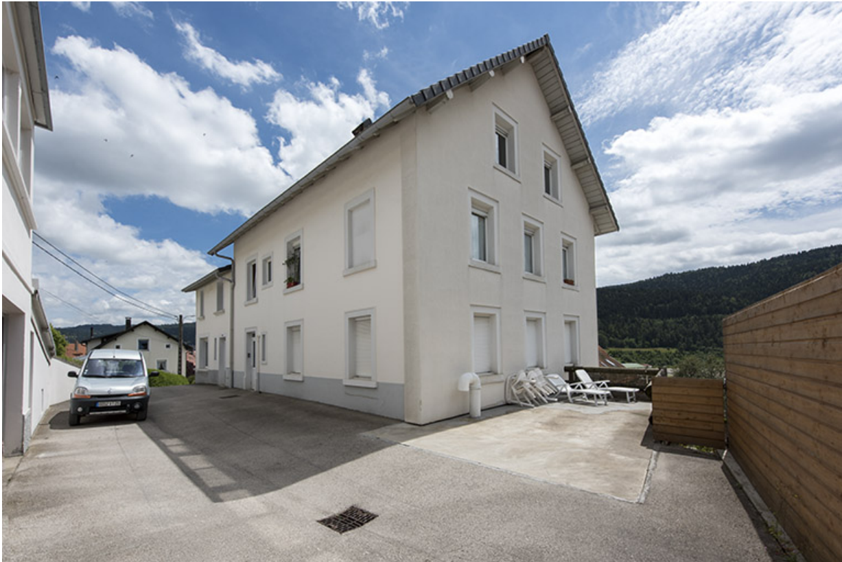
Bâtiments rue de l'Horlogerie : façades nord et ouest.