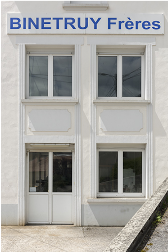
Bâtiments rue de l'Horlogerie : deux premiers niveaux de la façade latérale est. 25, Villers-le-Lac, 3 rue des Essarts