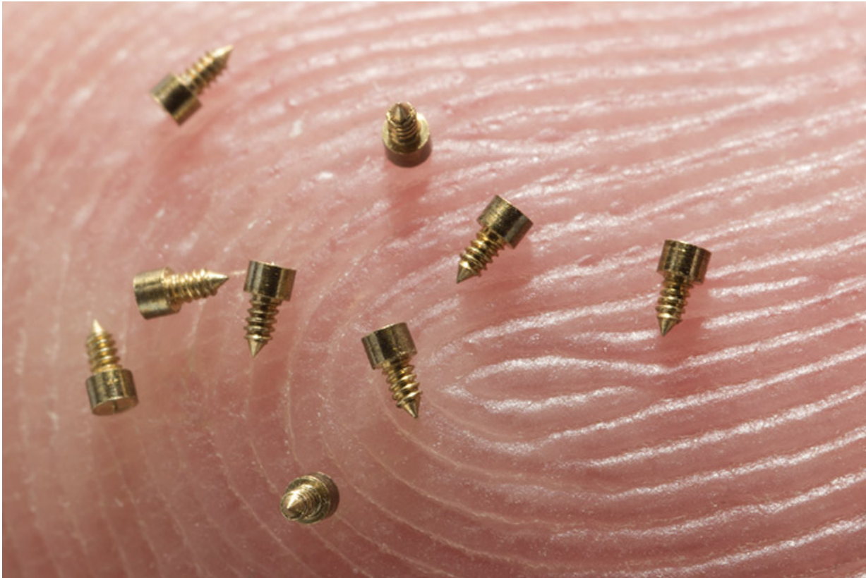
Exemple de composants fabriqués à l'usine : vis destinées au balancier de montre.