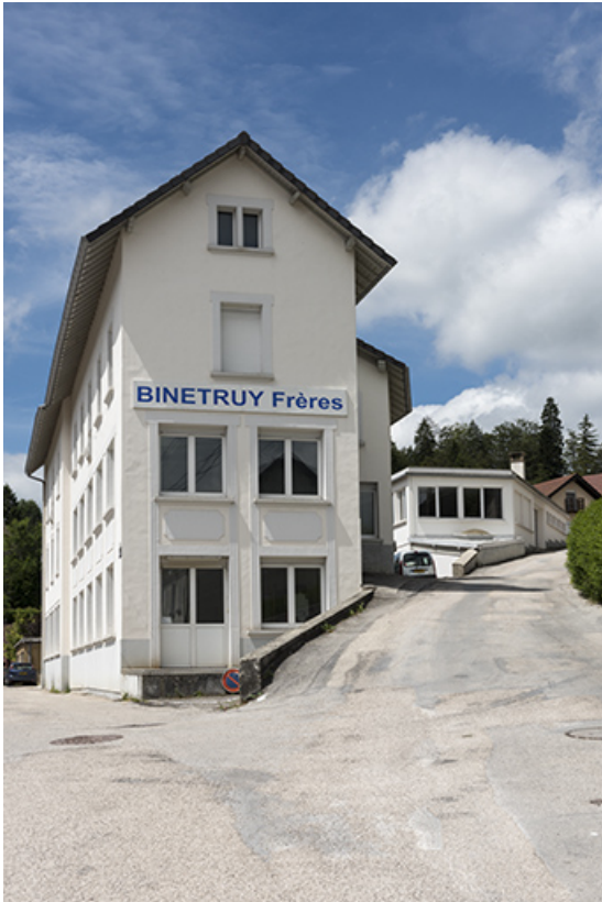
Usine de fournitures pour l'horlogerie et de décolletage Binétruy Frères (1917-1918, 1930), au 3 rue des Essarts. 25, Villers-le-Lac