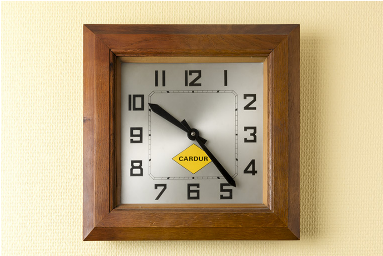
Horloge publicitaire Cardur.