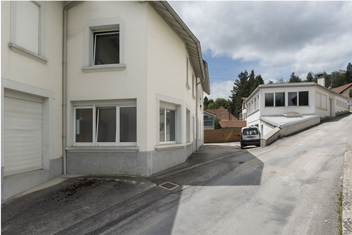
Bâtiments rue de l'Horlogerie à gauche, ancien atelier de l'outillage au carbure à droite. 25, Villers-le-Lac, 3 rue des Essarts