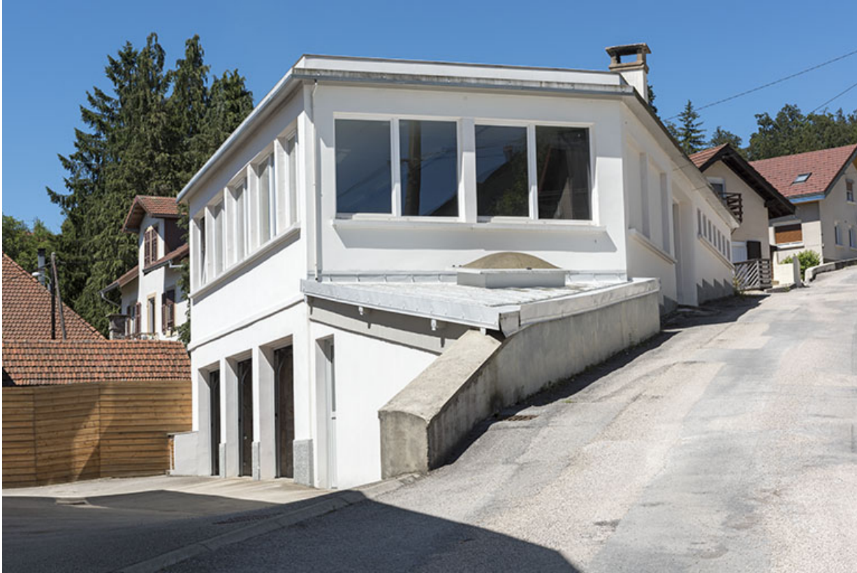
Garages et anciens bureau et atelier de l'outillage au carbure, au nord. 25, Villers-le-Lac, 3 rue des Essarts