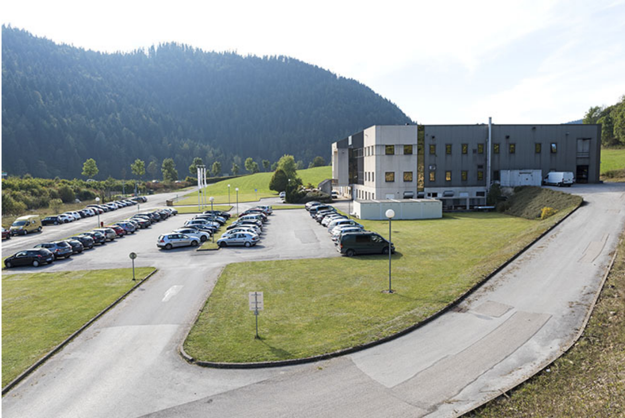
Façade latérale droite et stationnement.