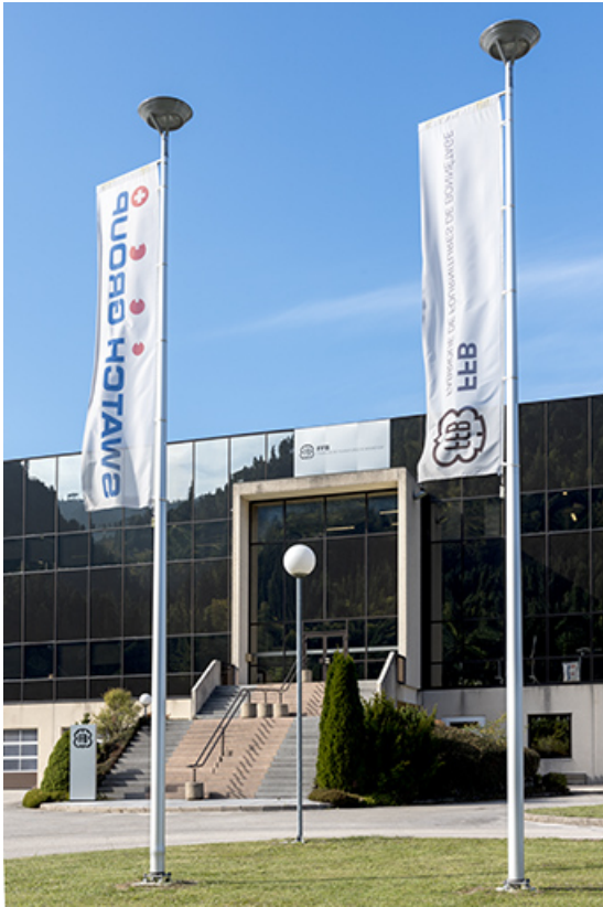
Façade antérieure : entrée monumentale.