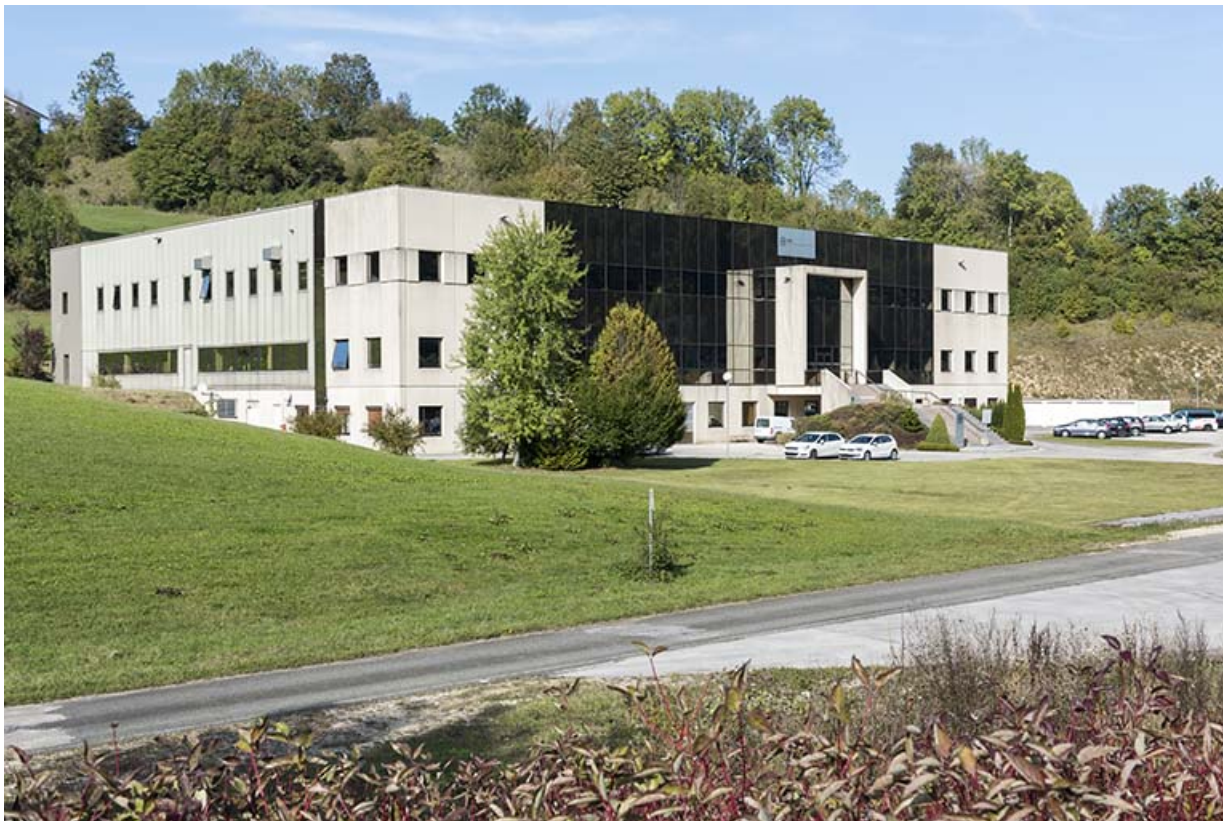
Vue d'ensemble, depuis le sud (façades antérieure et latérale gauche).