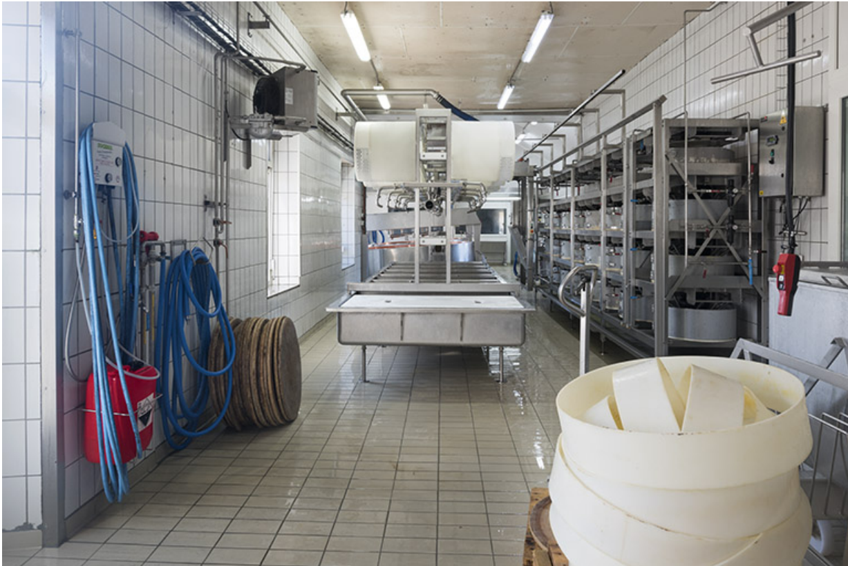
Atelier de fabrication : banc de soutirage et installation de pressage.

25, Villers-le-Lac, lieudit : les Majors