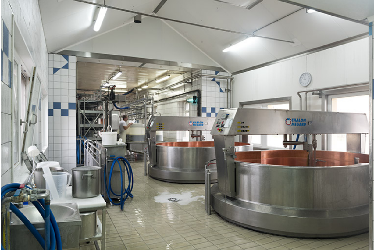
Atelier de fabrication : cuves à comté.

25, Villers-le-Lac, lieudit : les Majors