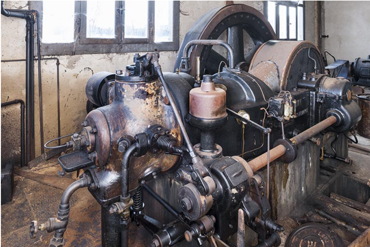
Moteur diesel Duvant. Vue de trois quarts.