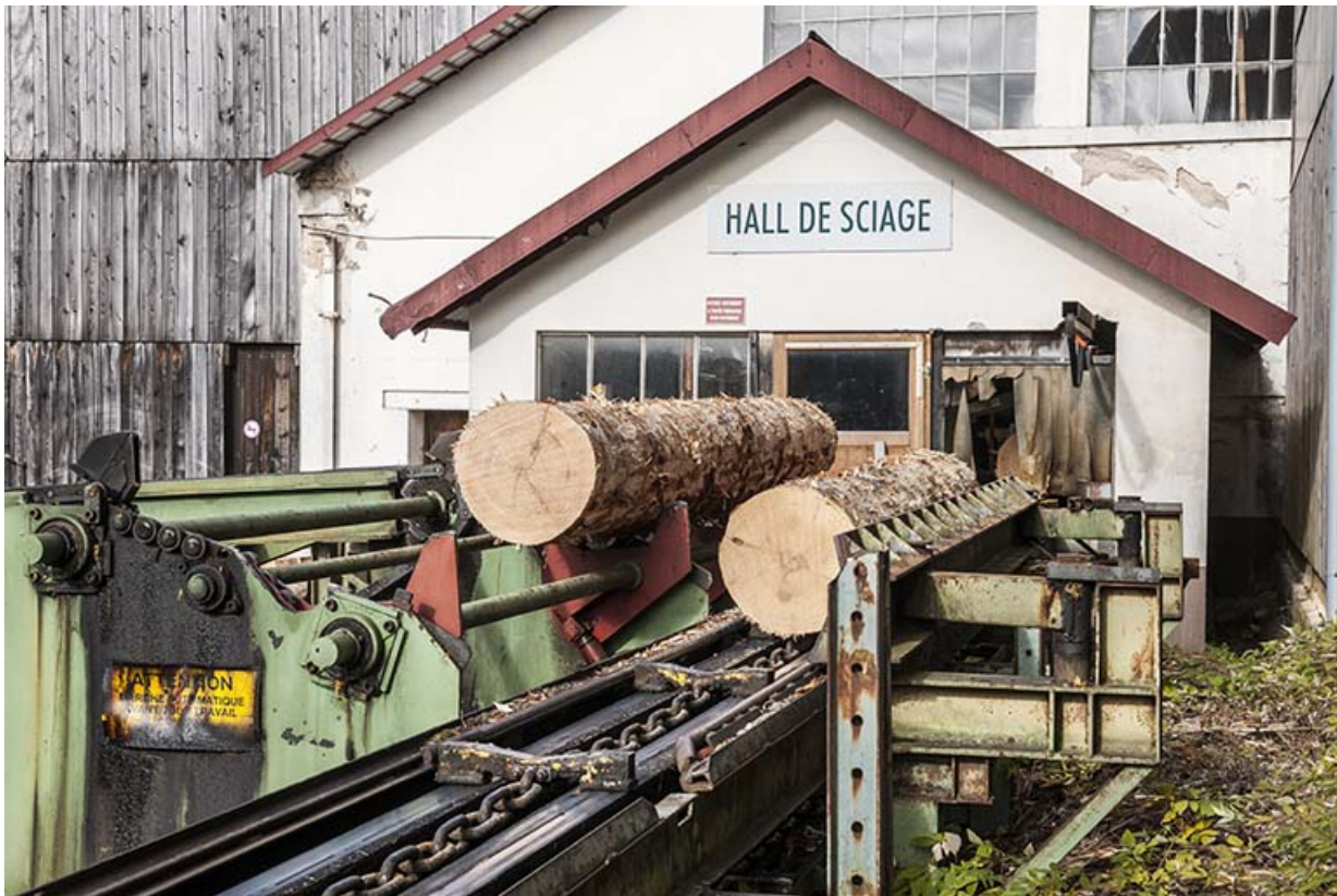
Entrée des grumes dans le hall de sciage.