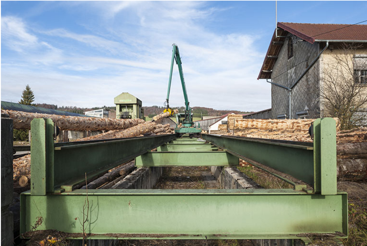
Chariot sur rail du poste d'écorçage.