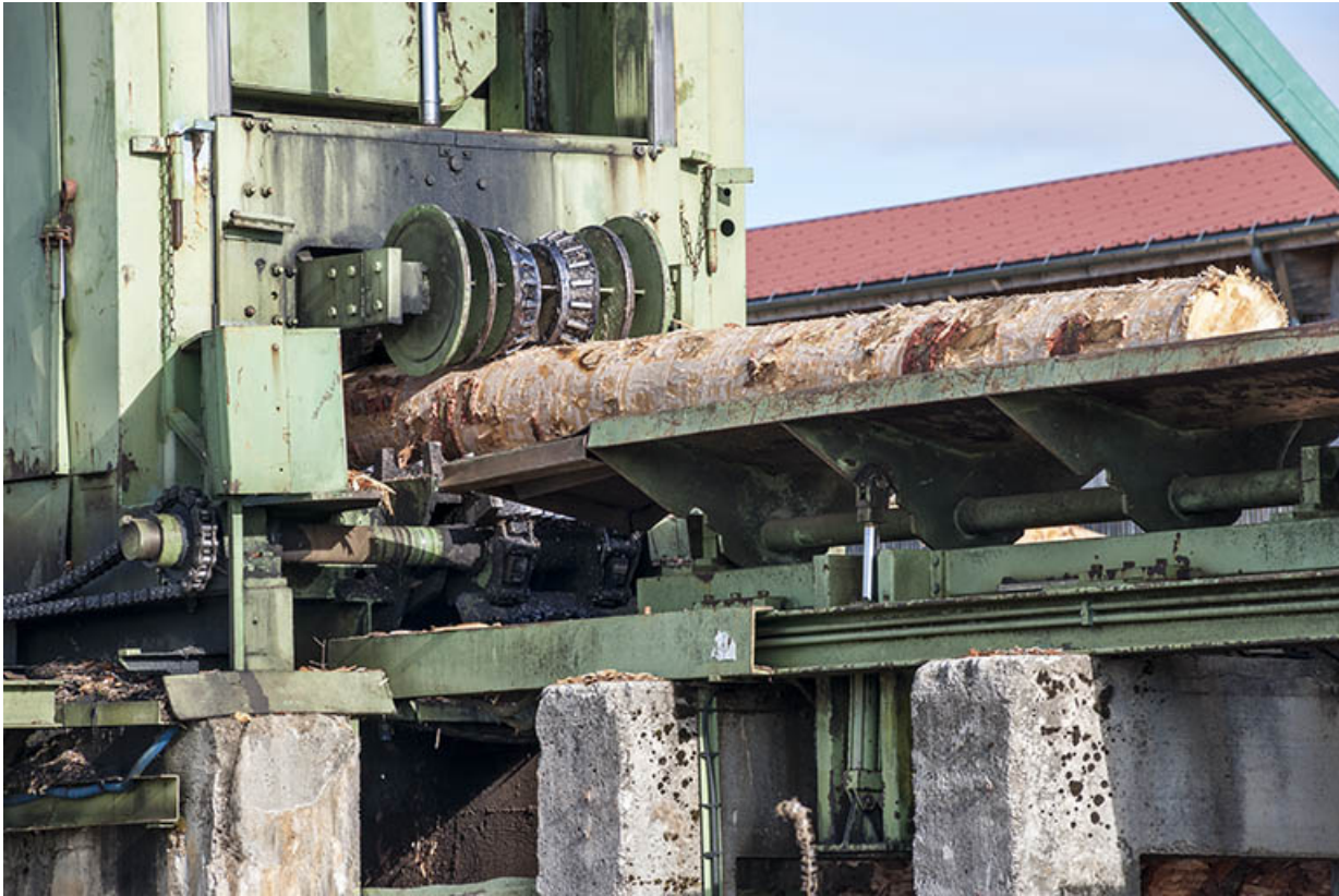
Détail du poste d'écorçage.