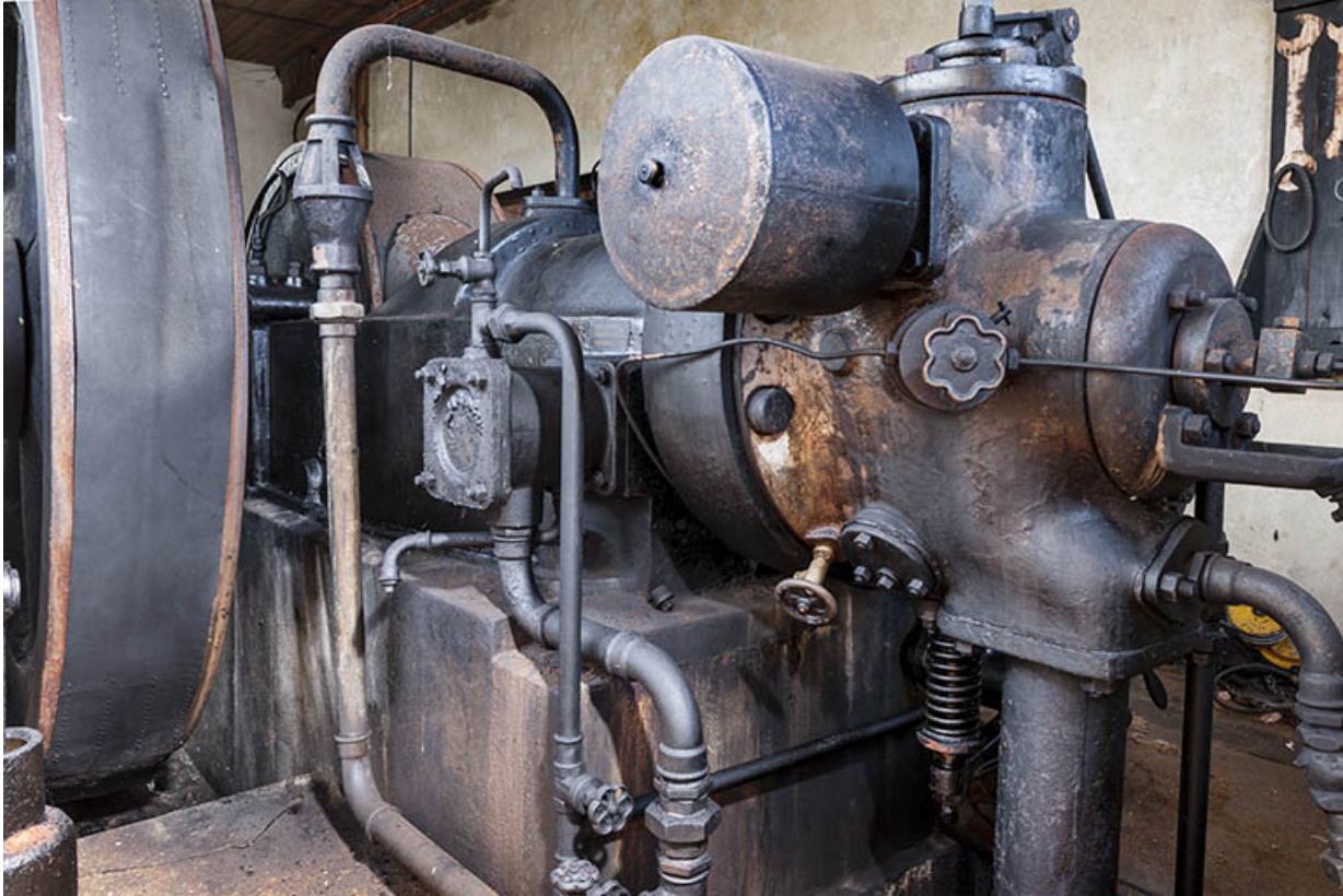
Moteur diesel Duvant. Détail.