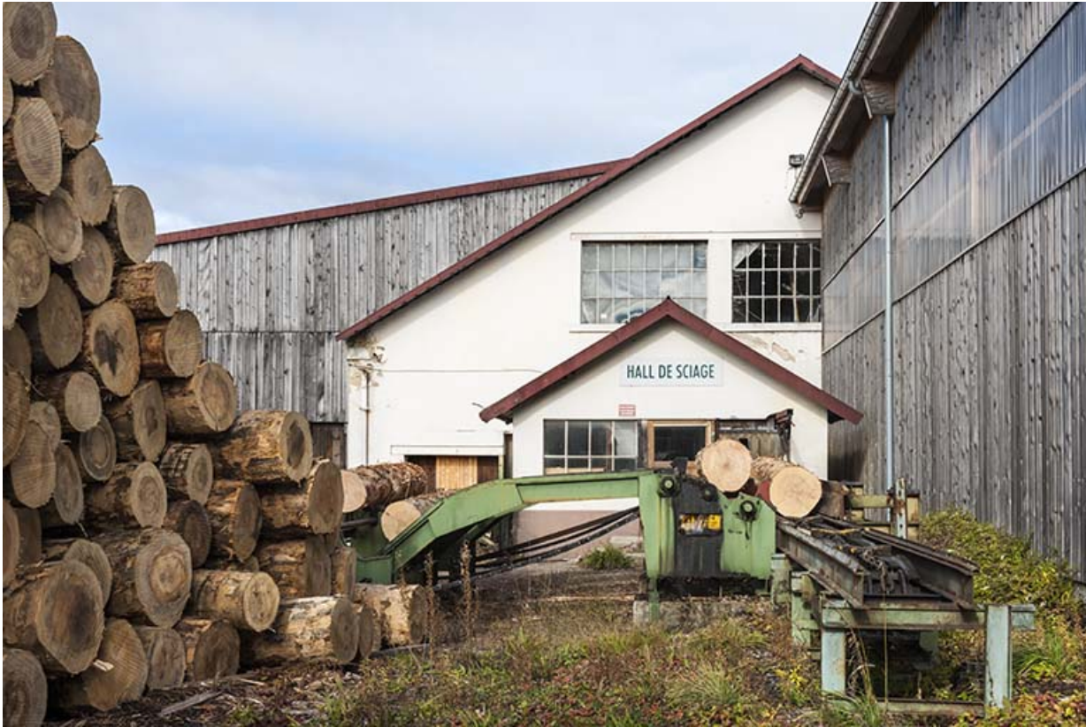
Entrée des grumes dans l'atelier de sciage.