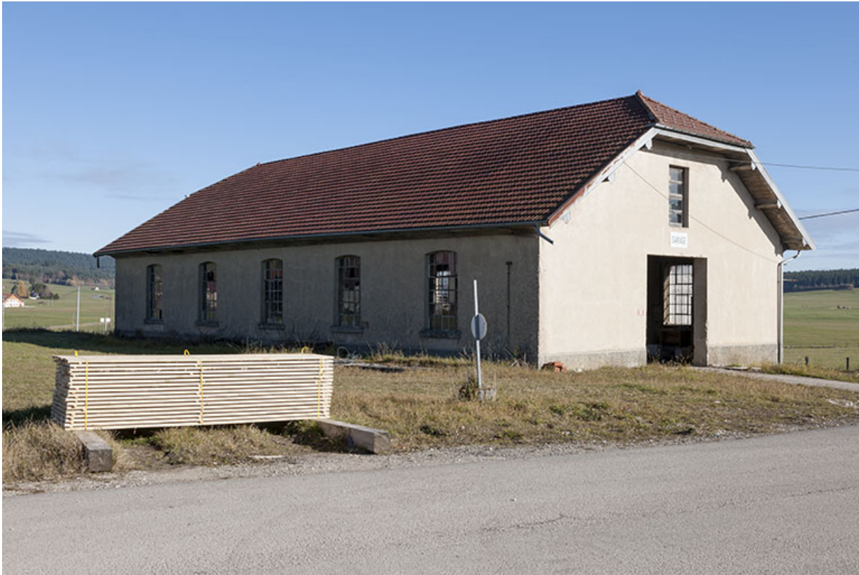
Garage vu de trois quarts.