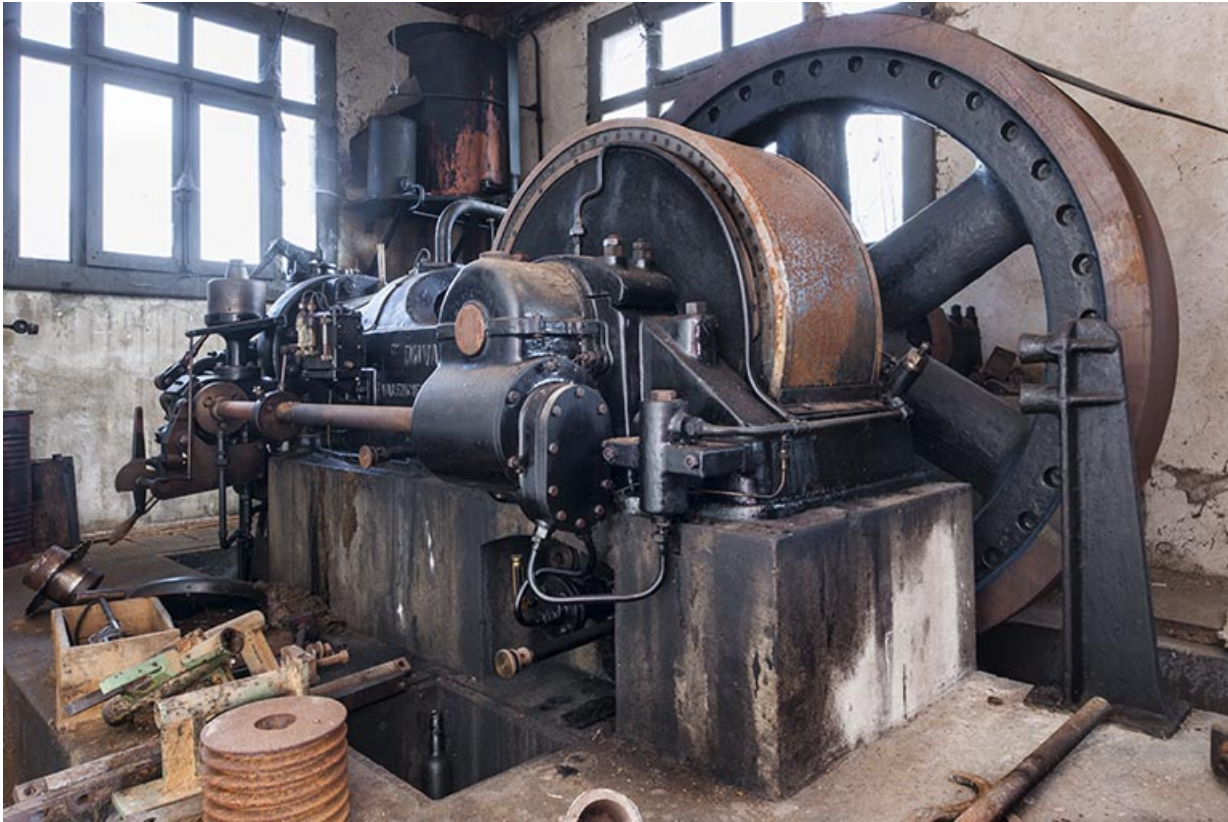
Moteur diesel Duvant.