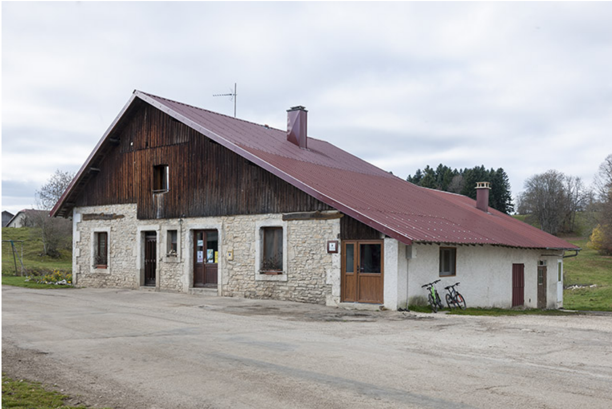
Vue de trois quarts droite.

25, Maisons-du-Bois-Lièvremont, lieudit : la Brune