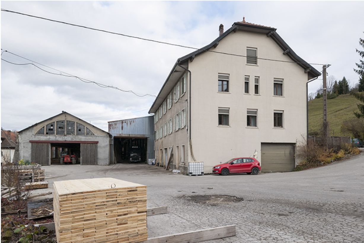
Atelier et bâtiment abritant des logements et le bureau.

25, Maisons-du-Bois-Lièvremont, lieudit : l' Oye Longe