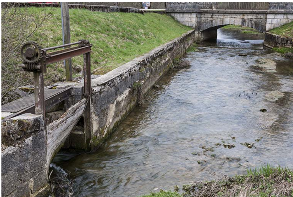
Canal d'amenée et vanne de décharge. 25, Oye-et-Pallet, 3 rue de la Baignade