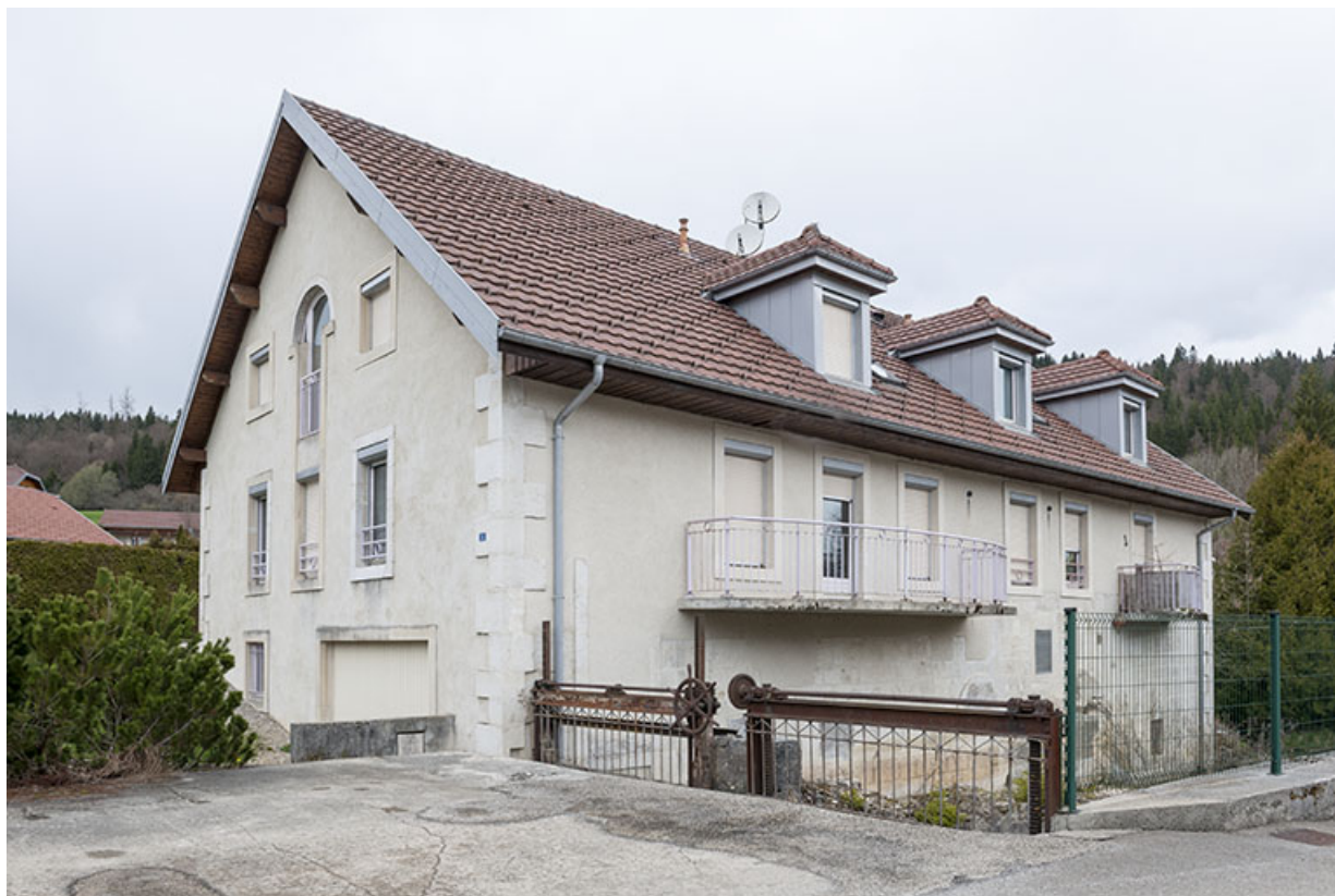
Vue depuis le sud-est.