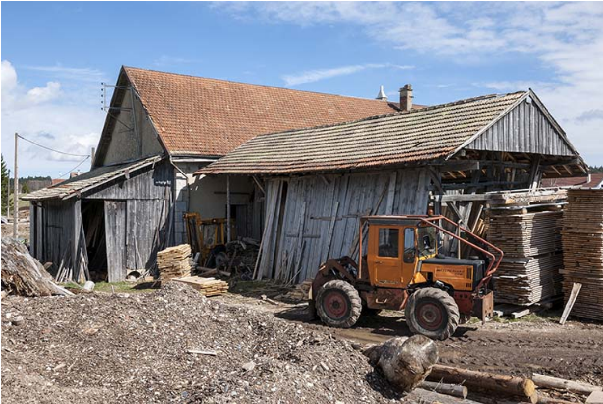
Vue de trois quarts arrière.