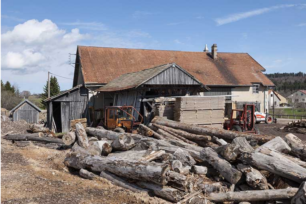
Vue depuis le sud.