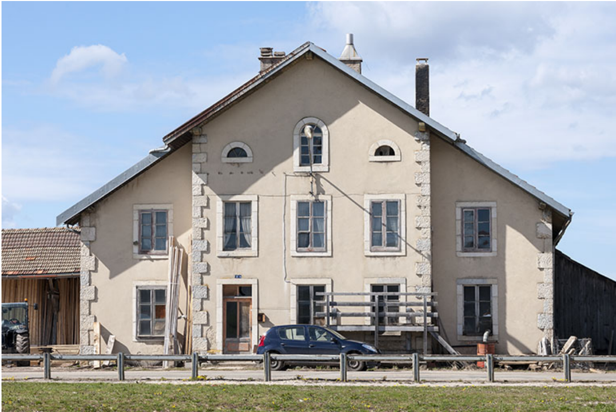
Façade antérieure vue de face.