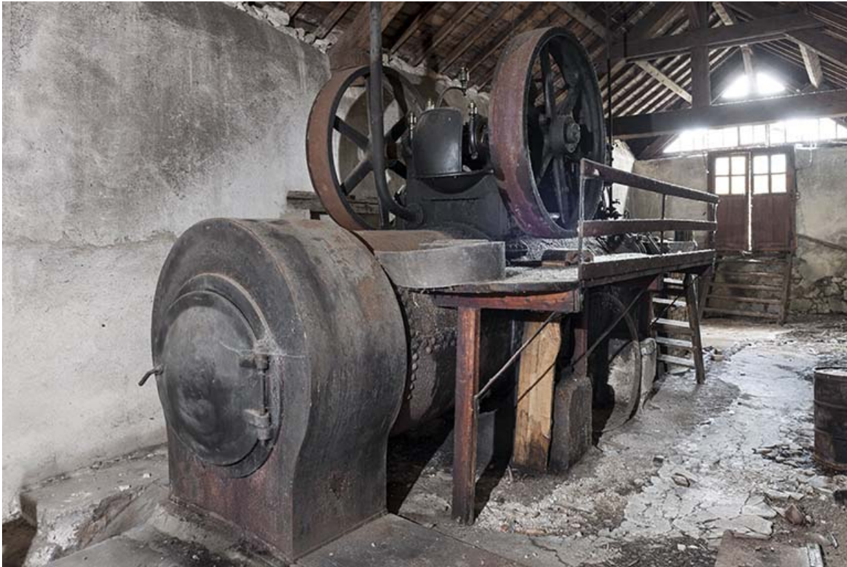
La machine à vapeur vue de trois quarts.

25, Chapelle-des-Bois, lieudit : Les Mortes