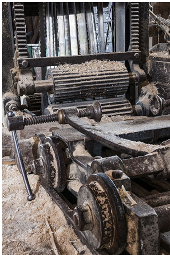
Détail du chariot.

25, Chapelle-des-Bois, lieudit : Les Mortes