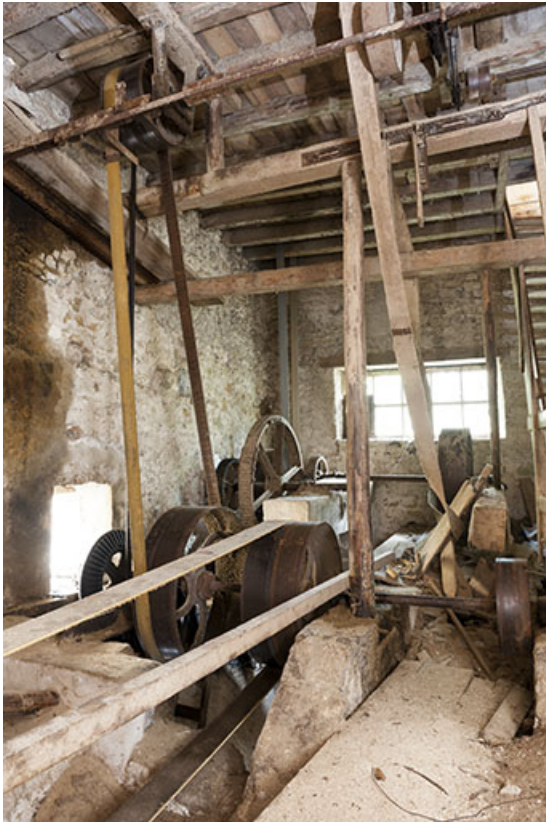
Vue d'ensemble de l'étage de soubassement. Système de transmission de la turbine hydraulique. 25, Chapelle-des-Bois, lieudit : Les Mortes