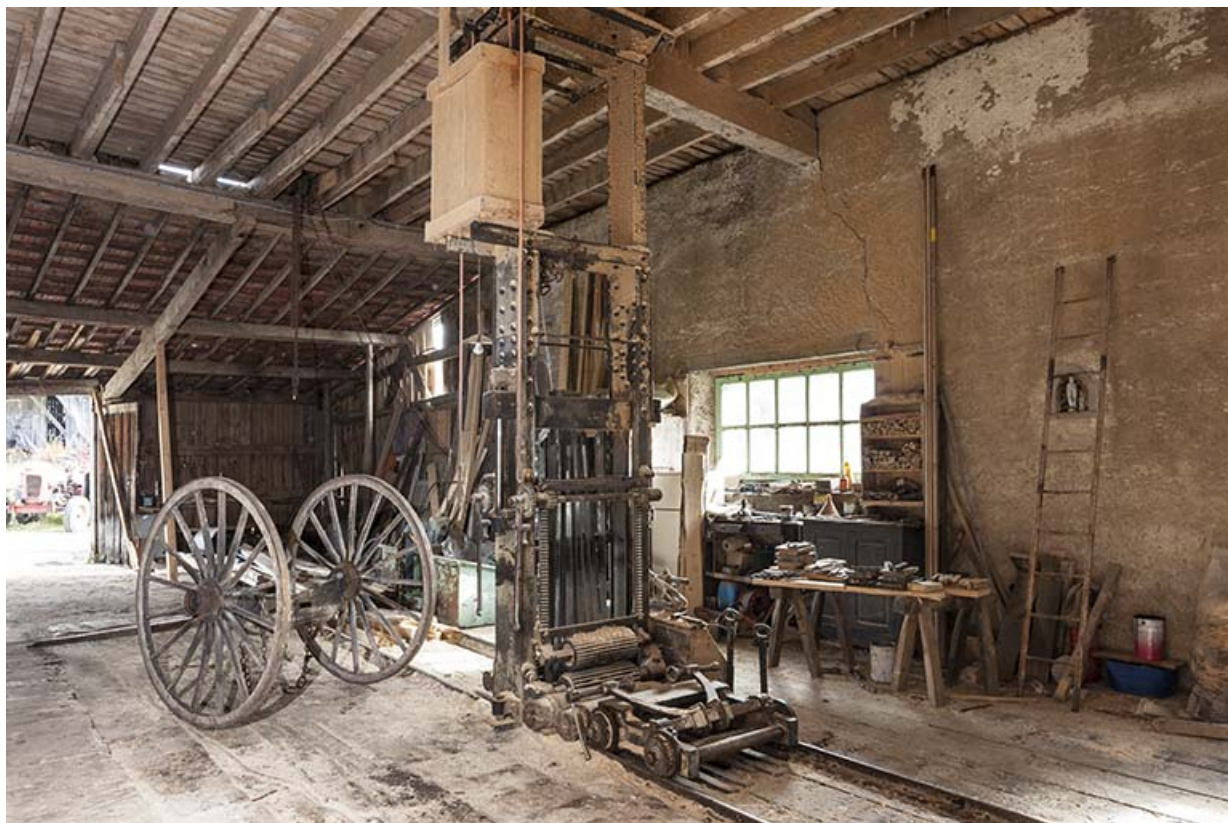
Vue intérieure de l'atelier de scierie.

25, Chapelle-des-Bois, lieudit : Les Mortes