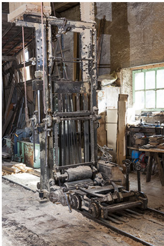
Châssis de scie et son chariot.

25, Chapelle-des-Bois, lieudit : Les Mortes