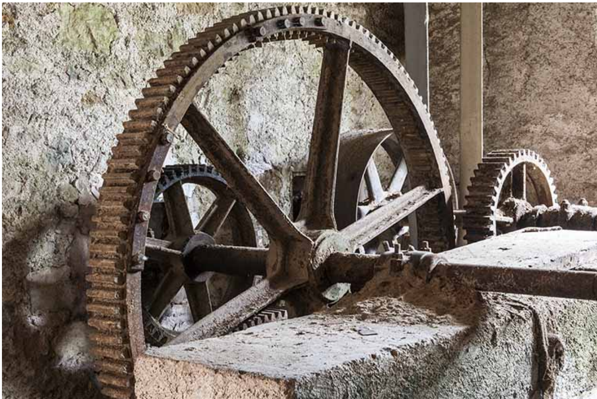
Détail des roues dentées.

25, Chapelle-des-Bois, lieudit : Les Mortes