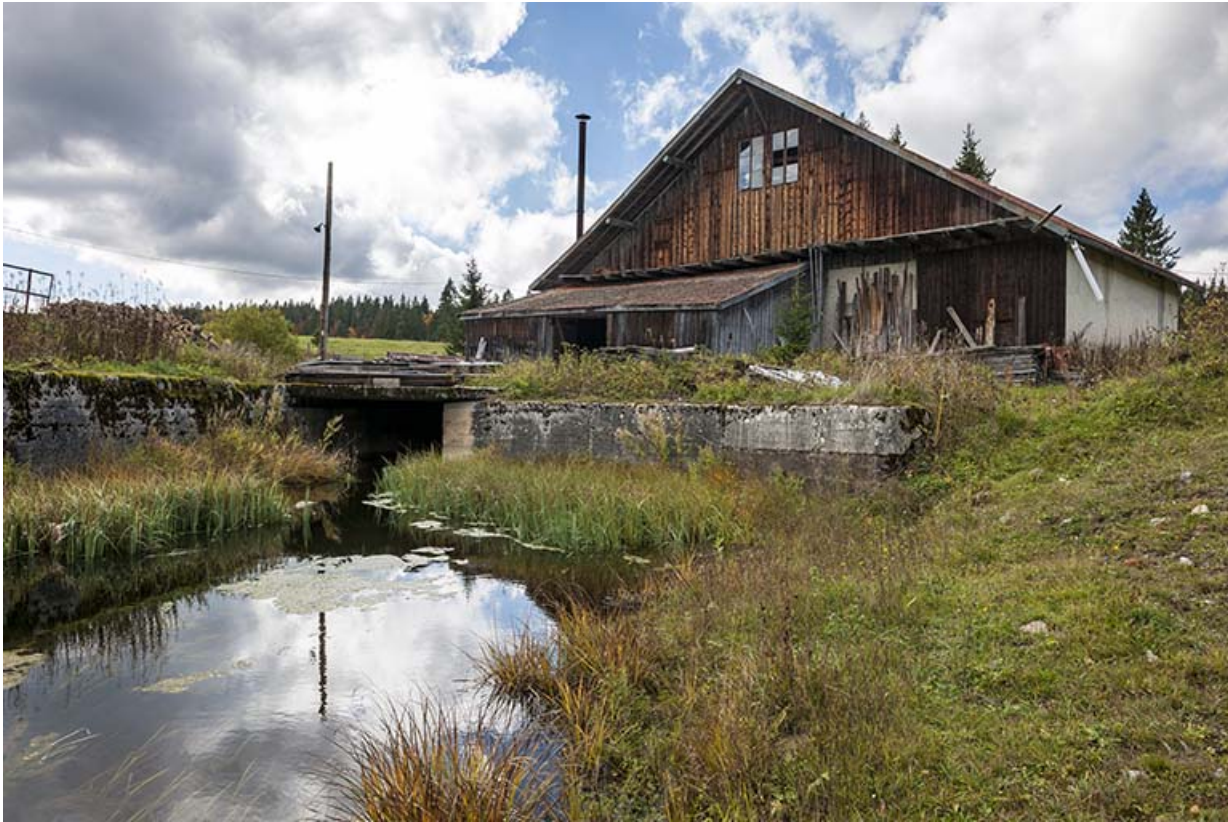
Vue de la scierie depuis le bassin de retenue.

25, Chapelle-des-Bois, lieudit : Les Mortes