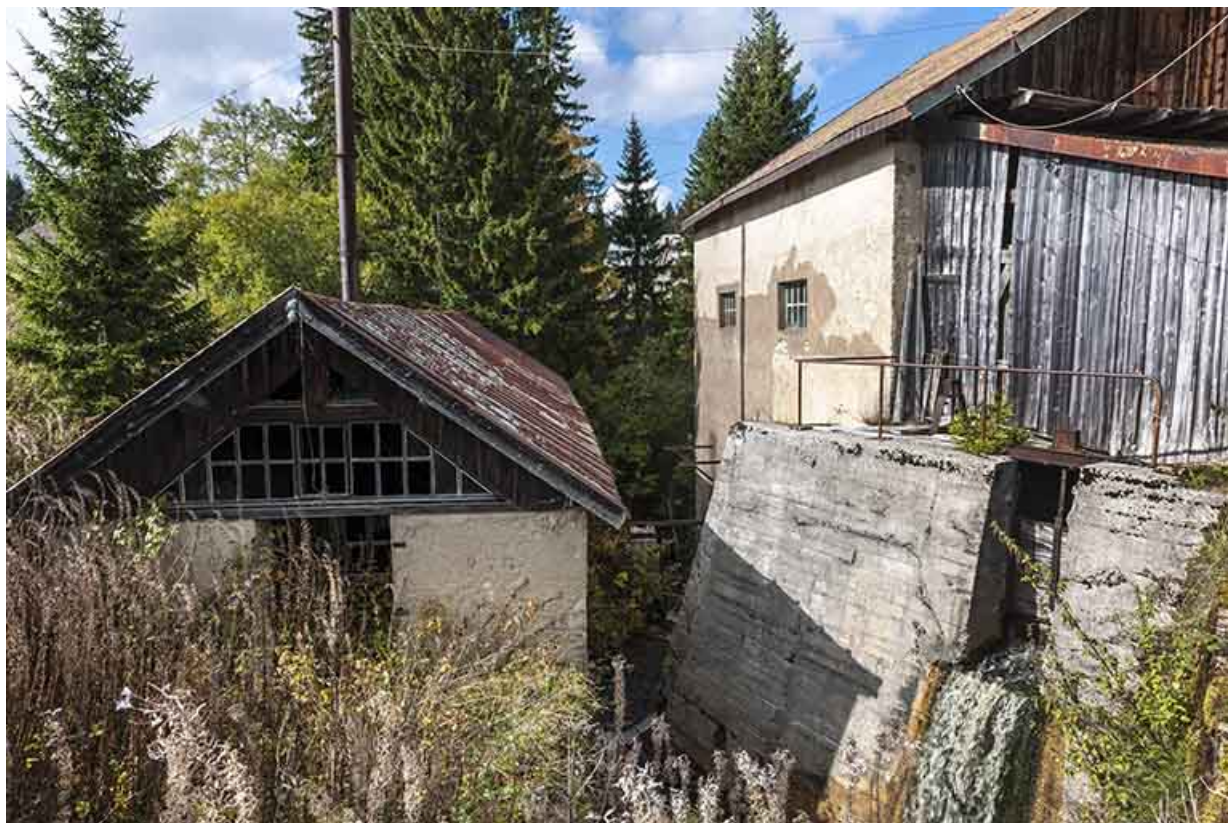
Salle de la machine à vapeur et atelier de la scierie.

25, Chapelle-des-Bois, lieudit : Les Mortes