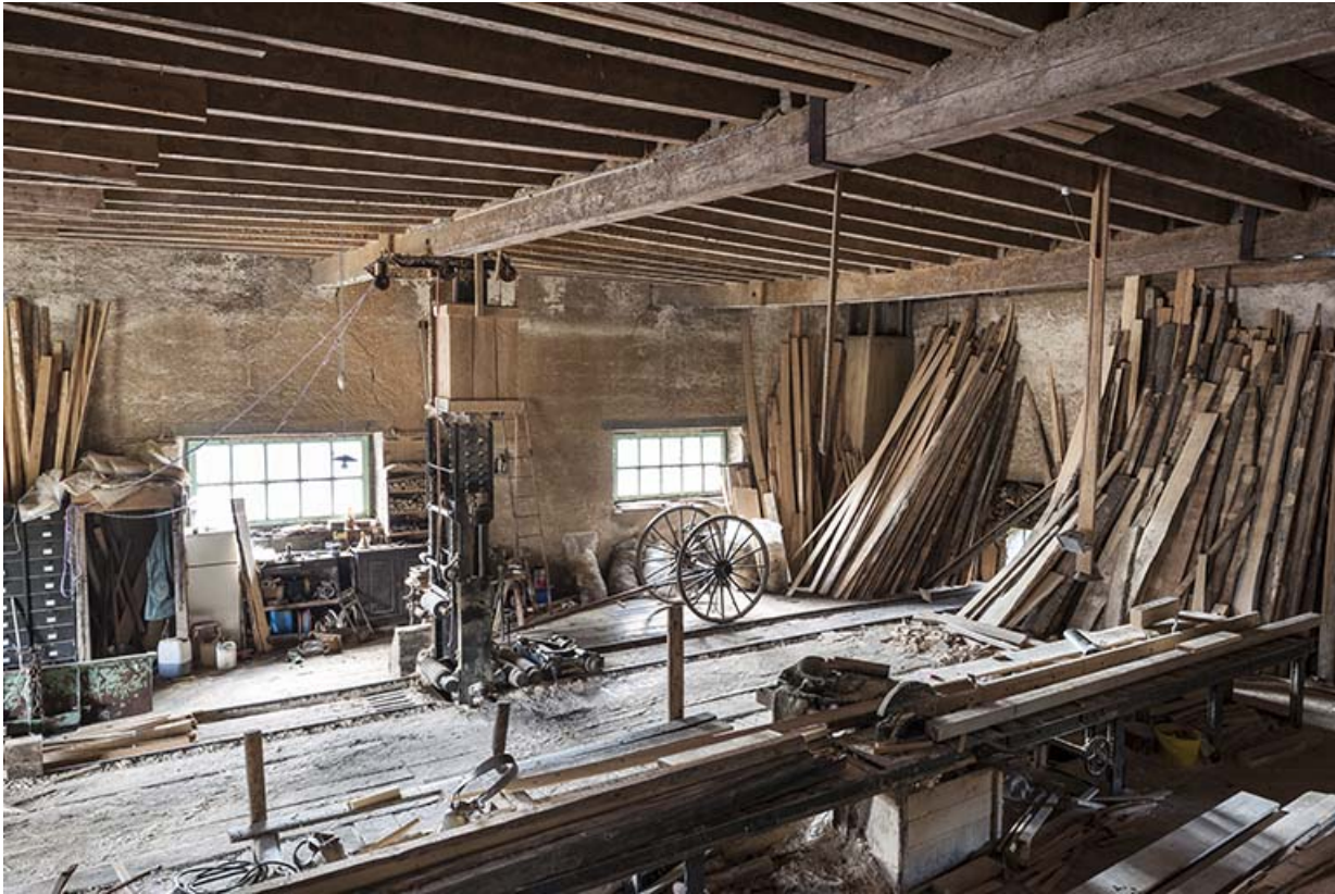
Vue plongeante sur l'atelier de scierie.