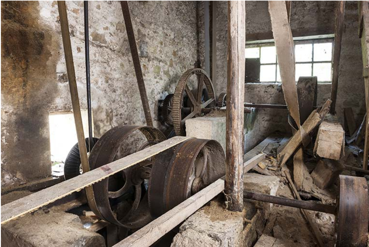
Etage de soubassement. Axe de transmission de la turbine et poulies de renvoi. 25, Chapelle-des-Bois, lieudit : Les Mortes