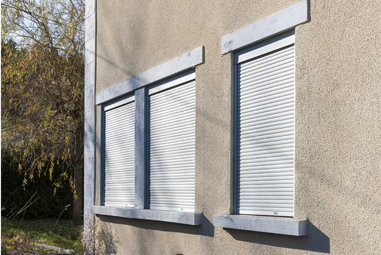
Façade latérale gauche : fenêtre horlogère.