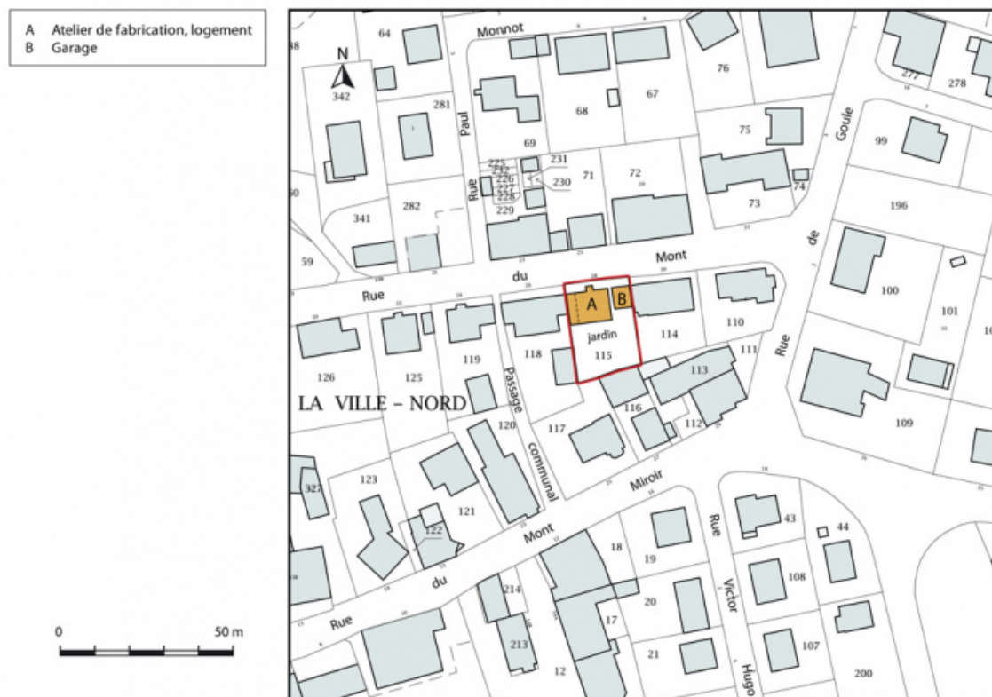
Plan-masse et de situation. Extrait du plan cadastral, 2015, section AB.