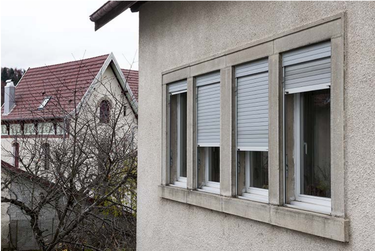
Façade latérale gauche : fenêtres multiples. 25, Maîche