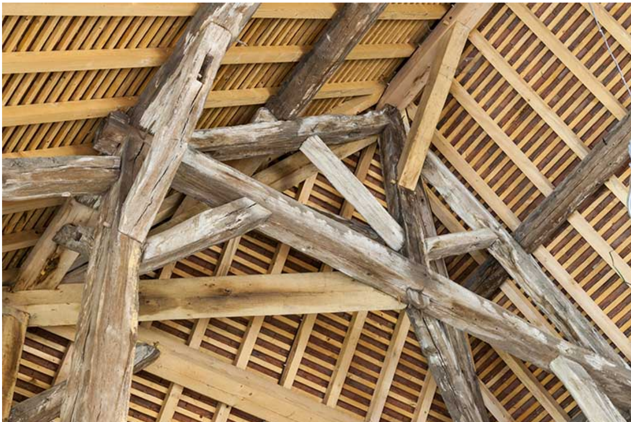
Détail de la charpente de la croupe.