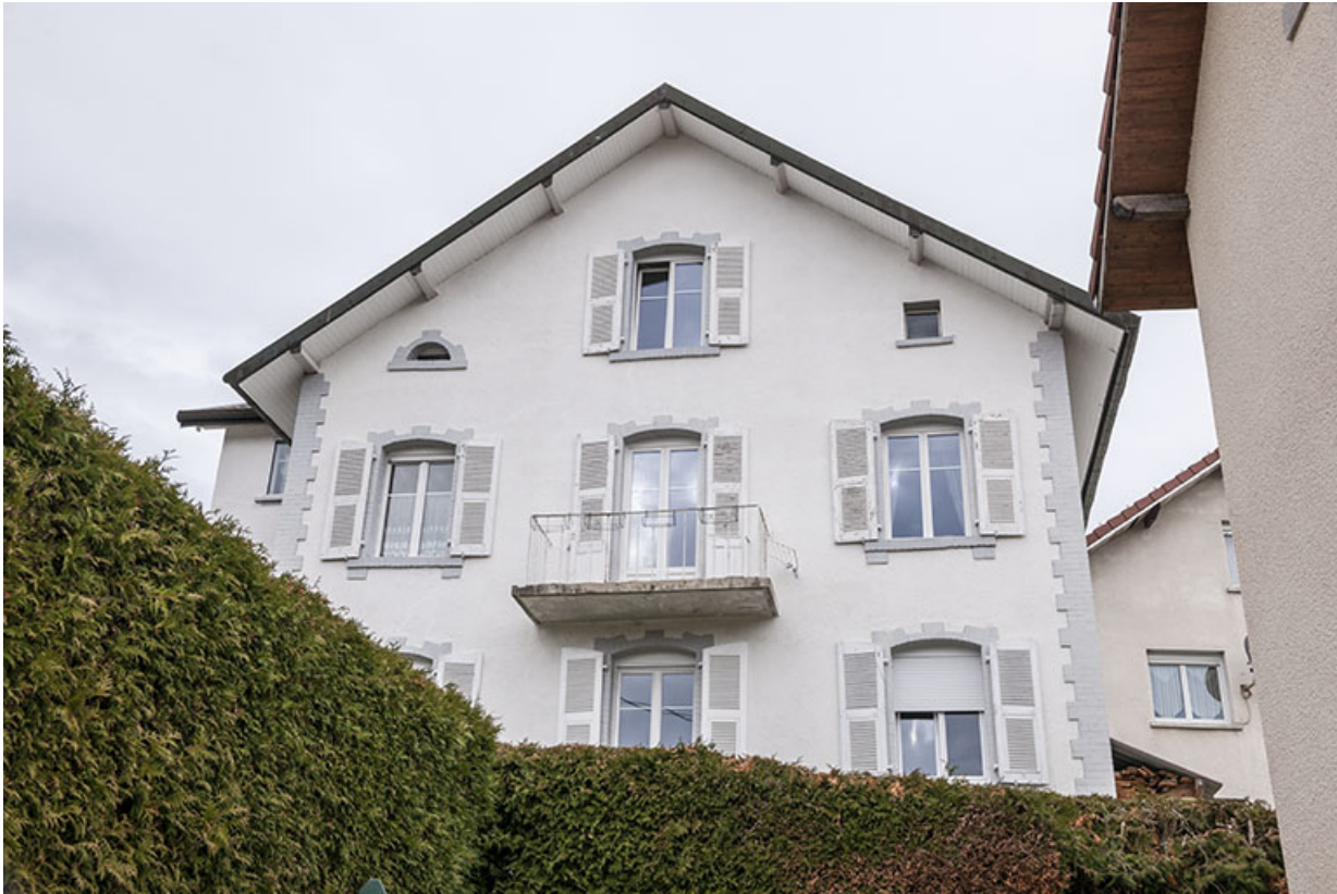
Façade latérale droite, vue en contre-plongée.