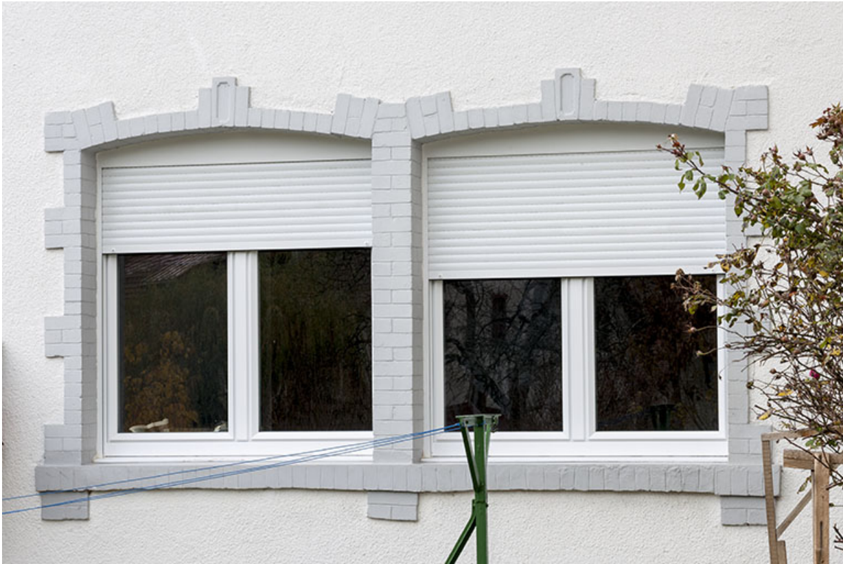
Façade postérieure : fenêtre horlogère.