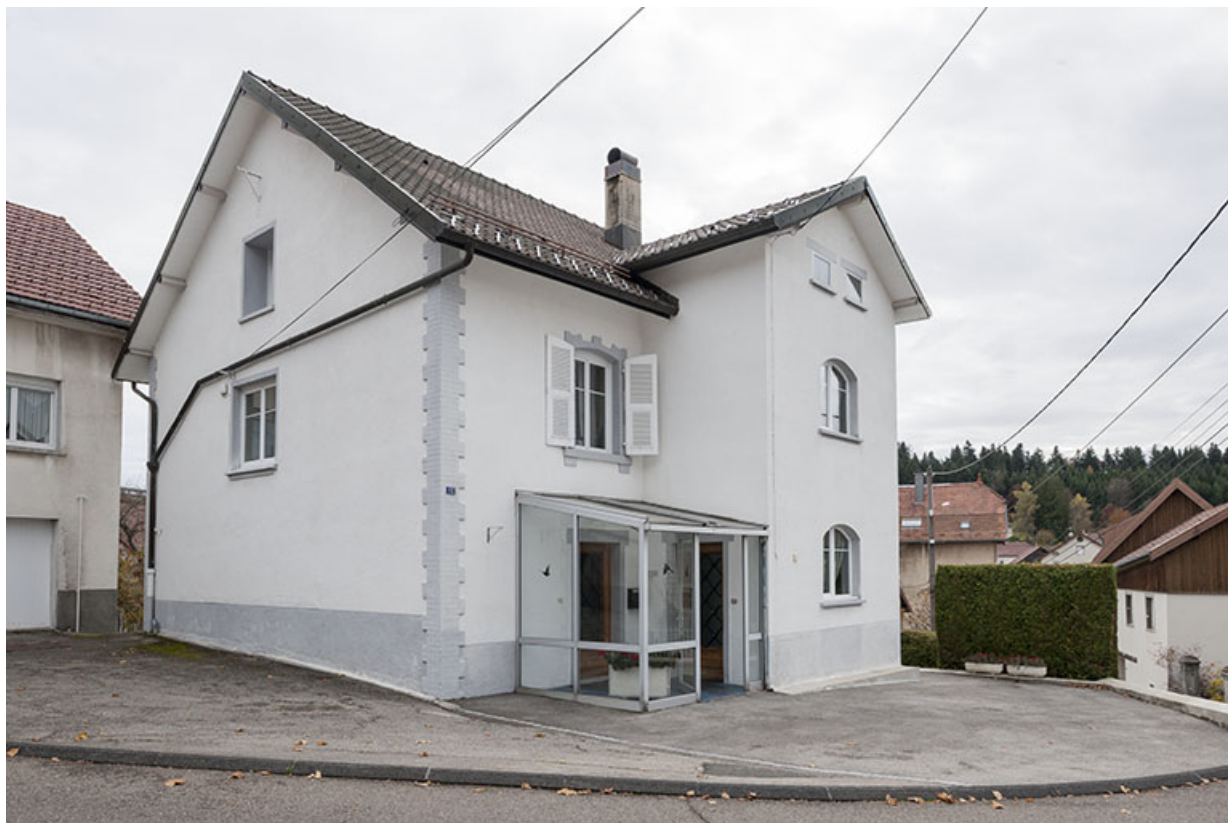
Façades antérieure et latérale gauche.