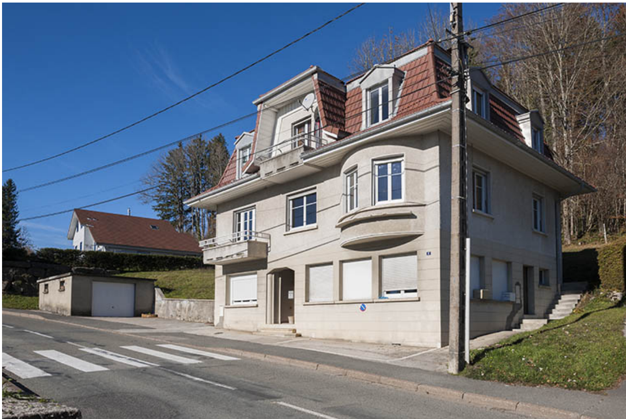
Vue d'ensemble, depuis le sud-est.