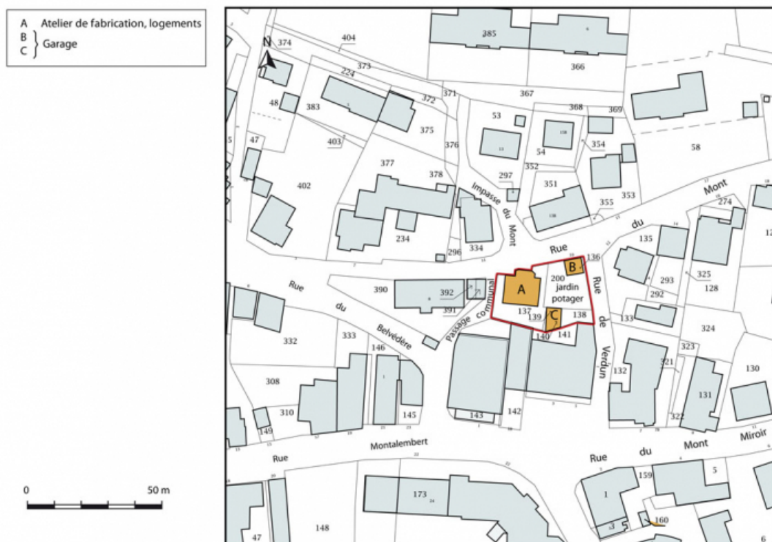
Plan-masse et de situation. Extrait du plan cadastral, 2015, section AB. 25, Maîche, 10 rue du Mont