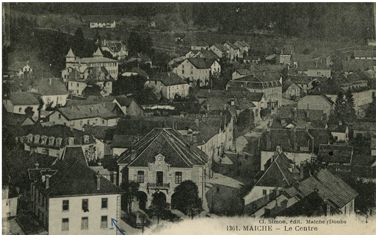
1361. Maïche - Le centre [vu depuis le clocher de l'église], 1ère moitié 20e siècle.