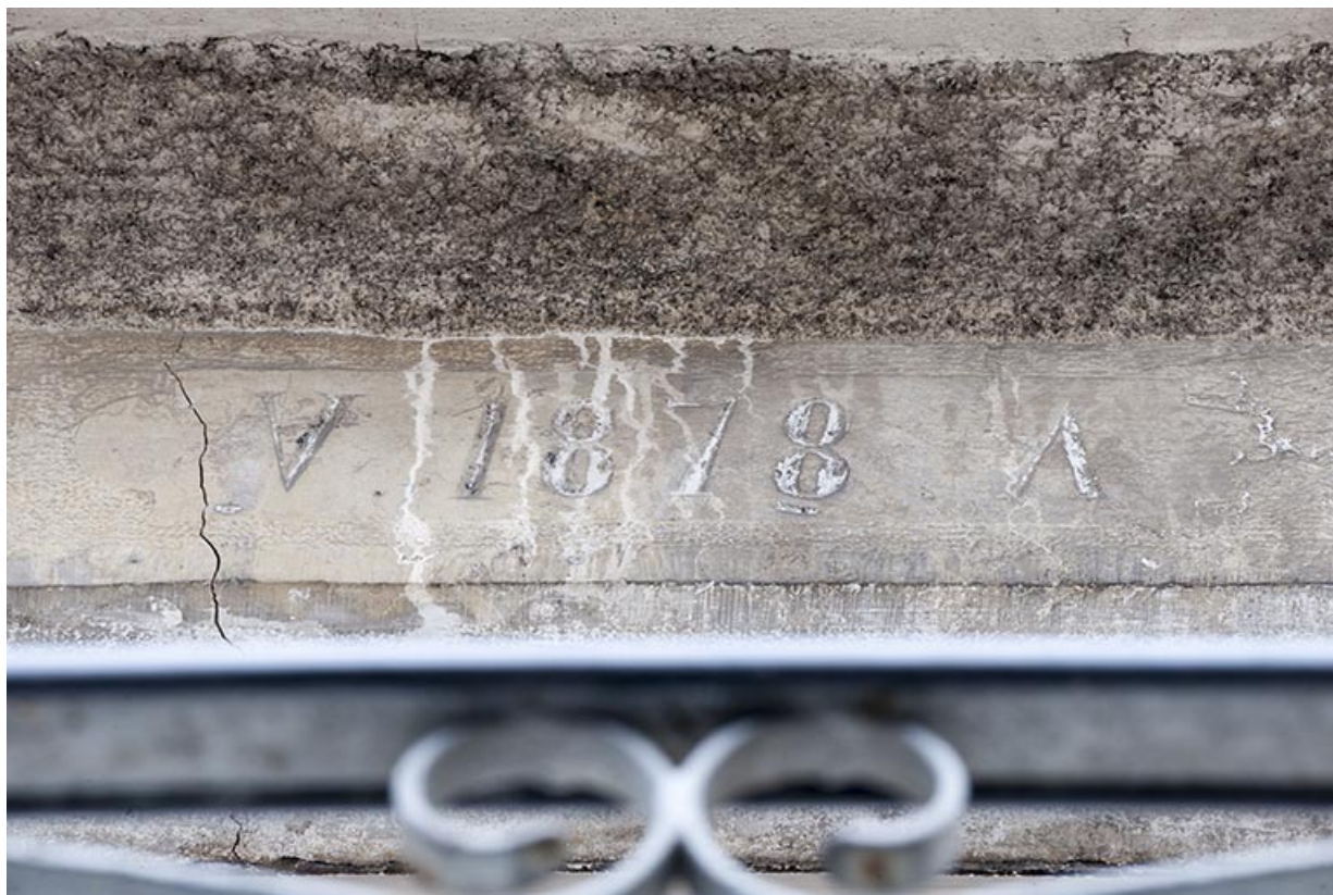
Maison : date 1878 et initiales sur le linteau de l'entrée.