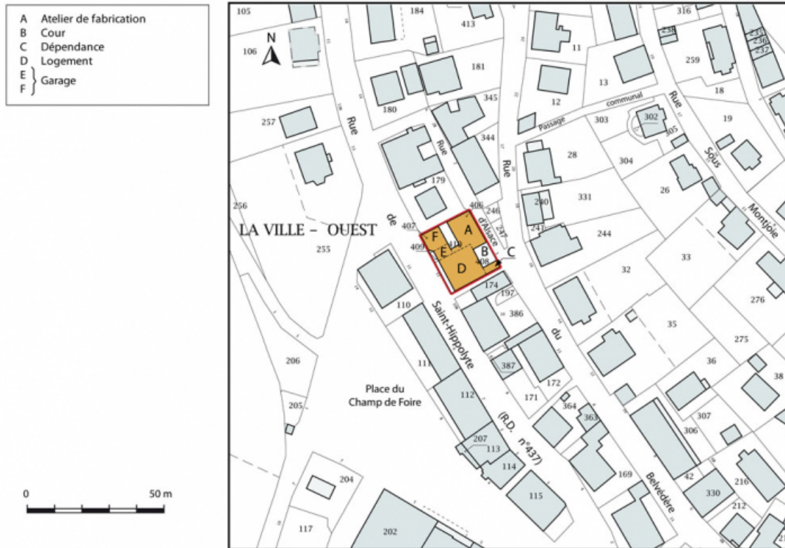
Plan-masse et de situation. Extrait du plan cadastral, 2015, section AB. 25, Maïche, 12 rue de Saint-Hippolyte