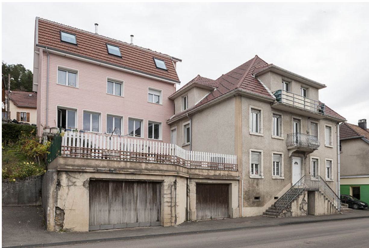
Vue d'ensemble de la maison et de l'atelier. 25, Maîche