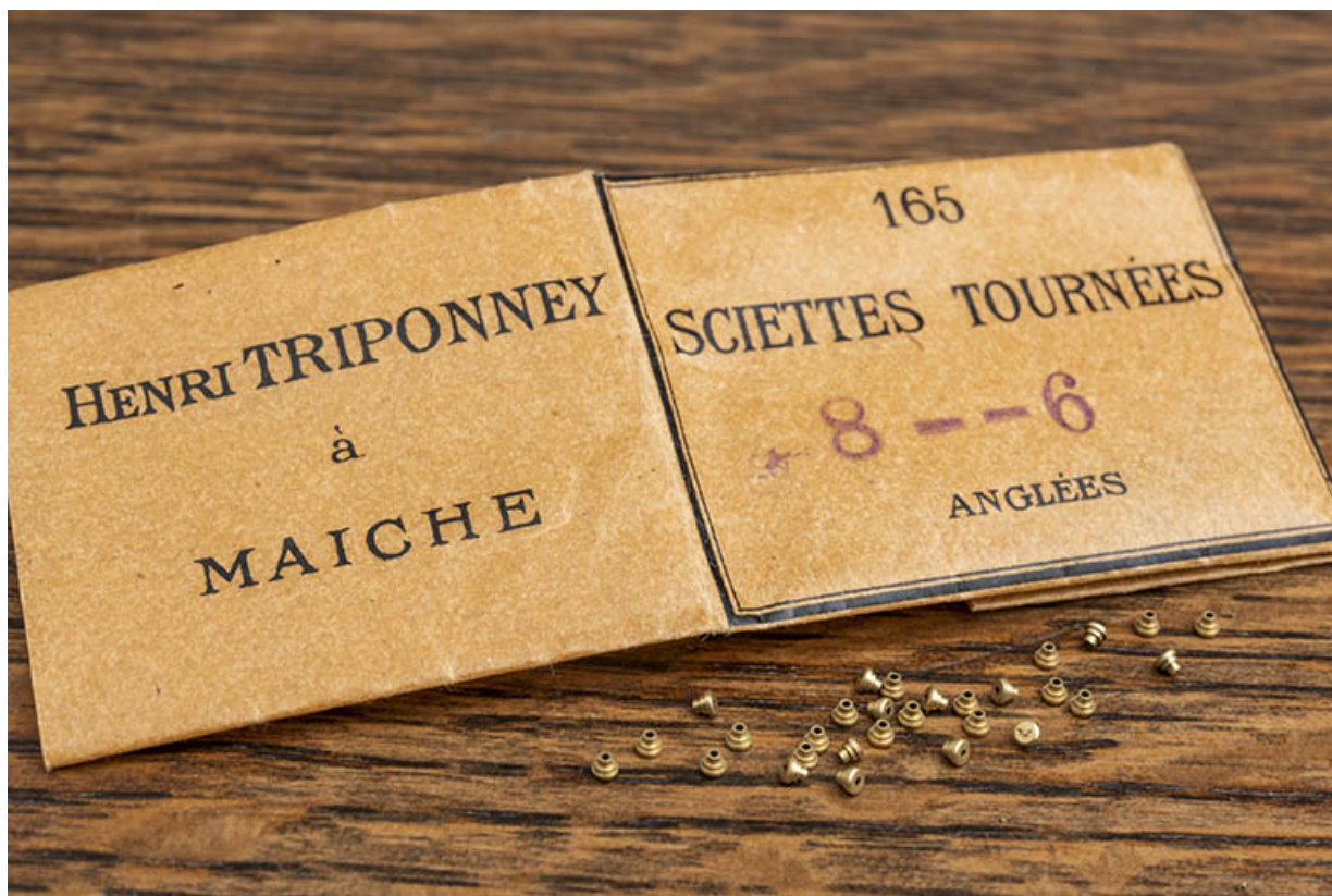
Paquet de sciottes des Ets Triponney, à Maïche (collection particulière). 25, Maïche, 12 rue de Saint-Hippolyte