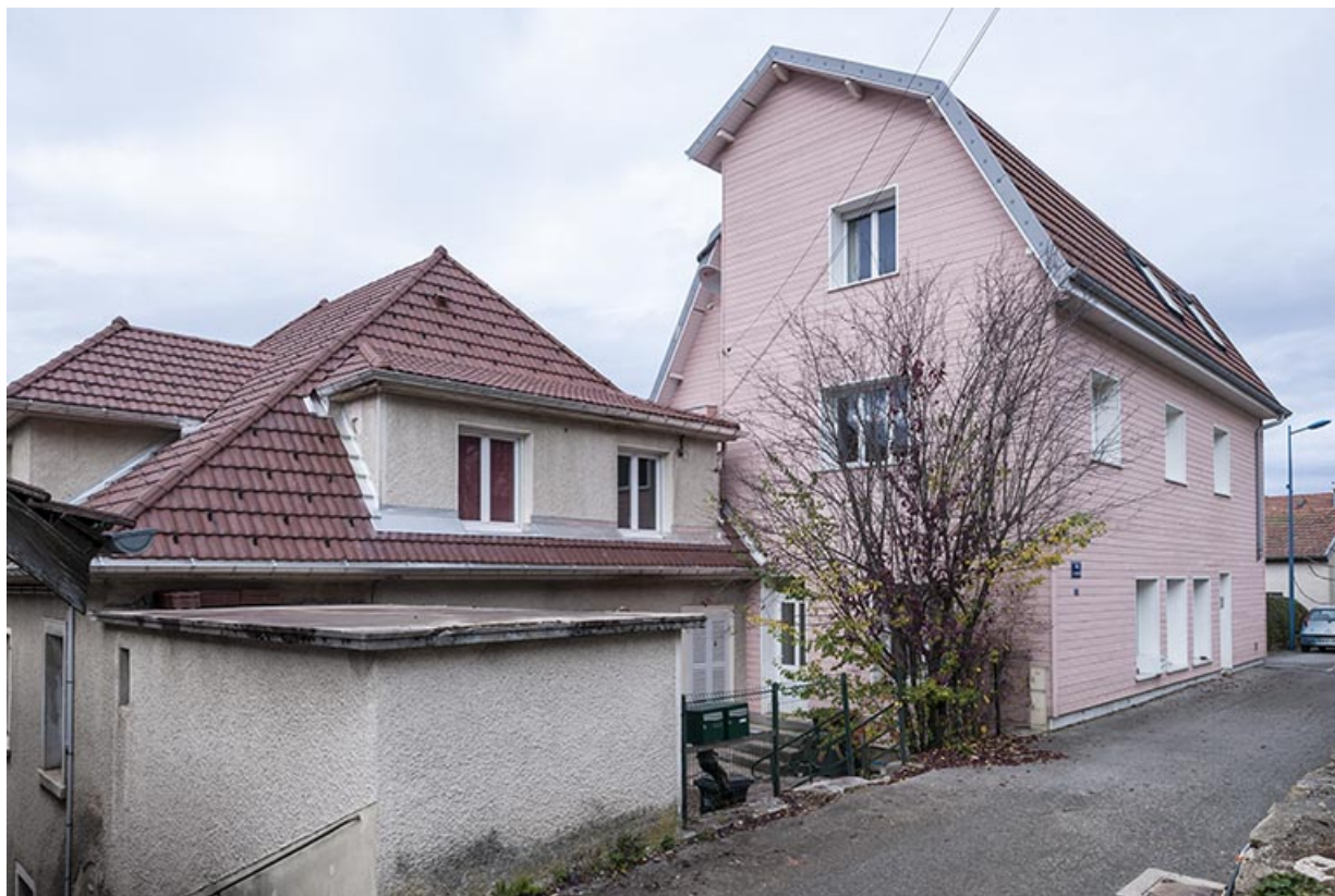
Maison (façade postérieure) et atelier (façades postérieure et latérale droite). 25, Maîche, 12 rue de Saint-Hippolyte