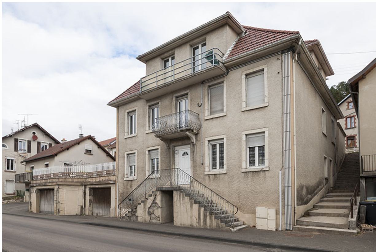
Maison : façades antérieure et latérale droite.