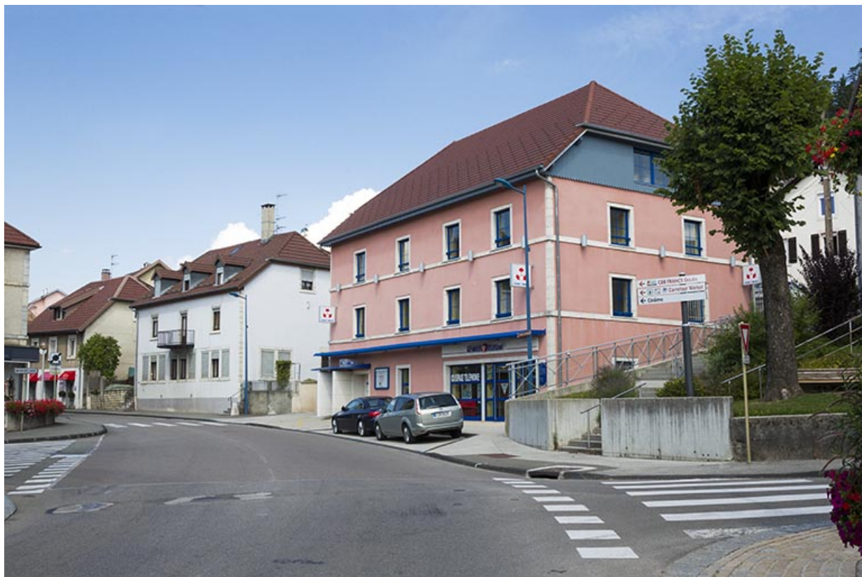
Vue d'ensemble, depuis le sud.