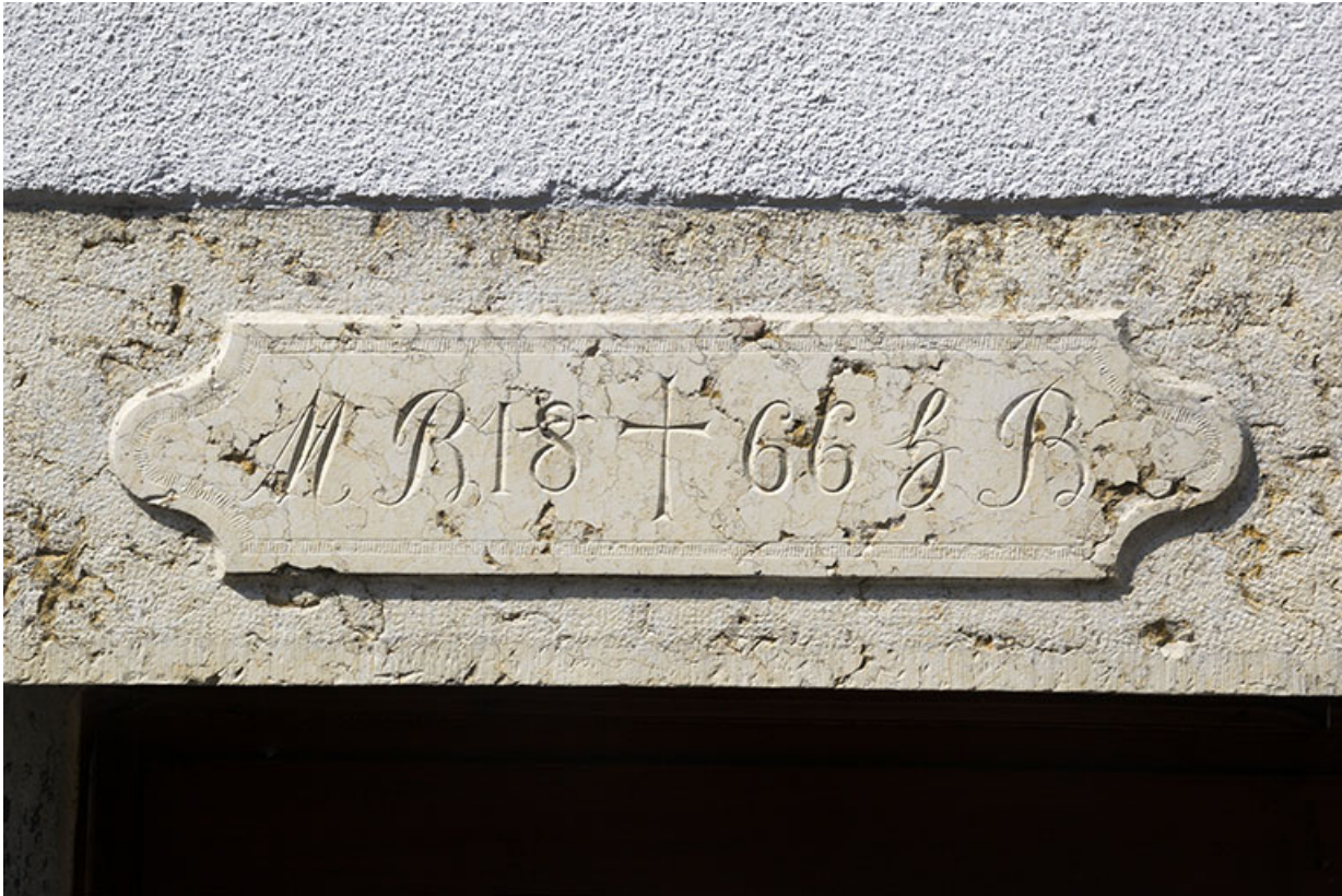
Façade latérale droite : linteau daté 1866.