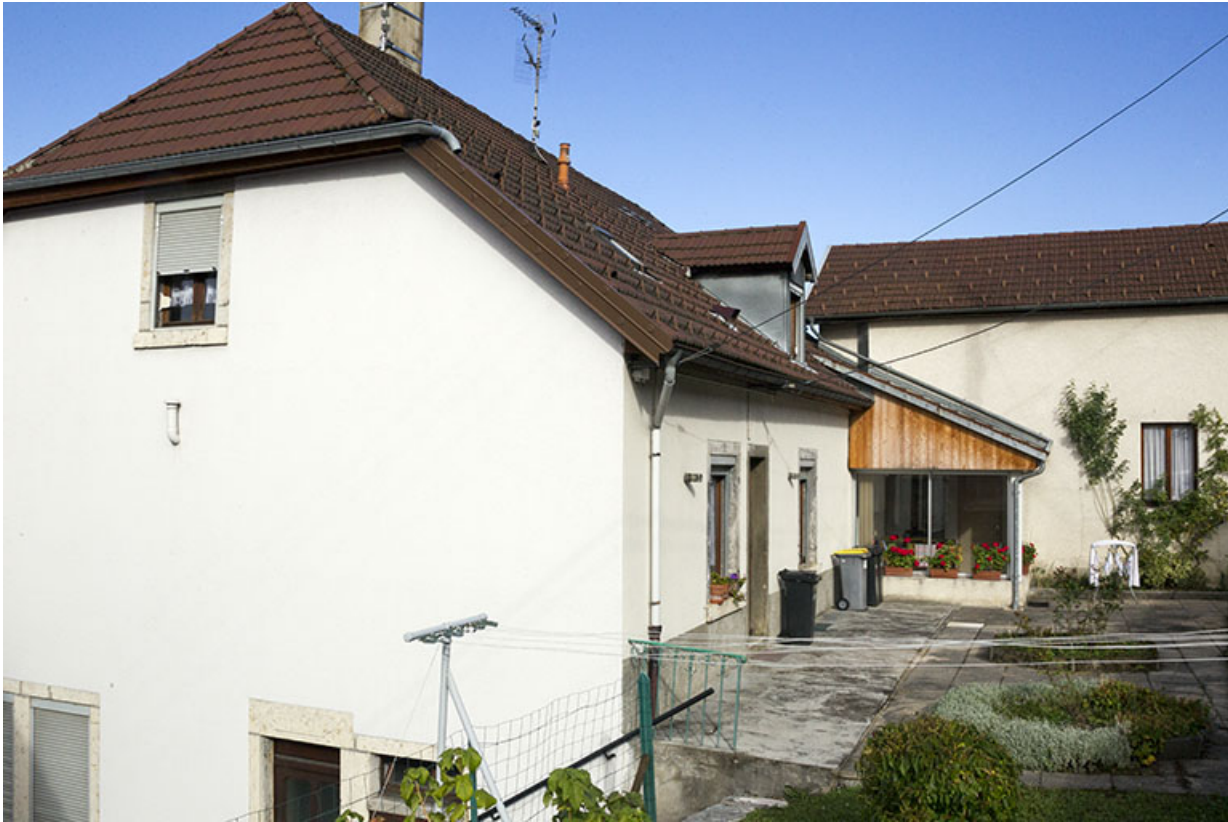
Façades postérieure et latérale droite.