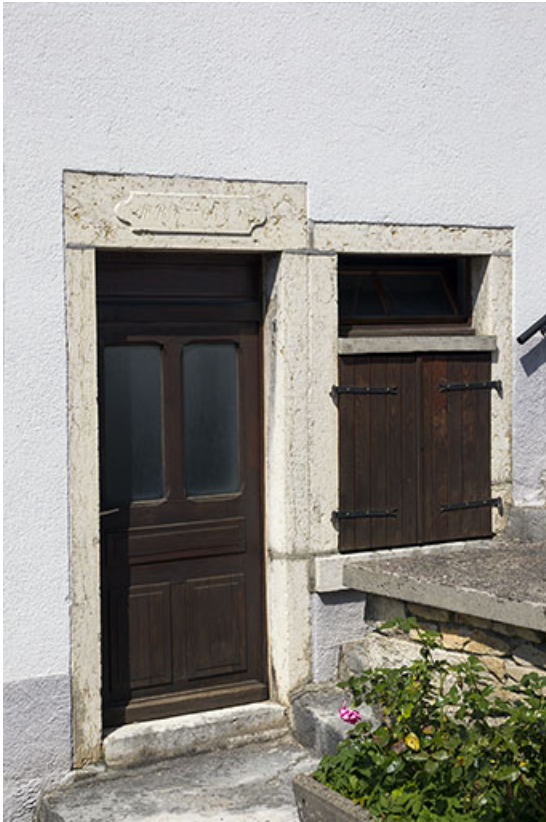
Façade latérale droite : porte avec linteau daté.